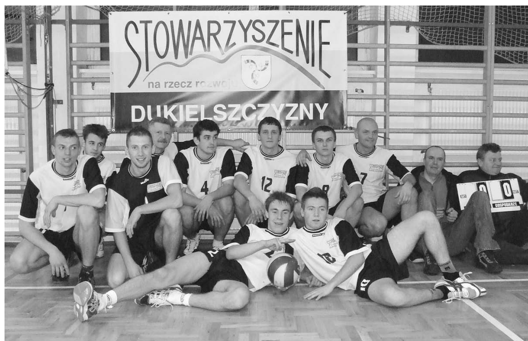
Na zdjęciu wicemistrzowie Powiatowej Amatorskiej Ligi Siatkówki