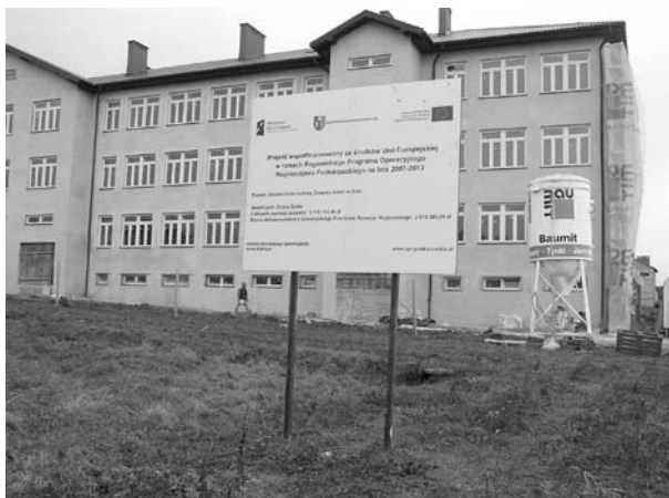
Nowobudowany Zespół Szkół w Dukli

Trwają prace wykończeniowe przy nowobudowanym Zespole Szkół w Dukli (gimnazjum i liceum). Zadanie to jest współfinansowane z Regionalnego Programu Operacyjnego Rozwoju Województwa Podkarpackiego 2007 - 2013. Wysokość dofinansowania wynosi 2 600 tys. zł. Termin zakończenia inwestycji to 31 sierpnia 2010.