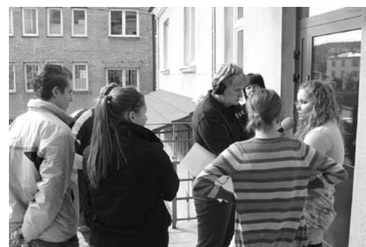
Dukielska młodzież udziela wywiadu.