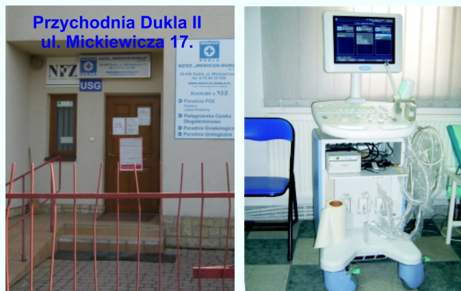
Przychodnia Dukla II ul. Mickiewicza 17.