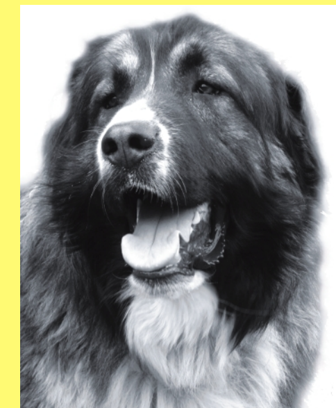
Szamir - owczarek kaukaski. Pies Witka Różewicza

Od kwietniowego numeru rozpoczynamy publikację zdjęć ulubionych czworonogów Czytelników DUKLI.pl