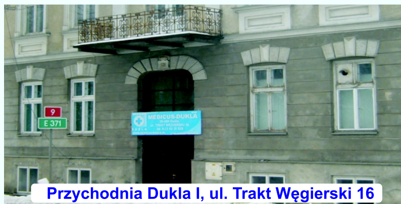
Przychodnia Dukla I, ul. Trakt Węgierski 16