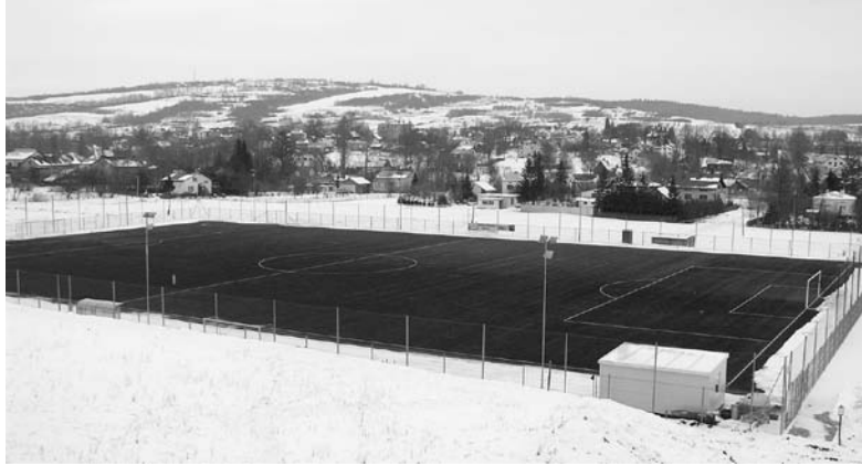
Pełnowymiarowe boisko ze sztuczną nawierzchnią w Dukli.

Został także ogłoszony przetarg na wykonanie kanalizacji w miejscowości Jasionka, na którą to inwestycję mamy już 75% do-