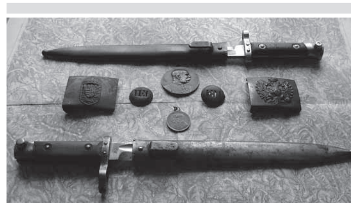
Elementy wyposażenia armii austro-węgierskiej z epoki manewrów na pograniczu karpackim w 1911 roku na tle mapy sztabowej arkusza DUKLA-PASZ

Przystępując do konkursu akceptuję regulamin i jednocześnie wyrażam zgodę na przetwarzanie danych osobowych przez OŚRODEK KULTURY z siedzibą w DUKLI, UL. KOŚCIUSZKI 4 w celu promocji w galerii foto wideo na stronie internetowej www.ok.dukla.pl . Wiem, że podanie danych jest dobrowolne oraz, że mam prawo kontroli przetwarzania danych, prawo dostępu do treści swoich danych.