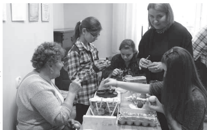
Wspólne malowanie jaj

7 kwietnia w sali artystycznej Ośrodka Kultury odbyło się spotkanie pt.: „Wspólne Malowanie Jaj”. Do pracy zasiadli doświadczeni zdobnicy lokalni i osoby początkujące. W miłej atmosferze, wśród rozmów i wymiany doświadczeń szybko minął wieczór, którego efektem końcowym były przepiękne, kolorowe pisanki. Każda przybyła osoba wyszła z jajkami gotowymi do włożenia w koszyczek wielkanocny. Cieszymy się że tradycja pisania jajek nie została zapomniana, a symbol jajka jako triumf życia nad śmiercią umacnia nasze więzi rodzinne podczas śniadania wielkanocnego. Do wspólnego pisania jajek usiedli uczniowie ZS w Dukli, panie z Koła Gospodyń Wiejskich z Mszany i Łęki Dukielskich oraz mieszkańcy Dukli.