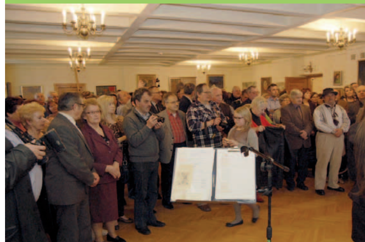
Tuż przed otwarciem wystawy