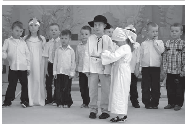
Żywot św. Jana z Dukli w wykonaniu przedszkolaków