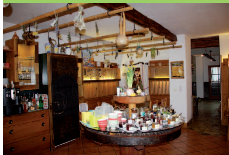
Jadalnia w gospodarstwie Kürbishof Gartner