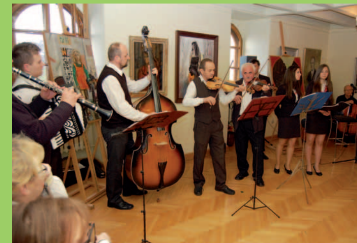
„A może Tak” z Krosna uświetnił wernisaż oprawą muzyczną