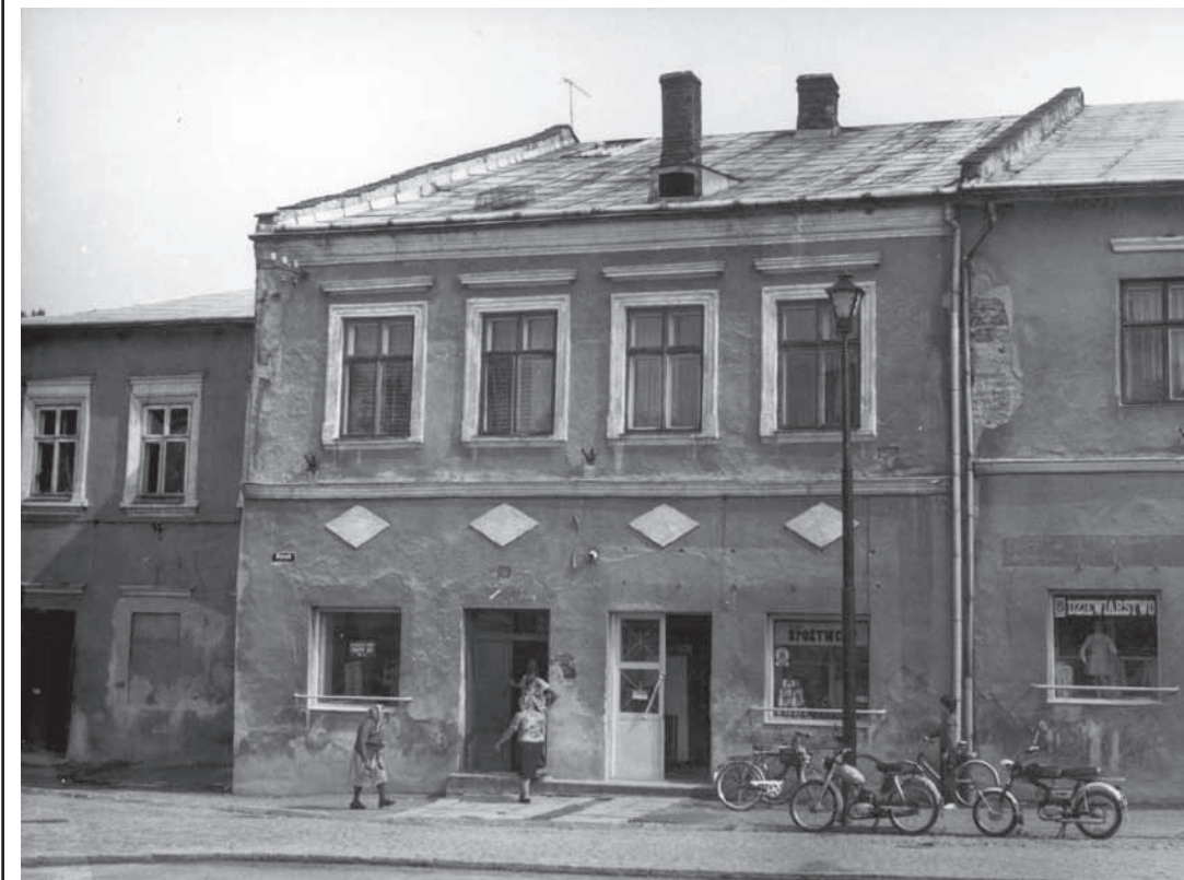
Fragment rynku z lat 70-tych.