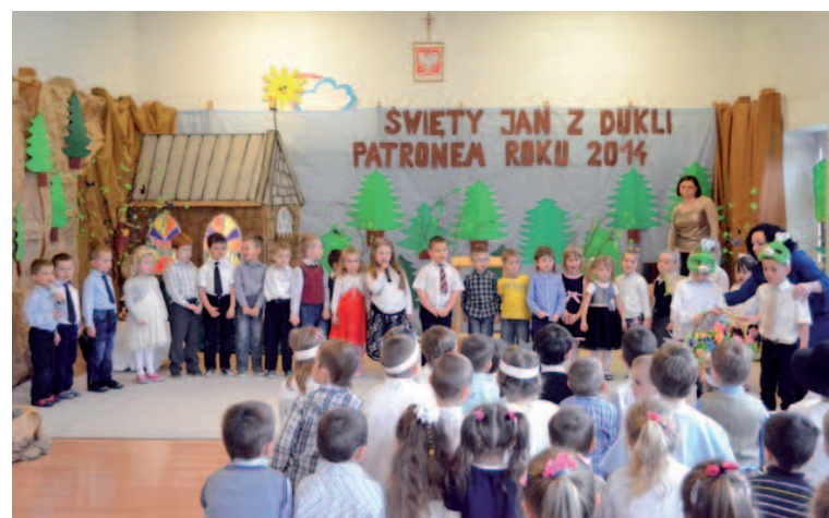
Przedшкоlacy uczestniczący w inscenizacji