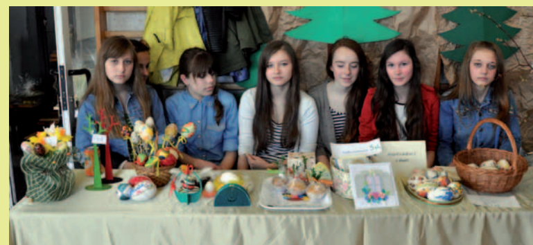
ZS nr 2 z Dukli