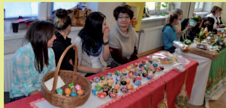
Stoisko z Mszany i szkoły z Iwli