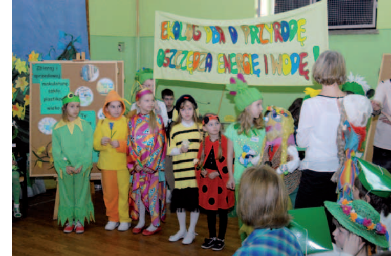
Uczestnicy konkursu z organizatorami