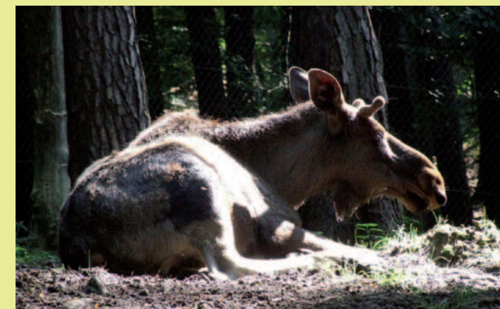
Coraz łatwiej spotkać łosia na Podkarpaciu