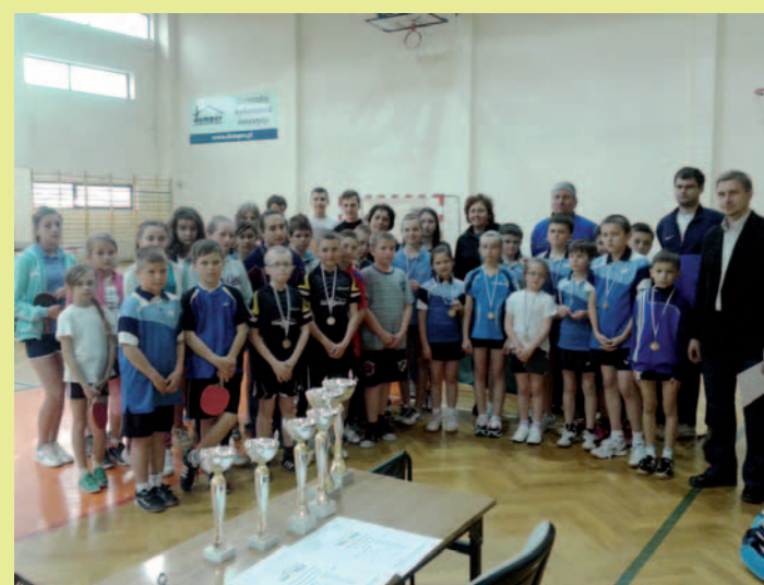
Zwycięzcy, uczestnicy i organizatorzy Szkolnej Ligi Tenisa Stołowego