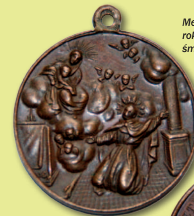
Medal wybitny we Lwowie w 1884 roku z okazji 400 setnej rocznicy śmierci bł. Jana z Dukli.