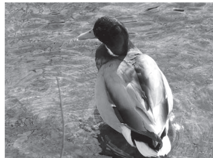
Fot. Kaczka krzyżówka (kaczor)

„Jeżeli w porannej gazecie nie ma naszego nekrologu, trzeba umyć zęby i znowu pójść do pracy.”