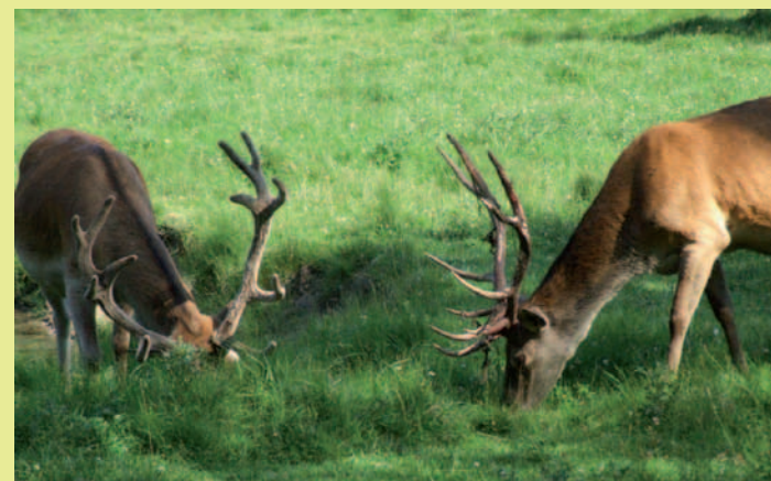
Lasy regionu to ważna ostoja jeleniowatych