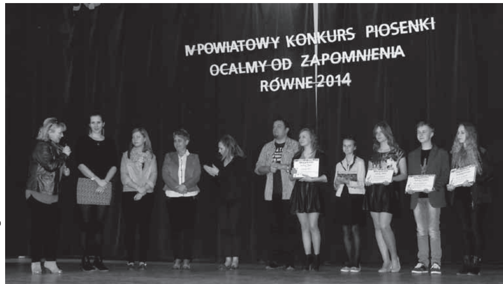
Laureaci z organizatorami

Od kilku tygodni zwycięski projekt realizowany jest na terenie Szkoły Podstawowej i Gimnazjum w Głojskach. Dzieci i młodzież nie kryją ra-