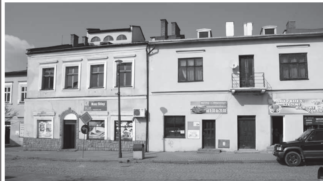
Fragment rynku - 2014 r.