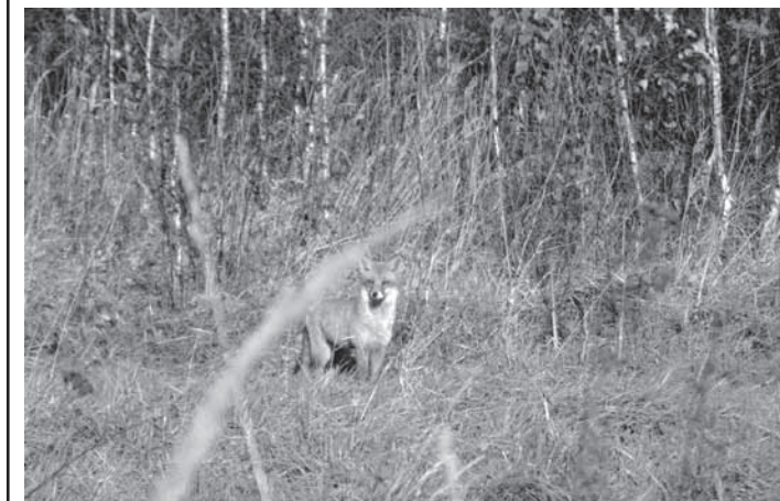
Po raz pierwszy od lat istotnie spadła liczebność lisów

Leśnicy z terenu Regionalnej Dyrekcji Lasów Państwowych w Krośnie podsumowali prace związane z doroczną inwentaryzacją dzikich zwierząt. Z analiz wynika, że mimo pewnych wahań liczebności poszczególnych gatunków, podkarpacki las jest środowiskiem życia stabilnych populacji, zarówno zwierząt łownych, jak i tych prawem chronionych. Bytuje tu m.in. 10,2 tys. jeleni, 36,7 tys. saren, 9,4 tys. dzików oraz 270 łosi. Tych ostatnich tylko w ciągu jednego roku przybyło 70 osobników.