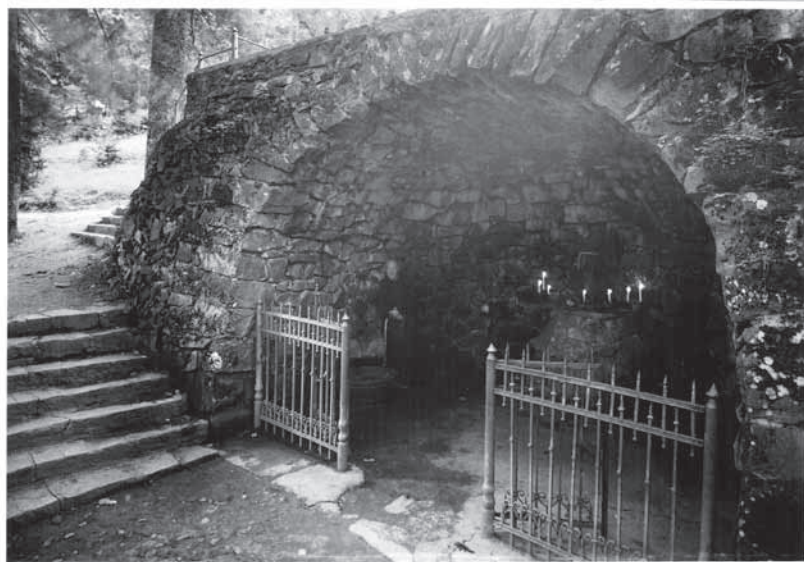
99. Okolice Janowca-Zdroju. Cudowne źródło na pustelni bł. Jana z Dukli.