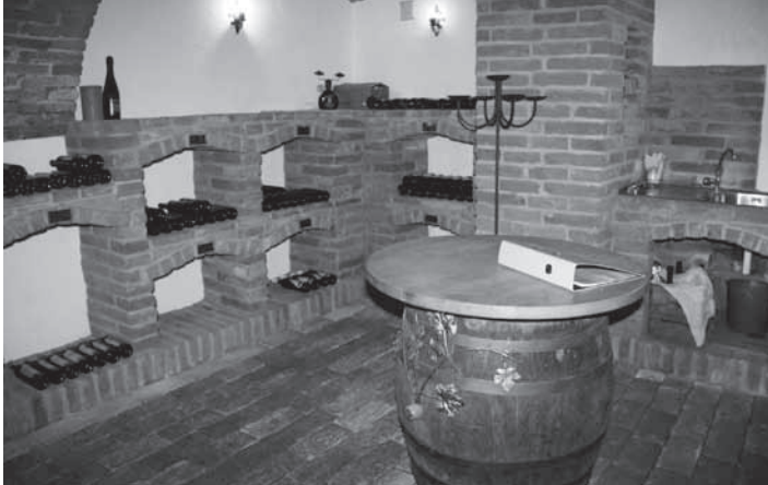
Grupa uczestnicząca w wyjeździe mieszkała w gospodarstwie

Styria to drugi co do wielkości kraj związkowy Austrii, zajmujący południowo-wschodnią część państwa. Krajobraz Styrii to głównie lasy, łąki i winnice. Na terenie Styrii w zagłębiu Eisenerz wydobywa się żelazo, a czerwono-brązowa Kruszcowa Góra to jedna z największych atrakcji turystycznych regionu. Region słynie z łagodnego klimatu i spokojnej, sielskiej atmosfery. Od zachodu Styria graniczy z Salzburgiem, a między obiema krainami przebiega pasmo Alp Salzburskich i Niskich Taurów. W tej części Styrii znajdują się najlepsze trasy dla biegaczy narciarskich. Na północy Styrii rozciąga się kraina jezior Salzkammergut. Stolicą Styrii jest Graz , drugie po Wiedniu największe miasto w Austrii i zarazem duża atrakcja turystyczna. Na terenie Styrii leży największy austriacki skansen w Stübing , stadnina koni w Piber oraz najważniejsze sanktuarium maryjne w Austrii – bazylika w Mariazell . 30 lat temu była regionem typowo rolniczym. Styria słynie z produkcji oleju z pestek dyni, który stosowany jest do wypieków (np. chleba), przyrządzania zup, ciast itp. Dla wytworzenia 1 litra oleju zużywane jest ok. 2,2 litra pestek z dyni. Poza olejem produkowane jest tutaj wino (winnice położone najwyższej w Europie – 600 m n.p.m.) ze szczepów winogron (Blauer Wildbacher) uprawianych tylko i wyłącznie w tym rejonie. Land Styrii zawdzięcza swą malowniczość licznym jeziorom (Salzkammergut), lodowcowi Dachstein (prawie 3000 metrów n.p.m.), a na południu winnicom.