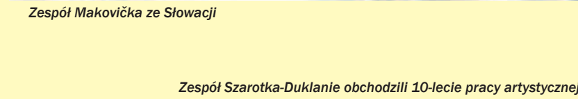
Zespół Szarotka-Duklanie obchodzili 10-lecie pracy artystycznej