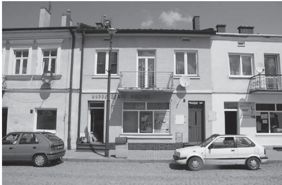
Fragment rynku - 2014 r.