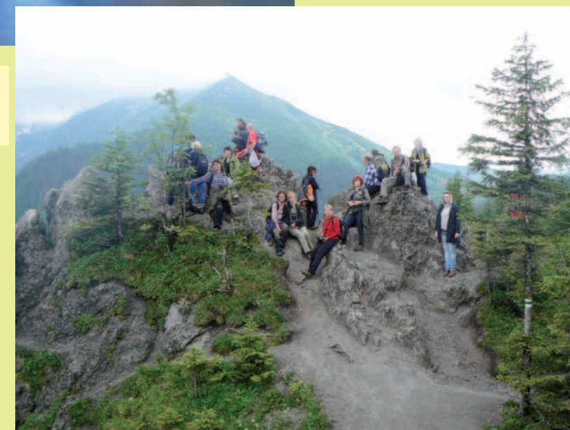
Na tatrzańskim szlaku