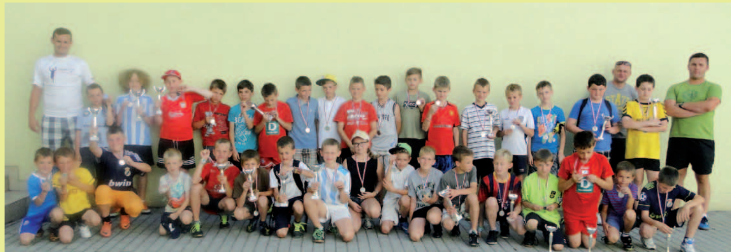
Uczestnicy obozu letniego