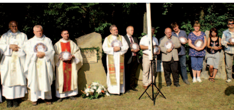
Pamiątkowe zdjęcie wyróżnionych pamiątkowym talerzem ceramicznym