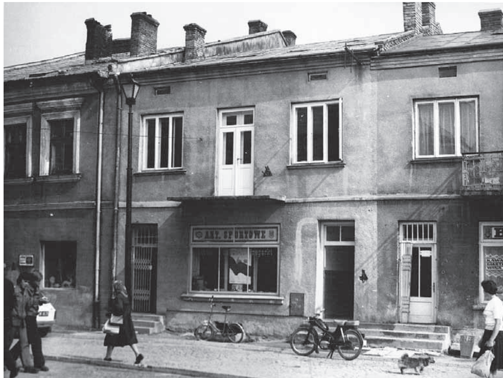
Fragment rynku z lat 70-tych.