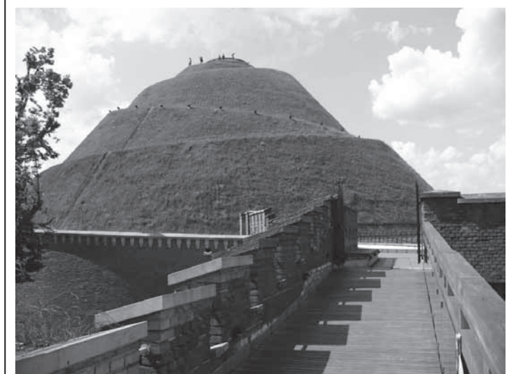
Kopiec Kościuszki.

Nie wiem co dziś widać z Cergowej, u mnie na Chopina z czwartego piętra dobrze widać kopiec Kościuszki.