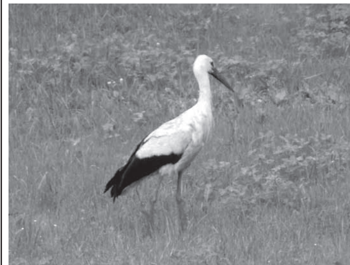
Środek lata – Bocian z Dukli z rodowodem