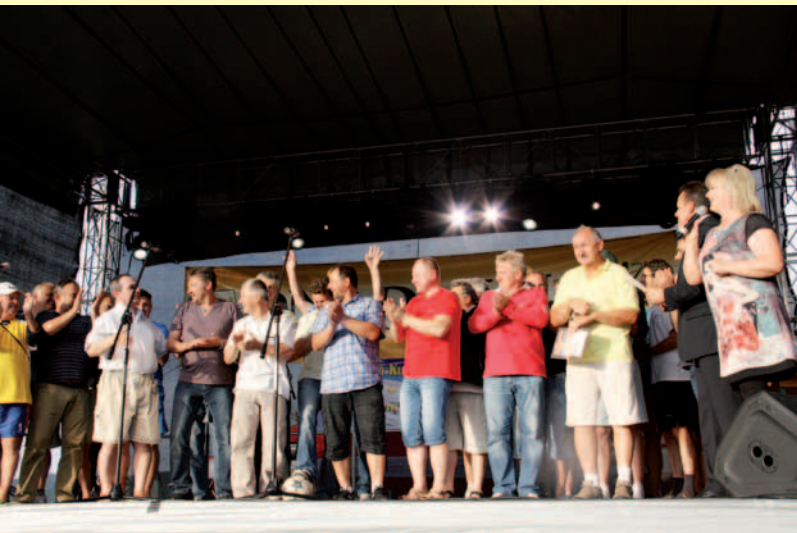
Uczestnicy Turnieju Piłki Nożnej Old Boye z Dukli i Opaly