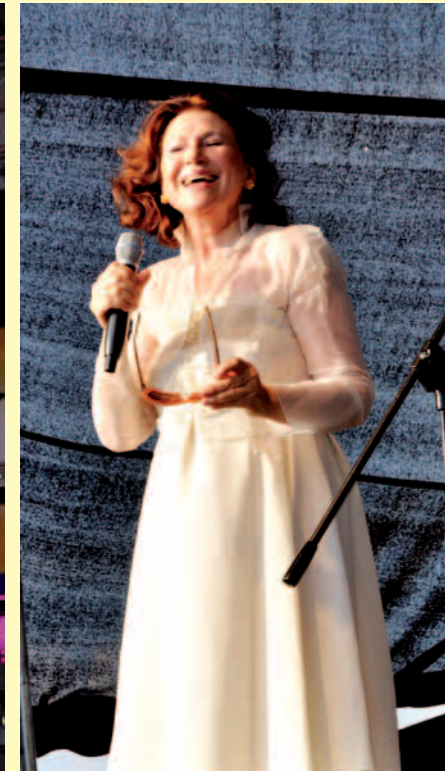
Halina Frąckowiak jak zawsze była Gwiazdą