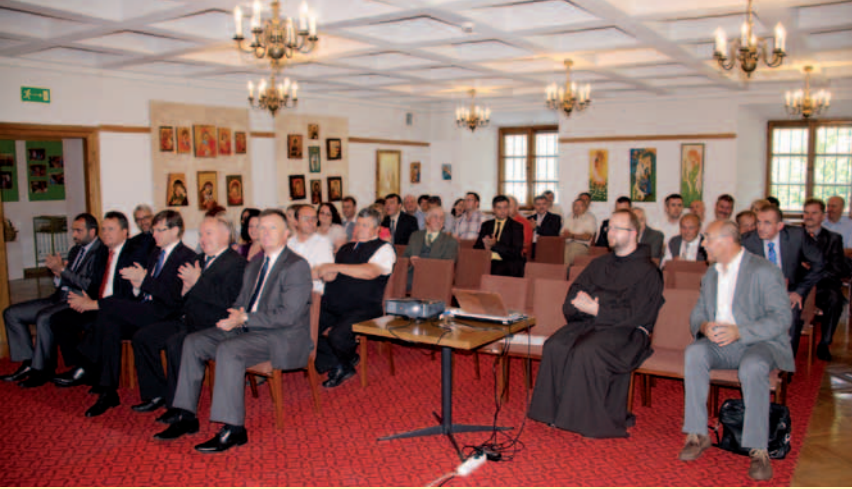
Na uroczystej sesji Rady Miejskiej w Dukli