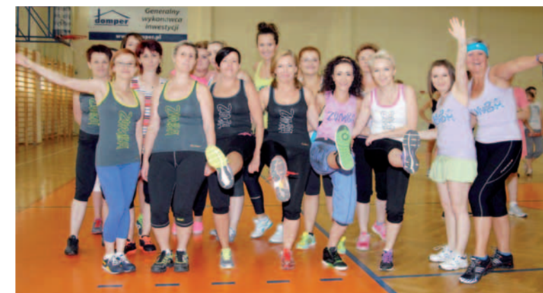
Zumbowiczki z dukielskiej sekcji