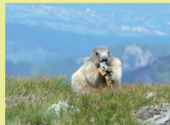
A świstak siedział i odwijał papierki