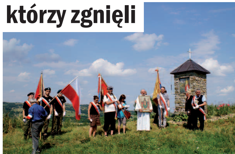
Modlitwa przy kapliczce