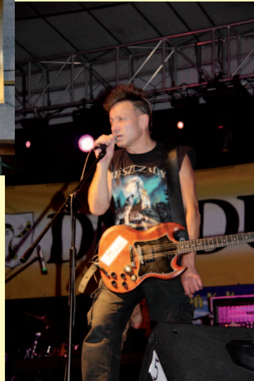
Lider grupy KSU