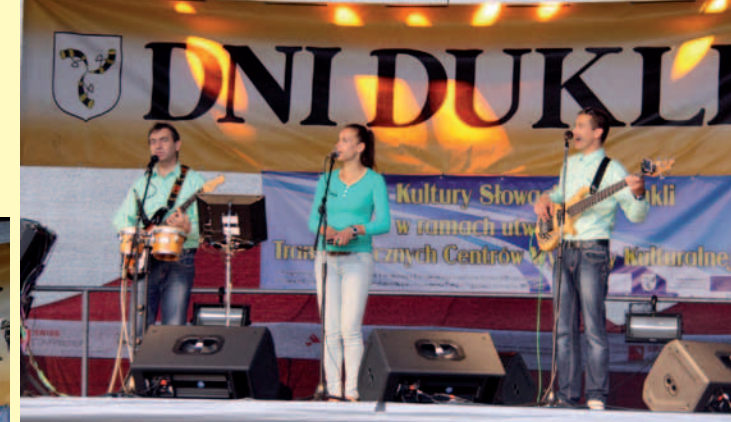
Zespół ze Słowacji