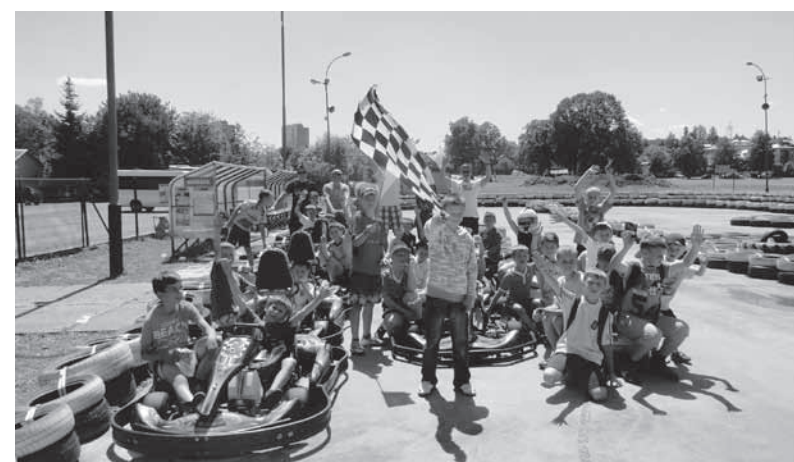
Na torze kartingowym

nieju „mini” World Cup, który to wygrała „reprezentacja” Belgii. W ostatni dzień na uczestników obozu czekała niespodzianka. W tym roku okazał się nią wyjazd na tor kartingowy do Krosna, gdzie wszyscy spróbowali swoich sił za kierownicą szybkich gokartów. Po powrocie z Krosna na zmęczonych piłkarzy czekał grill na zakończenie obozu, na którym to wszyscy otrzymali pamiątkowe medale, a osoby które kończą przygodę w naszej sekcji puchary. Reasumując rewelacyjna pogoda i solidna frekwencja (34 osoby) sprawiły, że spędzony razem czas na długo pozostanie w pamięci uczestników obozu.