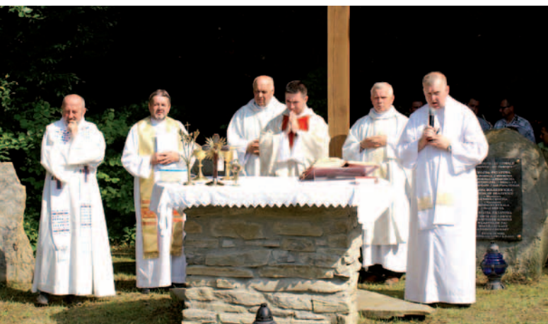
Msza św. koncelebrowana pod krzyżem na Łazach w Iwli