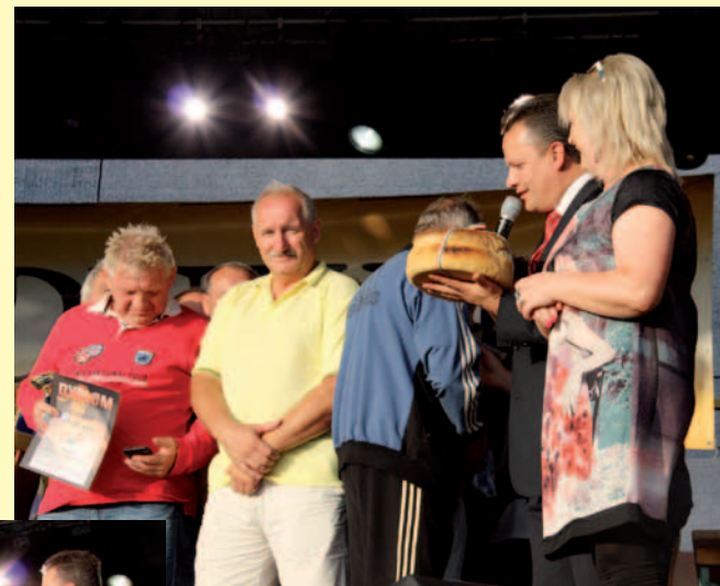
Burmistrz Dukli odbiera chleb - dar gminy Opaly