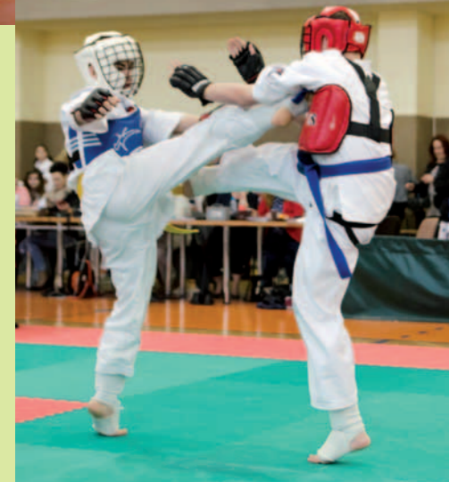
Uczestnicy Turnieju w Dukli