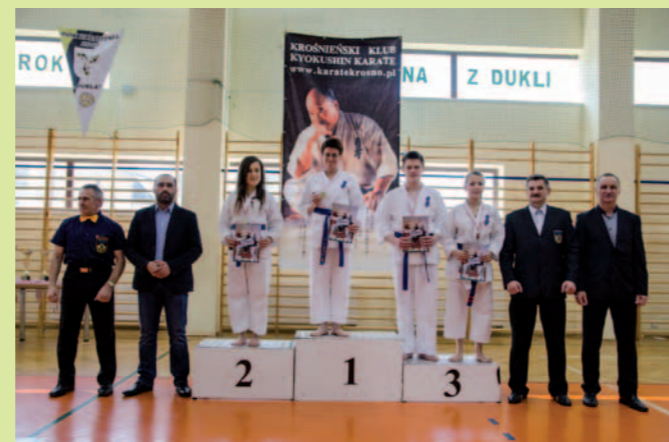
Zwycięcy z organizatorami