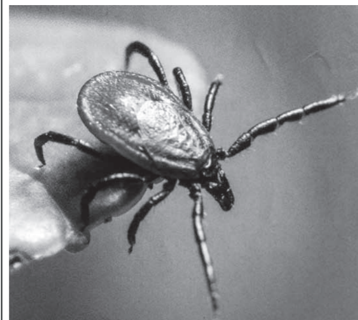
Kleszcz pospolity

W wielu kołach okres ten nazwany jest obowiązująca ciszą. Miesiąc maj zwłaszcza w tym roku jest czasem ciekawych wydarzeń w kraju, a to wybory prezydenckie, to również okres ważnych zebrań (zgrupowań) w kołach łowieckich. Tegoroczne zebrań wyłonią nowe zarządy kół na kolejną pięcioletnią kadencję. Zbliża się nowelizacja ustawy