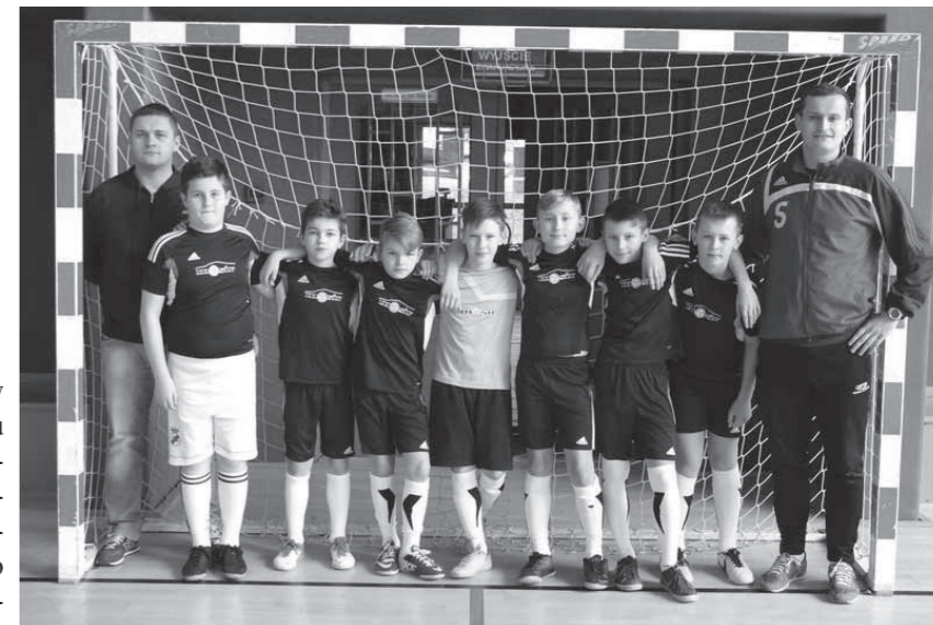
Zawodnicy MOSiR Dukla rocznik 2003

29 marca chłopcy z rocznika 2003 wzięli udział w ostatnim turnieju halowym w tym sezonie. W turnieju wzięło udział sześć zespołów: Nafta Jedlicze, UKS Wojak Wojaszówka, Bardomed Krosno, Beniaminek Krosno, Konieczynka Krosno, MOSiR Dukla. Turniej rozgrywany był systemem każdy z każdym, było bardzo dużo gry bo mecze trwały 19 minut. Ostatni halowy turniej wy-