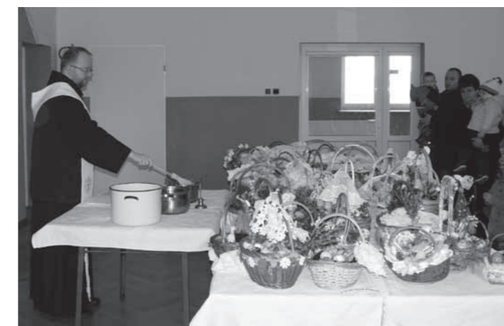
Błogosławieństwo pokarmów w Zboiskach