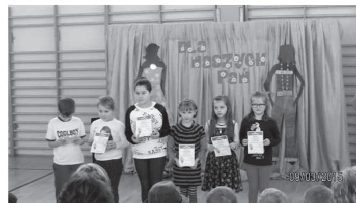
Zwycięzcy ogólnopolskiego konkursu „Alfik Humanistyczny” 2014/2015

obóz wycieczkowy – naukowy do Serpelic, gdzie w sposób aktywny i twórczy spędzili niezapomniany tydzień lub dwa tygodnie.