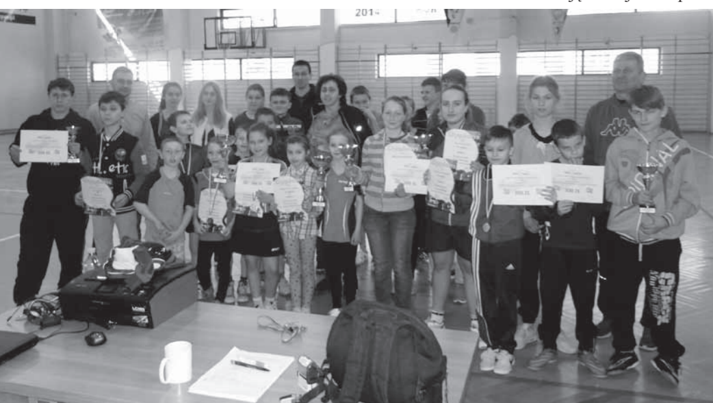
Uczestnicy turnieju z organizatorami