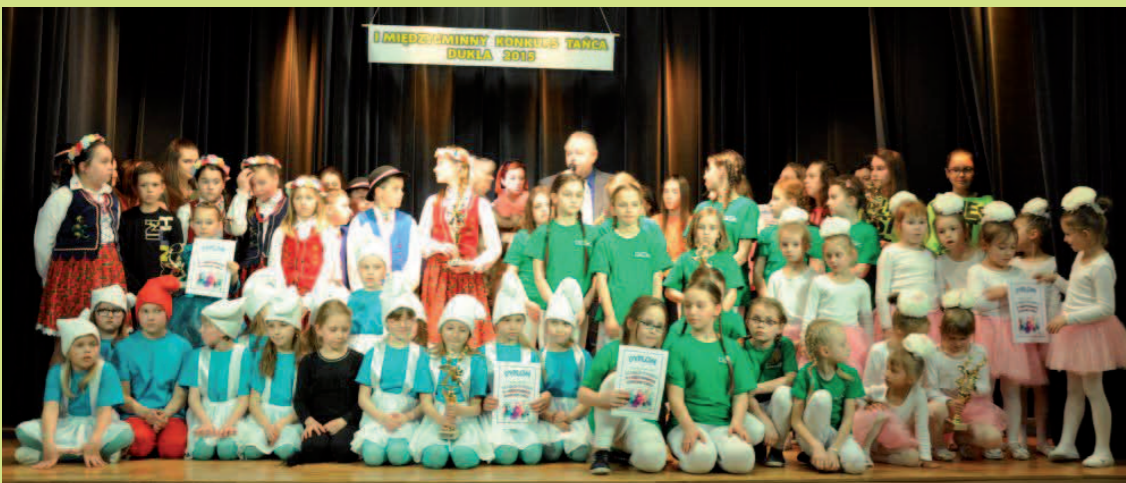
Finaliści Międzygminnego Konkursu Tanecznego