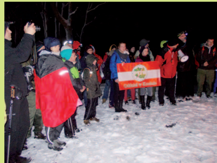
Płomień Pamięci zapłonął po raz dziesiąty