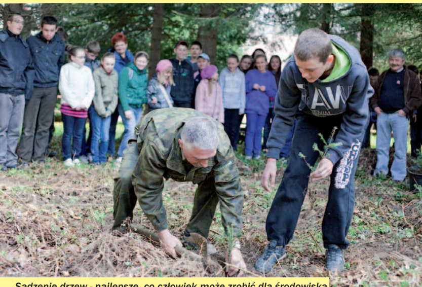
Sadzenie drzew - najlepsze, co człowiek może zrobić dla środowiska