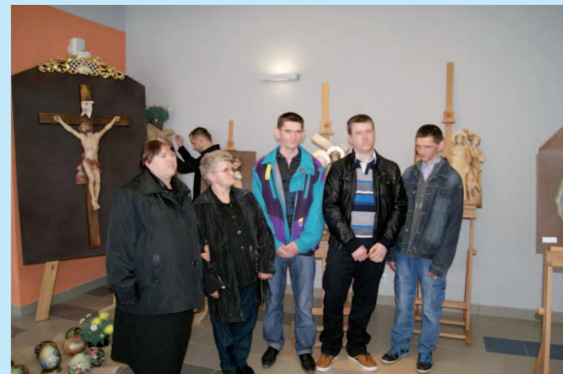
Nagrodzeni uczestnicy ŚDS w Cergowej podczas rozdania nagród w Transgranicznym Centrum Kultury