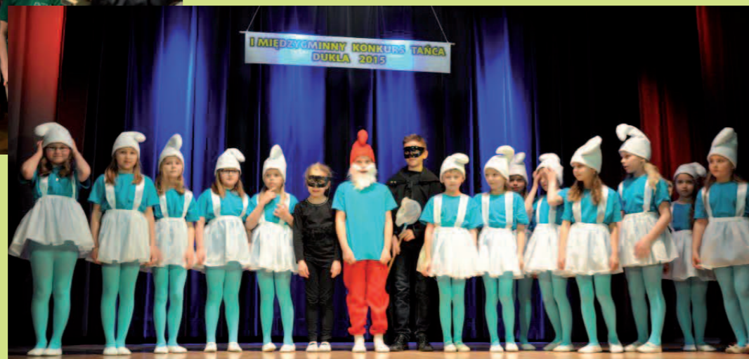
Baletki z Łek Dukielskich (2 m.)