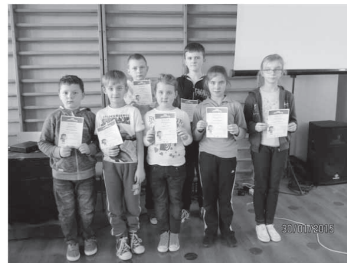
Zwycięzcy ogólnopolskiego konkursu „Alfik Matematyczny” 2014/2015

Szkoła w Łękach Dukielskich otrzymała już dwa certyfikaty Szkoły Łowców Talentów w roku szkolnym 2012/13 i 2014/15 , a siedmioro uczniów zostało laureatami i zdobyło główną nagrodę, wyjazd na