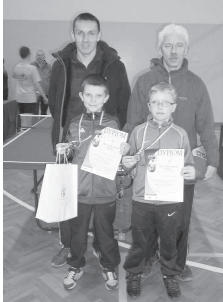
Trenerzy z wychowankami