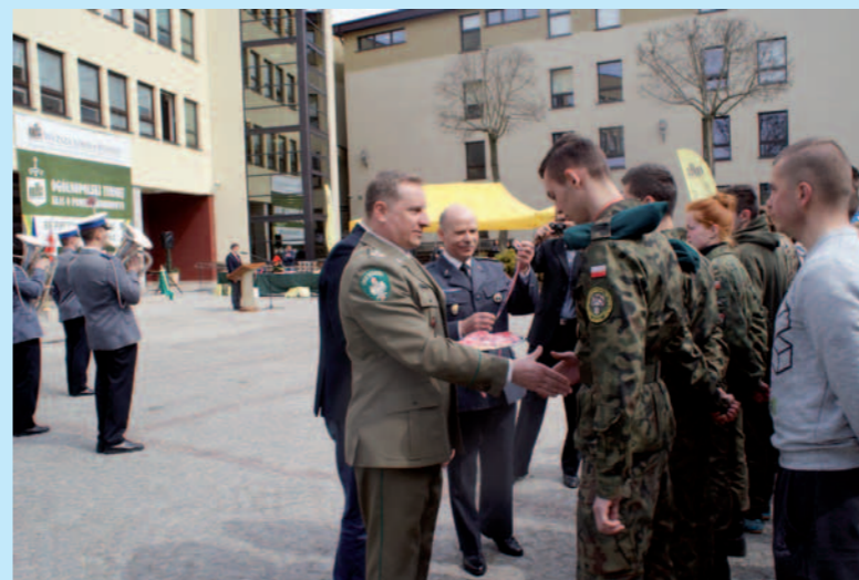
Uczniowie Dukielskiego LO na IV Ogólnopolskim Turnieju Klas o Profilu Mundurowym w Dąbrowie Górniczej.