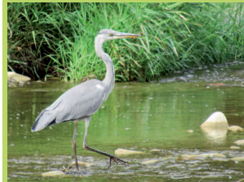
Czapla siwa na Jasiołce