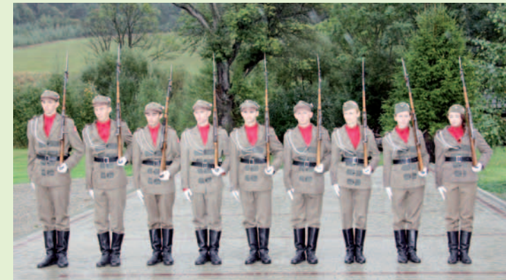
Pokaz musztry w wykonaniu zrekonstruowanej grupy Towarzystwa Gimnastycznego „Sokół” z rymanowskiego liceum