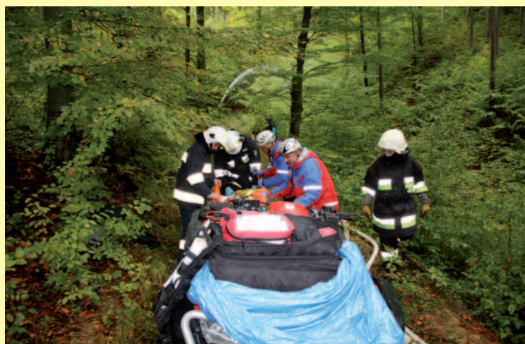
Przygotowanie rannego do transportu