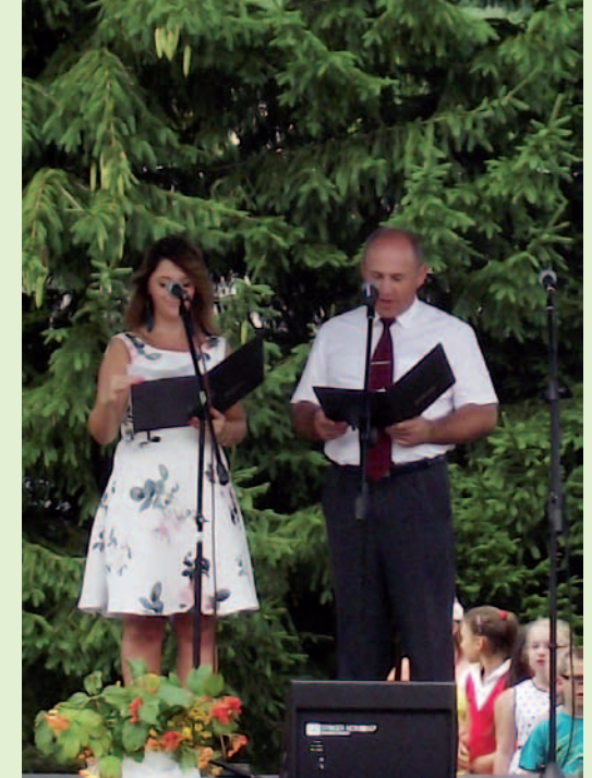
Otwarcie dożynek w Tylawie