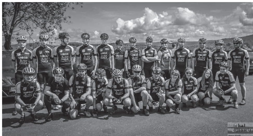
Sekcja rowerowa.

Sezon maratonów rowerowych Cyklokarpaty w 2015 roku przeszły do historii i przyszedł czas podsumowania samego cyklu jak i też startów naszych zawodników. W tym roku seria składała się z jedenastu imprez rozlokowanych na terenach województwa podkarpackiego i małopolskiego. Po zwiększającej się liczbie startujących pasjonatów dwóch kółek widać że rower na dobre zadowolił się w krajobrazie naszej pięknej Polski. Zdecydowanie podniósł się poziom sportowy startujących, co mobilizuje organizatorów do przygotowywania tras coraz bardziej wymagających, a jednocześnie oddających walory krajobrazowe i przyrodnicze. Trafny dobór miejsc zawodów i przyjazny klimat kolarskiej rodziny sprawił, że Cyklokarpaty stały się ważną imprezą dla wielu osób. Nas, jako sekcje MTB MOSiR Dukla cieszy fakt, że impreza organizowana w Dukli została oceniona bardzo wysoko pod względem profilu i doboru tras oraz organizacyjnym. Sprawia to, że do naszej gminy przyjeżdża coraz więcej rowerzystów, ale nie tylko ich, którzy szukają dobrze przygotowanych ścieżek i dostępnej bazy turystycznej. Dlatego tworzenie nowych miejsc do aktywnego wypoczynku, poprawa infrastruktury drogowej przekłada się to również na rozwój naszej gminy oraz okolicznych miejscowości. Starty rozpoczęliśmy w pięknym Przemyśle w katastrofalnych warunkach pogodowych. To co tam się działo najlepiej obrazują zdjęcia. Drużynowo zajęliśmy piąte miejsce z kilkoma indywidualnymi zwycięstwami w kategoriach