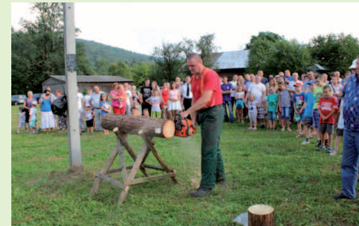
Konkurs drwali zgromadził dużą publiczność.