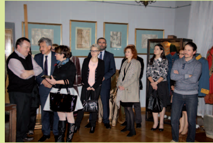
Otwarcie wystawy - zaproszeni goście