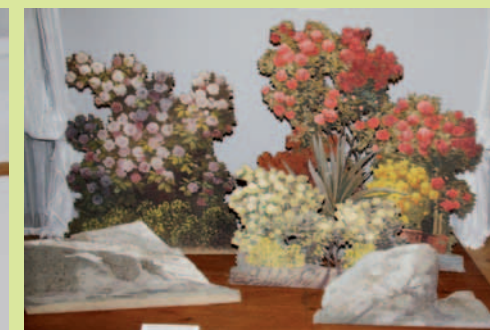
Fragm. wystawy (oryginalne dekoracje teatralne ze zbiorów Muzeum Zamek w Łańcutcie)