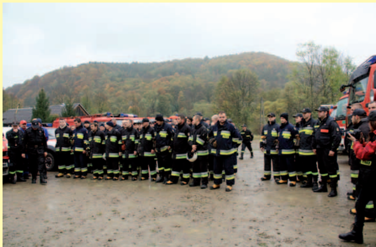
Przeгляд jednostek OSP biorących udział w manewrach