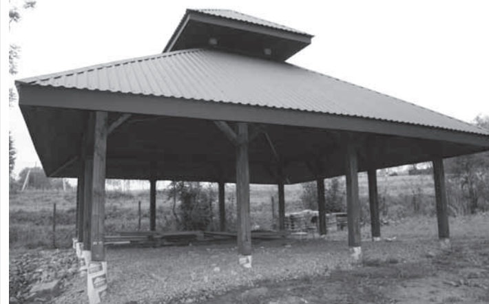
Wiata w Łękach Dukielskich