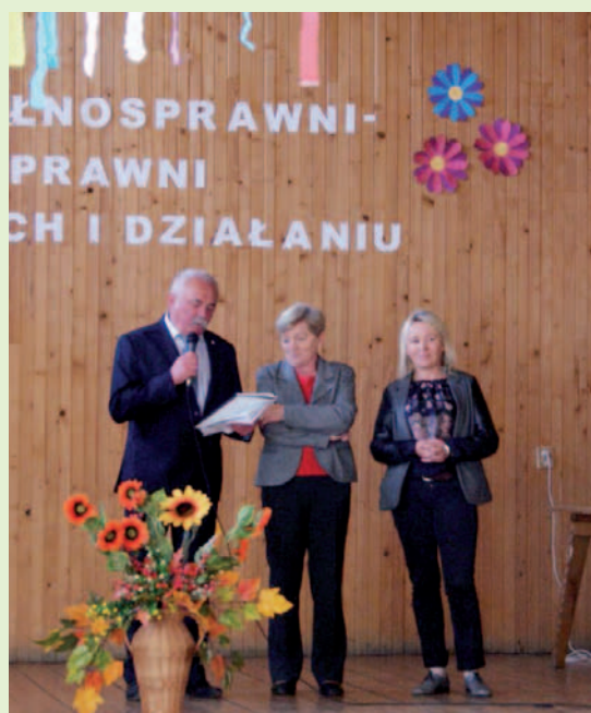
Otwarcie warsztatów w Domu Ludowym w Cergowej