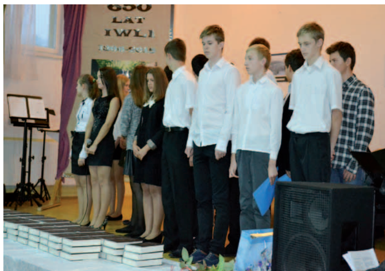
Uczniowie iwlielskich szkół wystąpili z inscenizacją słowno muzyczną dotyczącą operacji karpacko-dukielej