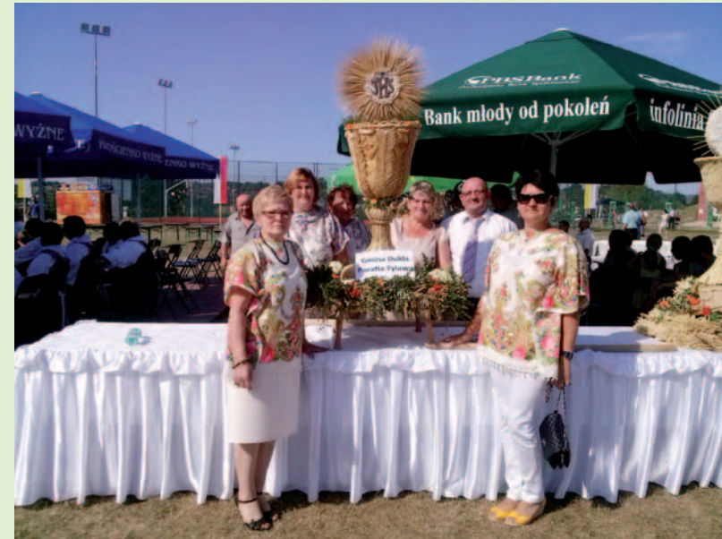
Wieniec dożynkowy z Tylawy reprezentował gminę Dukla na dożynkach Powiatowych w Krościenku Wyżnym.