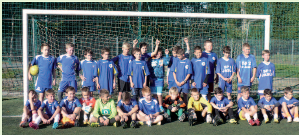
Młodzieżowa drużyna piłkarska z Łek Dukielskich