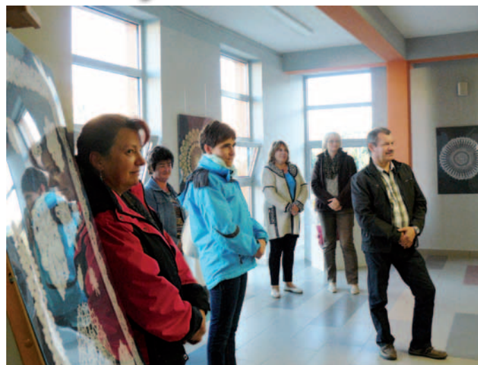
Wernisaż wystawy koronek w Transgranicznym Centrum Kultury w Dukli