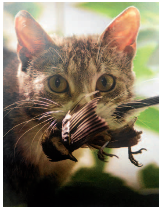
Kot ma silnie rozwinięty instynkt łowiecki