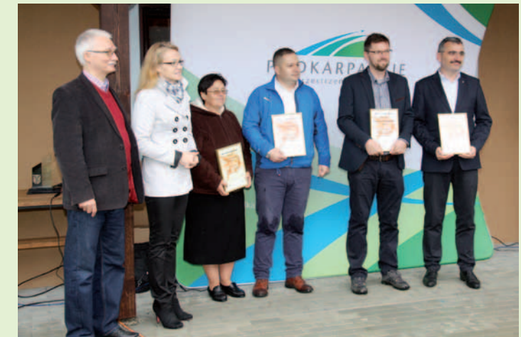
Zwycięzcy regionalnego etapu konkursu na „Najlepszy Produkt Turystyczny”