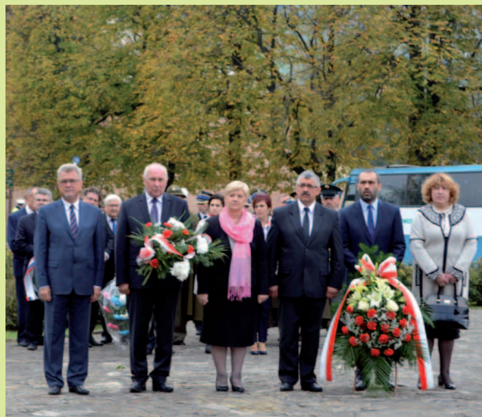
Składanie wieńców pod Krzyżem Pojednania w Dukli.