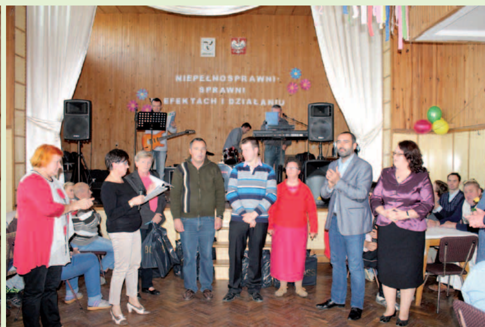
Wręczenie nagród laureatom konkursu „Ja, Moja Rodzina, Moje Miasto”.