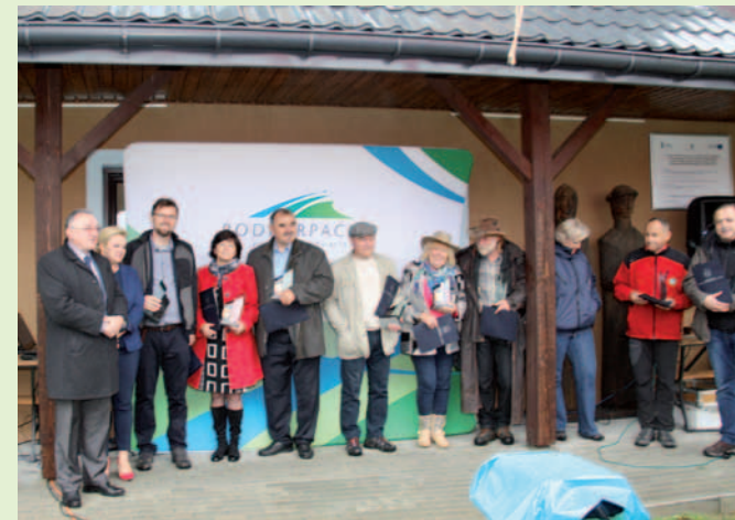
Odnaczeni statuetką Marszałka Województwa Podkarpackiego „Za szczególną aktywność w rozwoju turystyki i jej promocji” z organizatorami