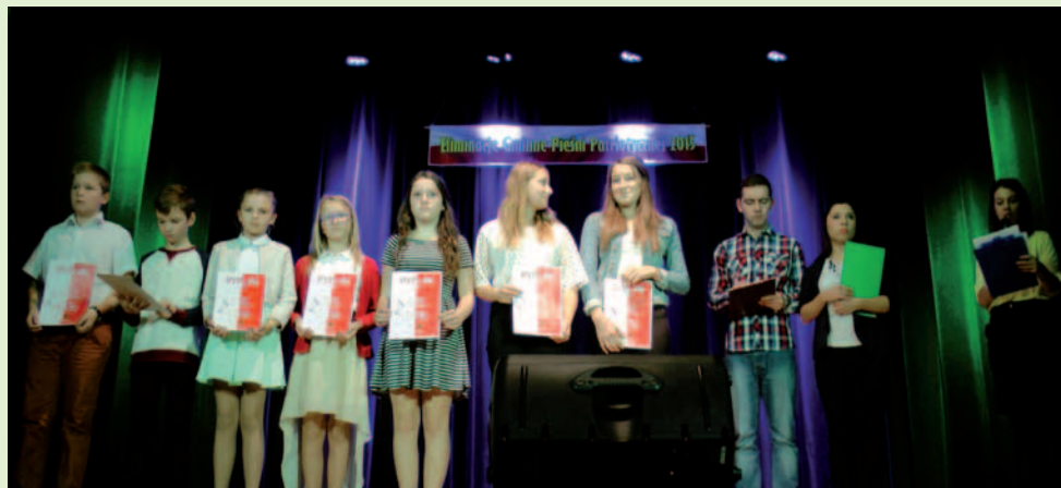
Zwycięzcy eliminacji gminnych Pieśni Patriotycznej.