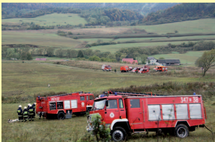
Wozy strażackie w akcji