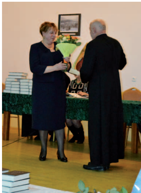
Autor dziękuje p. Halinie Cysak za pomoc w redagowaniu książki