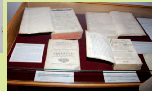
Wśród eksponatów: Zbiory komedii granych na Theatrum w Dukli w Pałacu