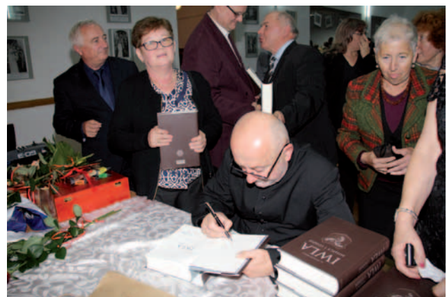
Nabywcy książki mogli dostać dedykację od Autora