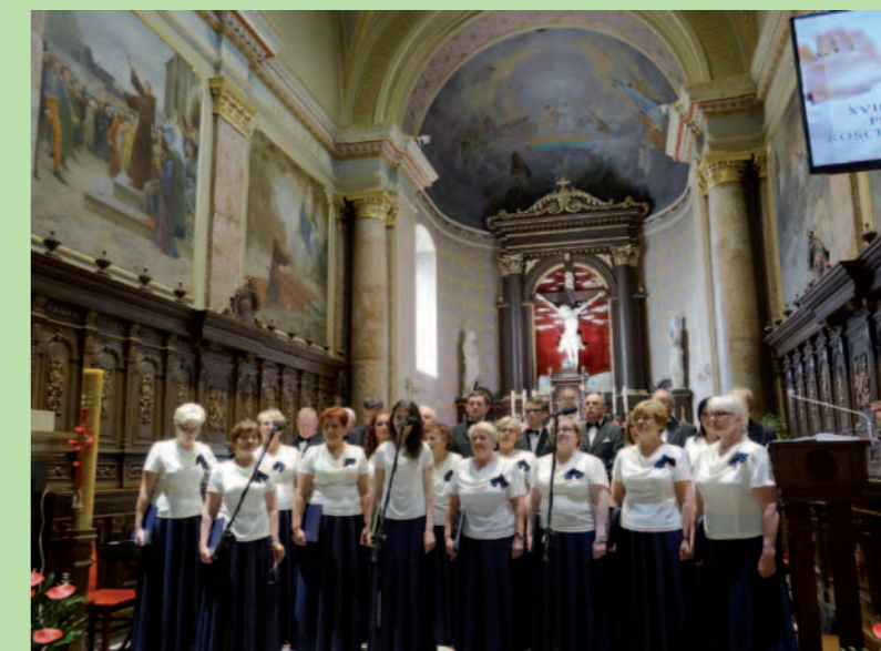
Chór „Echo” z Krosna