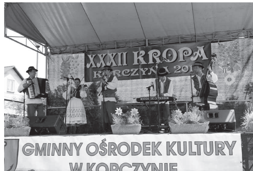
Kapela Duklanie podczas występu w Korczynie