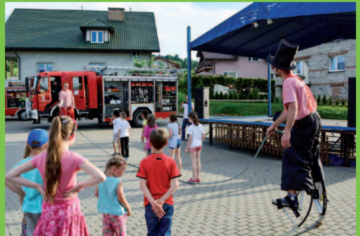
Dzieci bardzo chętnie brały udział w różnorodnych konkurencjach organizowanych przez animatorów