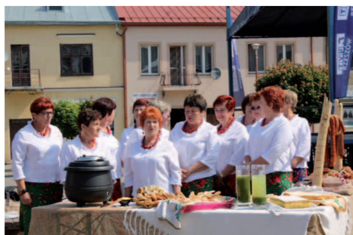
Panie z KGW, z Głojsc zaprezentowały serwatczankę i inne potrawy regionalne