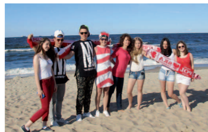
Uczestnicy konferencji nad morzem Bałtyckim