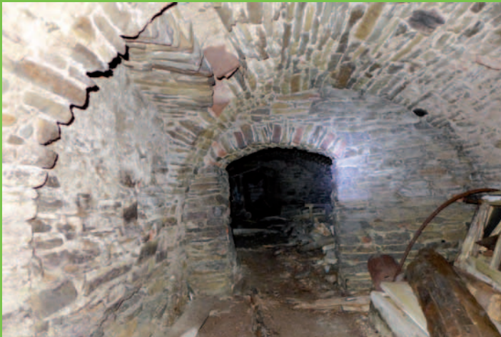
Fragment piwnic pod dukielskim rynkiem