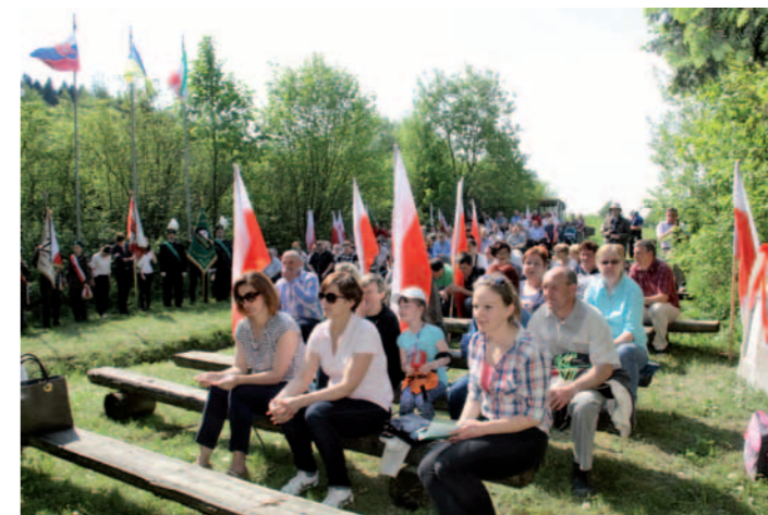
Uczestnicy mszy św.