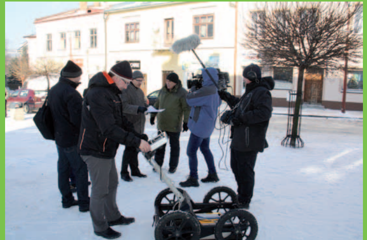
Badania wykonywane w styczniu georadarem wykorzystane do opracowania dokumentacji technicznej