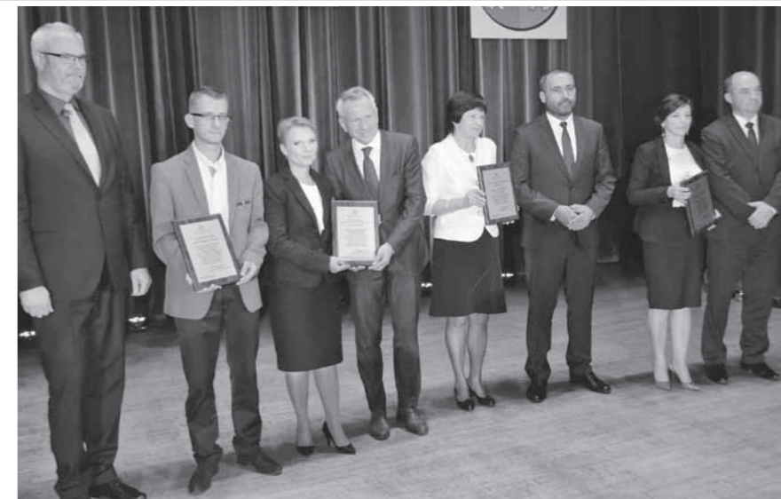
Nagrody odebrali redaktorzy naczelni i burmistrzowie