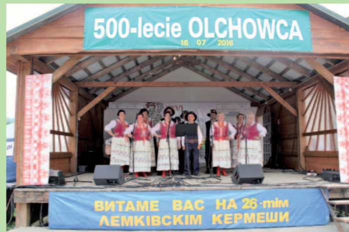
Zespół Obrzędowo-Śpiewaczy „Równianie”