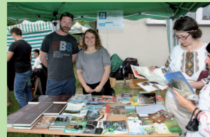
Stoisko IT w Dukli z materiałami promującymi Duklę