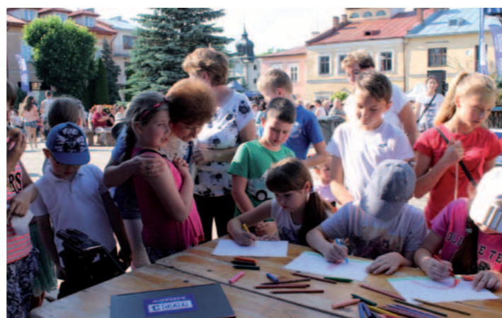
Do zabawy plastycznej organizowanej przez TVP3 Rzeszów zgłosiło się wiele dzieci