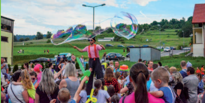
Gminny Dzień Dziecka cieszył się sporym zainteresowaniem wśród najmłodszych