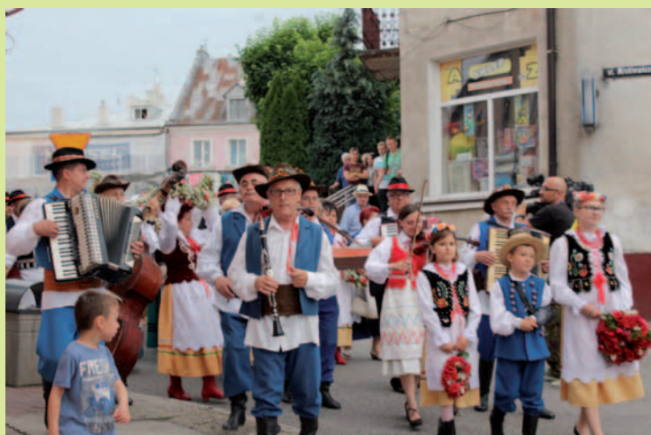
W drodze nad Dukielkę