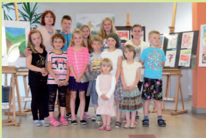
Dzieci z warsztatów podczas pleneru malarskiego