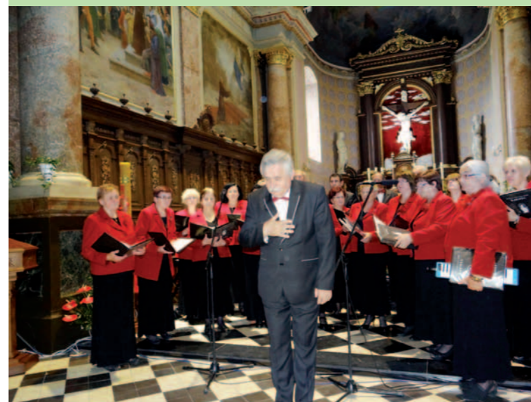
Chór „Karmal” ze Stropkowa