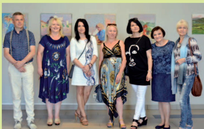
Uczestnicy pleneru malarskiego