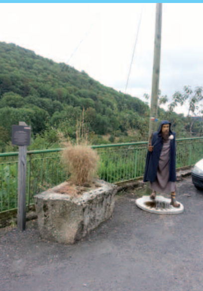
Na trasie Santiago de Compostela - strój dawnego pielgrzyma