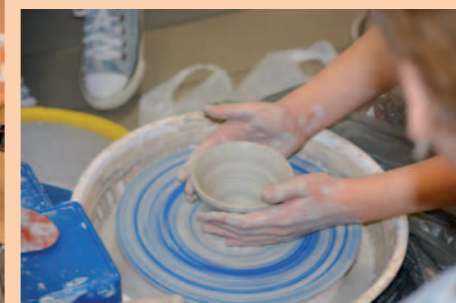
W pracowni ceramicznej