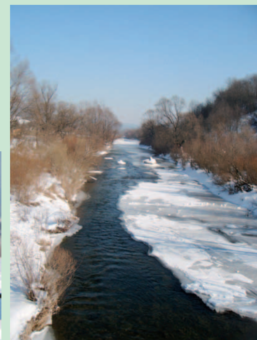
Nasza pocziwa Jasiołka puszcza lody