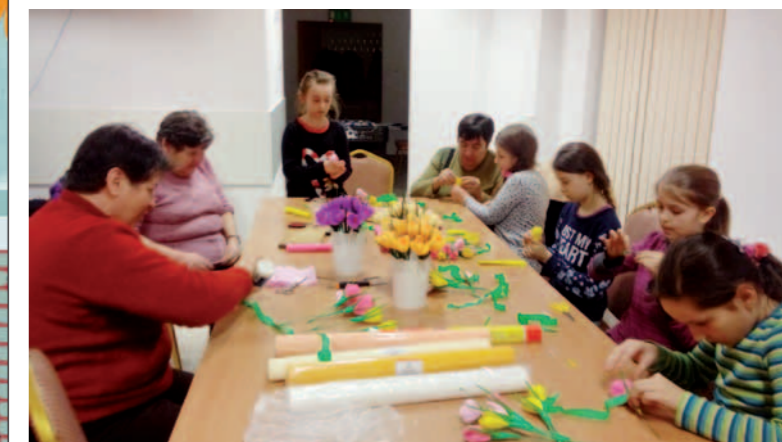
Przekazywanie tradycji wykonywania kwiatów z bibuły w Nowej Wsi