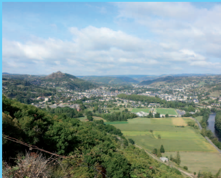
Widok na Estaing