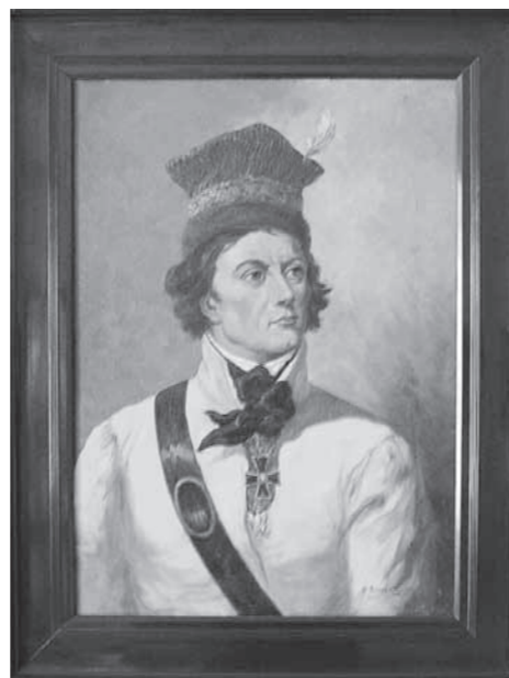
Tadeusz Kościuszko - portret Naczelnika

Trzon wystawy stanowią będą obiekty udostępnienie przez Fundację imienia Tadeusza Kościuszki w Krakowie, uzupełnione zabytkami ze zbiorów naszego Muzeum i zbiorów Zbigniewa Więcka oraz innych prywatnych kolekcji. Na wystawie będzie można zobaczyć różnego rodzaju pamiątki, elementy uzbrojenia, rekonstrukcje strojów kosynierów, zbiory ikonograficzne i numizmatyczne, przykłady biżuterii patriotycznej i innych upamiętnień. Szczególne jednak miejsce na ekspozycji zajmie kopia opublikowanego, po raz pierwszy w 1910 roku przez jezuitę Józefa Sasa, mało znanego listu napisanego w Dukli 19 października 1775 roku przez Tade-