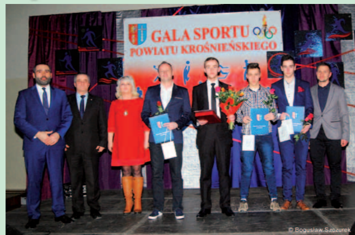
Nominowani sportowcy, działacze, trenerzy z gminy Dukla z przedstawicielami samorządu