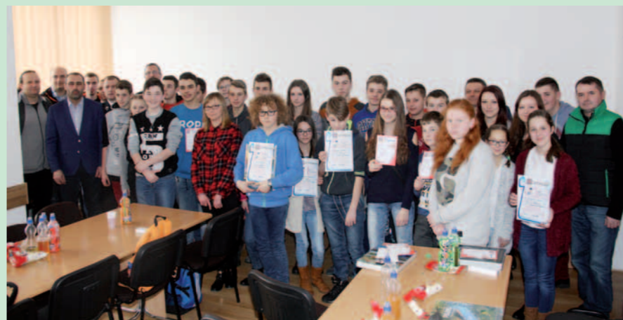
Uczestnicy eliminacji wraz z opiekunami i organizatorami