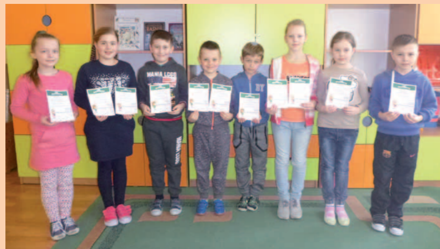
Uczestnicy projektu z dyplomami