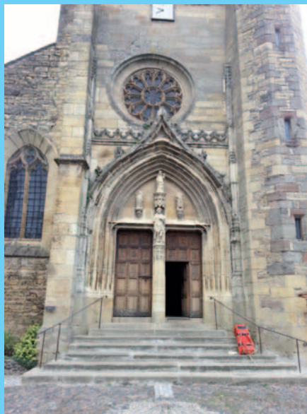
Klasztor w Le Malet