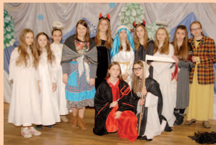
Jasełka zaprezentowali starsi uczniowie