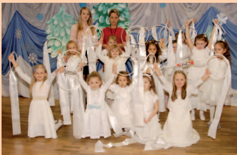
Uczennice klas I - III zaprezentowały swoje umiejętności wokalnno-taneczne