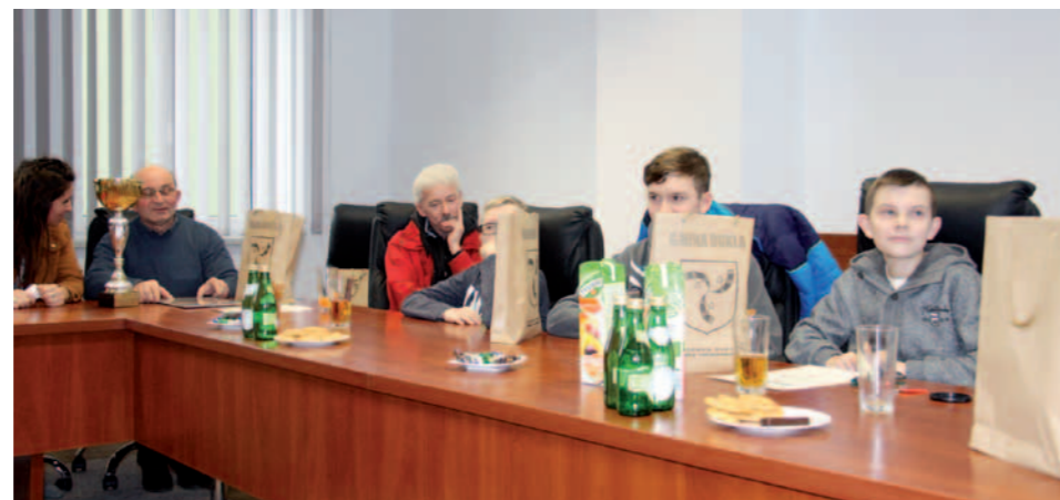
Podczas spotkania z burmistrzem