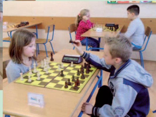
Zawodnicy podczas rozgrywek