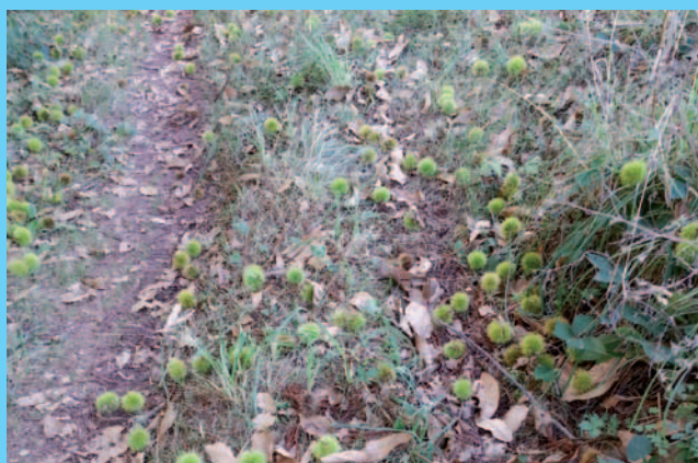
Kasztany jadalne na trawie