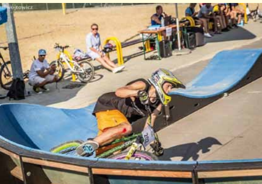
Zawodnik podczas rywalizacji