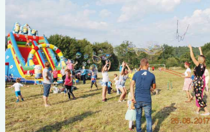
Bańki mydlane miały duże powodzenie