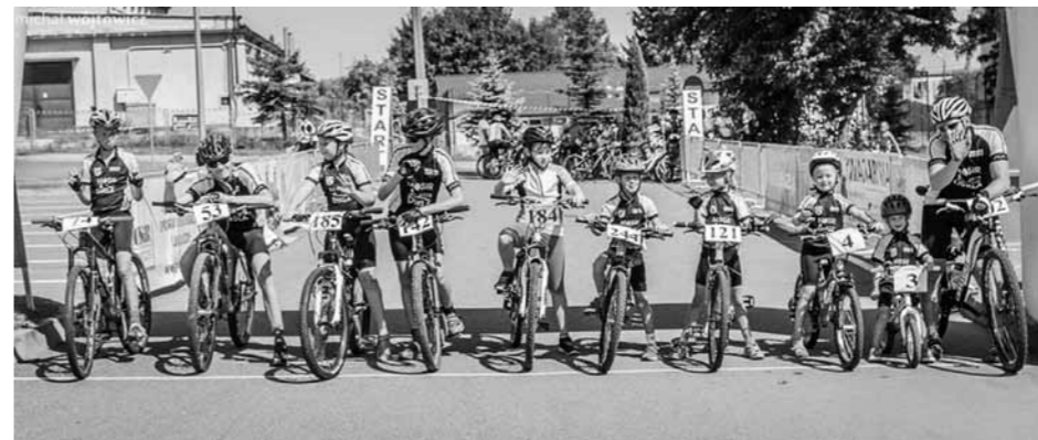
Podkarpacka Liga Rowerowa w Jedliczu