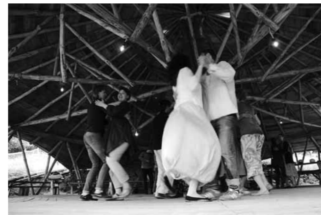
Potańcówka w wiacie