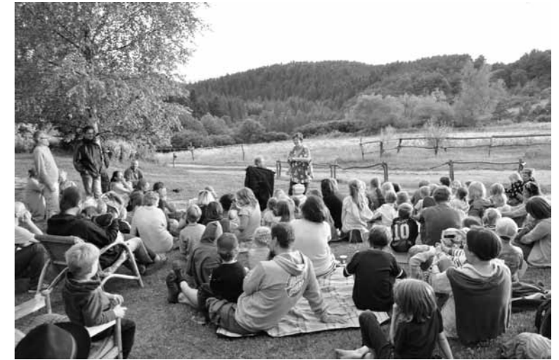
W Zawadce Rymanowskiej

dzieło, potrawy oraz potaćczyć jak za dawnych lat sztajerkę, polki, walczyki i tanga przy kapeli Pogórzanie.