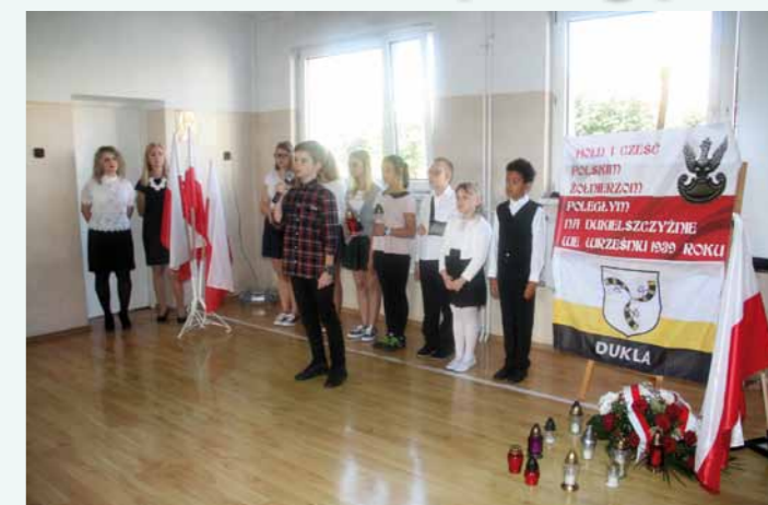
Uroczysta akademia w SP w Dukli