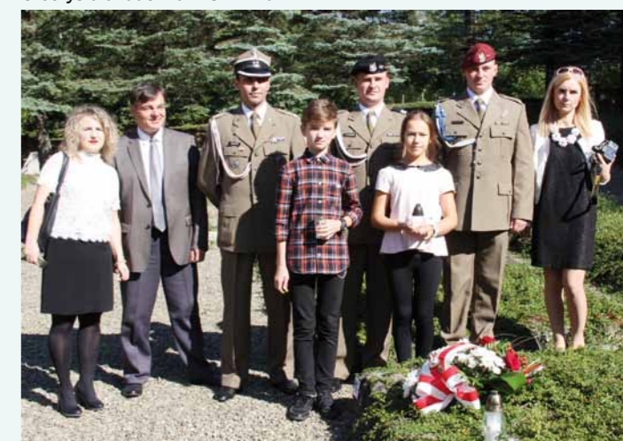
Na cmentarzu wojennym w Dukli