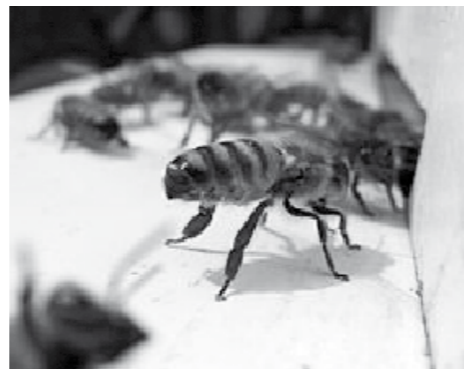
Fot. Pszczoła odstawia gruczoł zapachowy.

do którego ula się kierować. Dla pszczoł jest to ważna informacja, bo pomyłka może kosztować je życie. Jeżeli pszczoła pomyli ul to strażniczki na wylotku będą ją dotykały czułkami, jeżeli wyczują inny zapach niż własnej rodziny, zostanie odebrana jako intruz i bezlitośnie ją zaatakują. Pszczoły nie są odporne na swój jad. Pożądlenie przez inne pszczoły jest dla nich śmiertelne. Dlatego natura wyposażyla je w ten gruczoł. Odkrył go Nikołaj Wiktorowicz Nasonow rosyjski zoolog, a także profesor Uniwersytetu Warszawskiego i opisał go w 1883 roku. Jako ciekawostkę należy podać, że matki pszczoły i trutnie nie mają tego gruczołu. Wydzielina gruczołu Nosonowa przypomina swym zapachem melisę. Pszczelarze wykorzystują to i nacierają olejkiem z melisy ręce, co łagodzi zachowania agresywne pszczoł. A na-