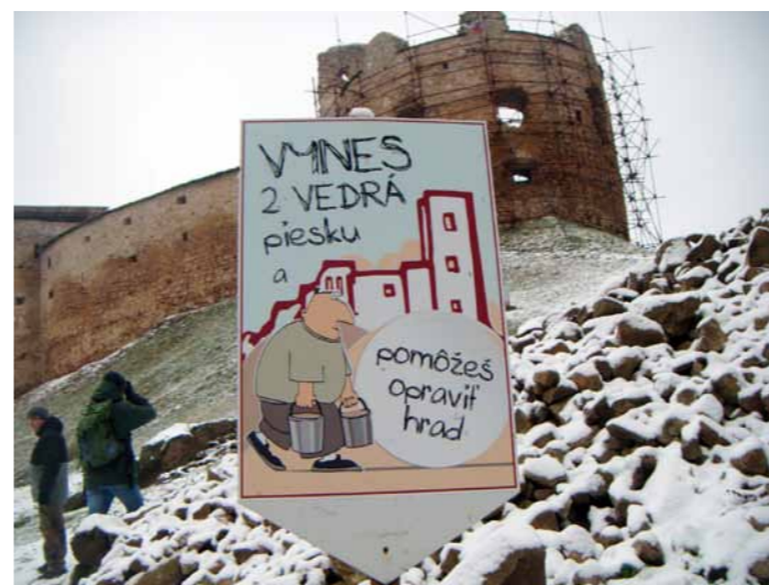
Ruiny zamku Makowica w Zborovie