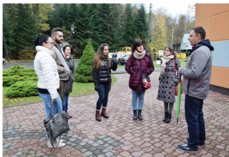
W Muzeum Przemysłu Naftowego i Gazowniczego im. Ignacego Łukasiewicza w Bóbrce

Miło nam jest zatem wszystkim poinformować, że Szkoła Podstawowa im. Marii i Michała Krukierków w Równem podjęła wyzwanie napisania międzynarodowego projektu w ramach programu Erasmus+ KA219 – Partnerstwa strategiczne – współpraca szkół.