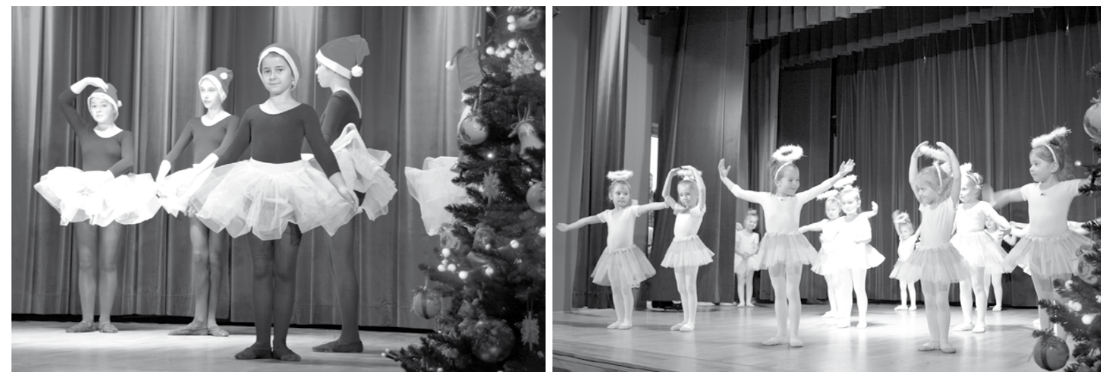
Występ Szkoły Baletowej podczas Jarmarku na scenie OK w Dukli.

Głównym celem „Jarmarku Bożonarodzeniowego” jest przeprowadzenie akcji na rzecz najuboższych mieszkańców naszej Gminy pod nazwą „Podziel się miłością”. Również podczas tej edycji imprezy, Duklanie mogli okazać wielkie serce ofiarując wolne datki na ten szczytny cel. Akcję tradycyjnie wsparło Przedszkole w Dukli, które wystawiło na sprzedaż prace przedszkolaków wykonane wspólnie z rodzicami. Swoją cegiełkę dołożyła Szkoła Podstawowa w Dukli, rozprawdzając świąteczne kartki i ozdoby. Zyskiem ze sprzedaży bożo-