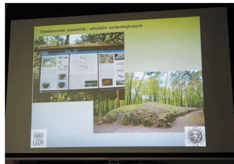
Oznakowanie stanowiska archeologicznego