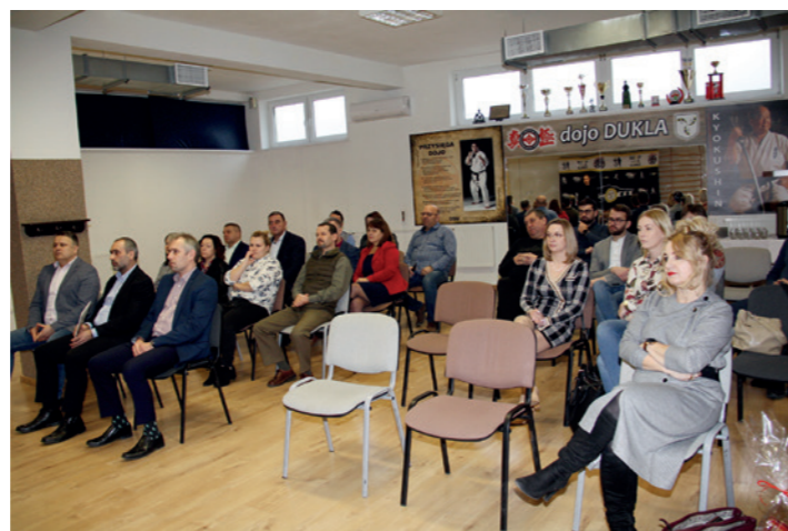
Uczestnicy spotkania w MOSiR Dukla