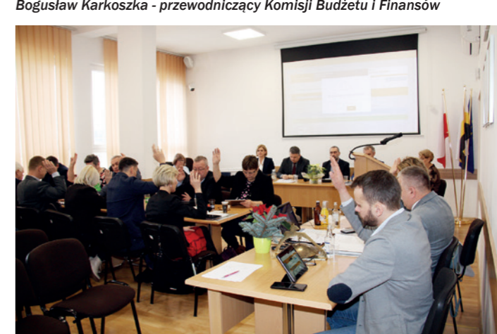
Głosowanie nad uchwałą budżetową