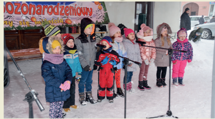
Występ wokalny grupy przedszkolnej