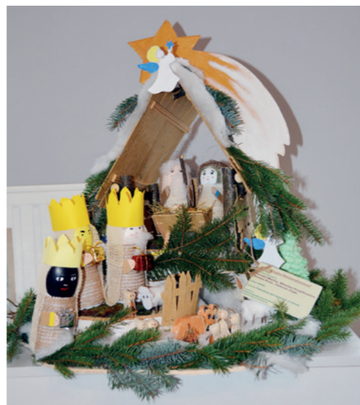
Praca zbiorowa - ŚDŚ w Cergowej 1. m. kat. V - Szopka bożonarodzeniowa

Zwyczaj budowania i wystawiania szopek bożonarodzeniowych jest niezwykle mocno zakorzeniony w tradycji obchodów Świąt Bożego Narodzenia, która sięga IV w. Wtedy to dzięki edyktowi mediolańskiemu chrześcijaństwo przestało być religią prześladowaną, a dzień 25 grudnia – czas przesilenia zimowego (swoiste zwycięstwo światła nad ciemnością, odpowiednik rzymskiego Święta Niepokonanego Słońca) – został uznany za święto kościelne. Boże Narodzenie szybko znalazło odzwierciedlenie w sztuce chrześcijańskiej. Scena narodzin Zbawiciela, któremu towarzyszą postacie jego ziemskich rodziców, pasterzy oraz zwierząt, zaczęła pojawiać się m.in. na wczesnochrześcijańskich sarkofagach, tym samym stając się samodzielnym motywem ikonograficznym.