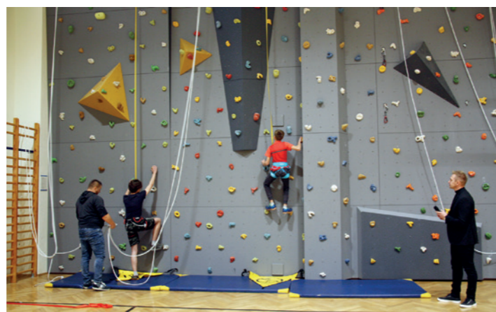
Pierwsi korzystający ze ścianki wspinaczkowej