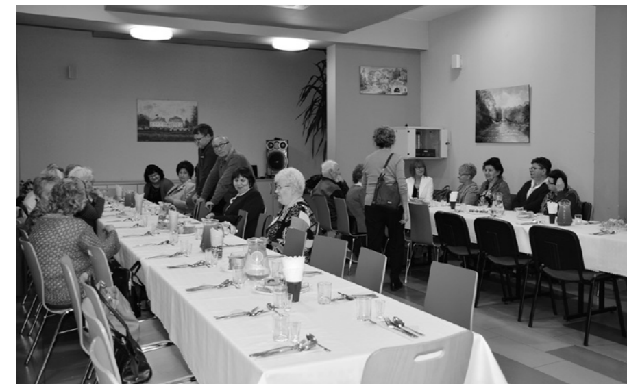
Uczestnicy andrzejkowego poczęstunku