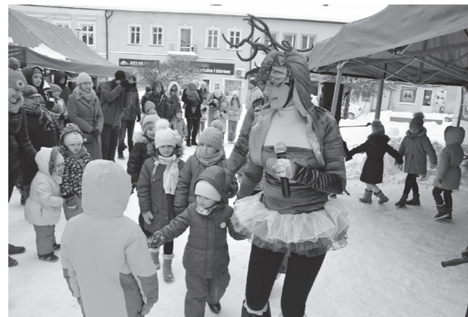
Program dla najmłodszych pt. „Reniferki”

11 grudnia br., tradycyjnie już Ośrodek Kultury w Dukli z Gminnym Przedszkolem zaprosili mieszkańców na dukielski rynek. Tym razem spotkaliśmy się w śnieżnej, prawdziwie zimowej scenarii. W programie tegorocznego Jarmarku Bożonarodzeniowego mogliśmy zobaczyć i usłyszeć m.in. występy wokalne czterech grup przedszkolnych oraz program dla najmłodszych pt. „Reniferki”. Podczas jarmarku odbyło się rozdanie nagród