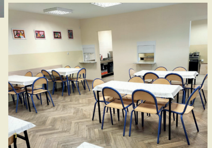
Fragment jadalni w SP w Głojskach