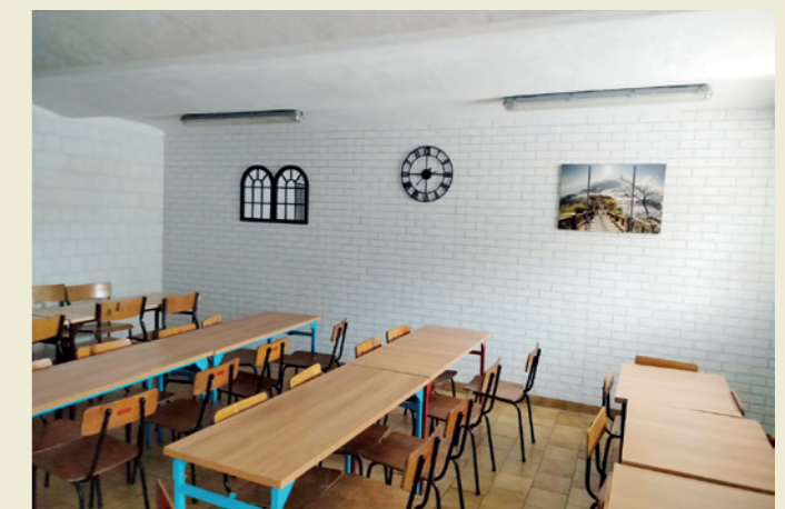
Fragment jadalni w SP w Równem