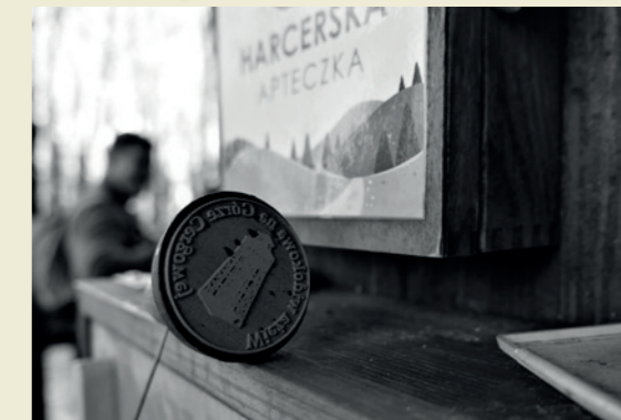
Na górze Cergowej