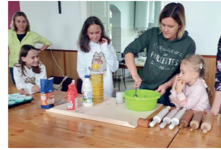
Zajęcia kulinarne i plastyczne dla dzieci