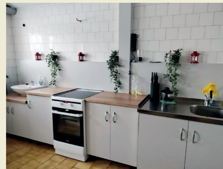
Kuchnia po doposażeniu (SP Równe)