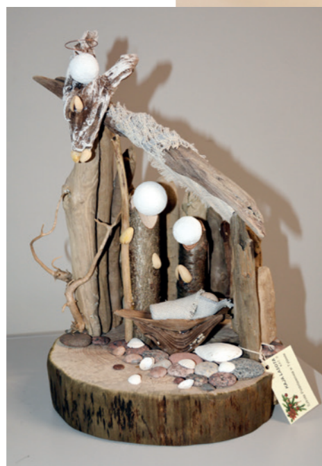
Kaja Lasota (SP w Tylawie) 1. m. w kat. II - Szopka bożonarodzeniowa