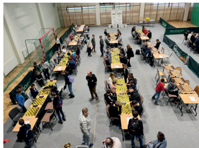
Podczas rozgrywek na hali MOSiR