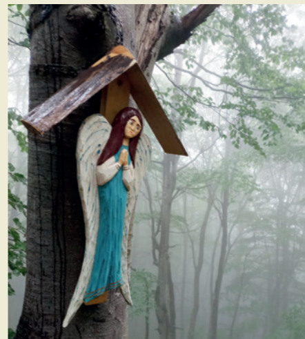
Na beskidzkich trasach można spotkać anioła