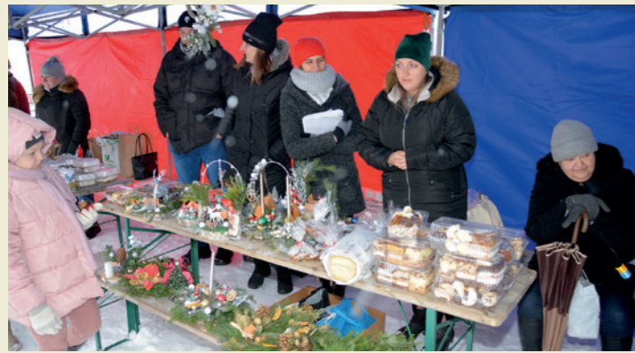
Stoisko ze stroikami i pysznościami świątecznymi