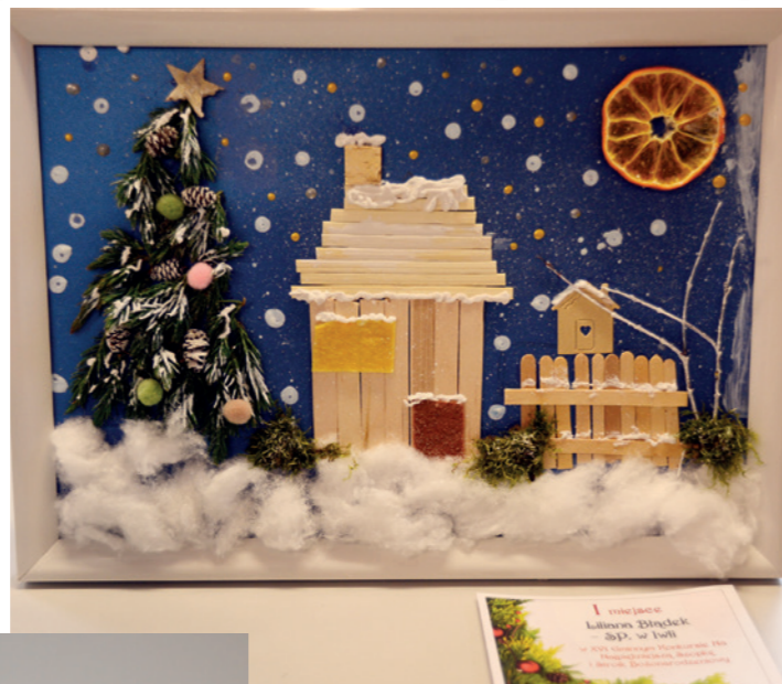
Liliana Błądek (SP. w Iwli) - 1 m. w kat I - Stroik świąteczny