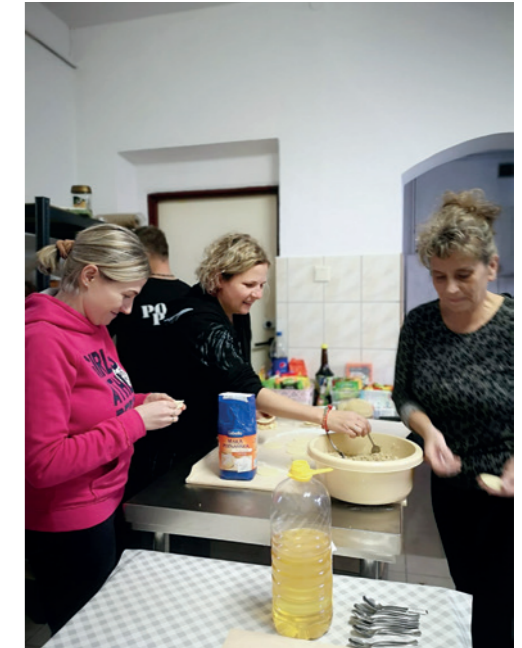
Zajęcia kulinarne dla dorosłych