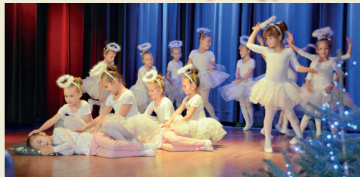
Występy dzieci ze szkoły baletowej