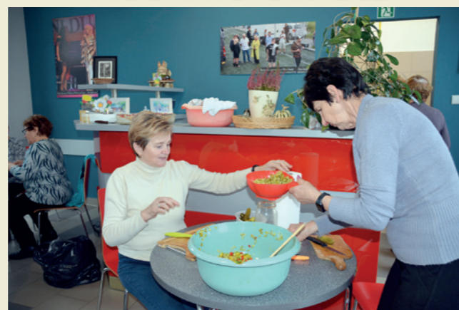
Przygotowywanie salatek jarzynowej