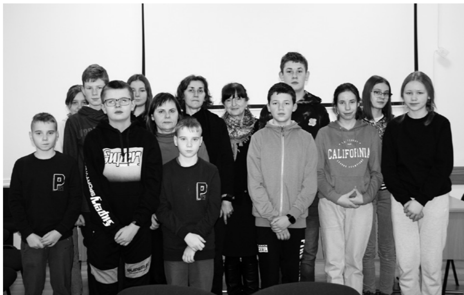
Uczniowie klasy VIII Szkoły Podstawowej w Jasionce z nauczycielkami i pracownikiem UM w Dukli