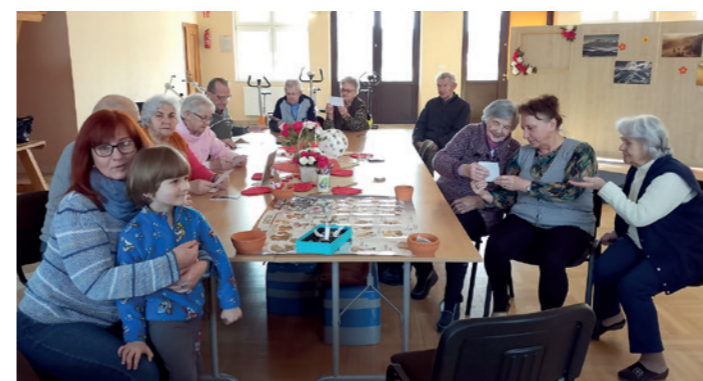
Leos u seniorow