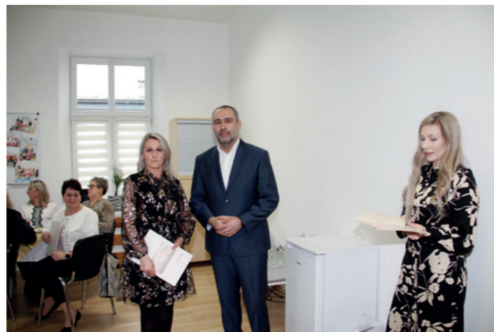
Podczas uroczystości burmistrz Dukli wręczał podziękowania pracownikom

W latach 2019-2024 do żłobka w Dukli uczęszczało 334 dzieci. W roku 2024 dopłata do 1 dziecka w żłobku wynosi 848 zł/miesięcznie tj. 20% najniższego krajowego wynagrodzenia.