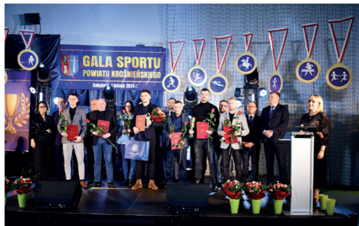
Najlepsi piłkarze powiatu krośnieńskiego 2023