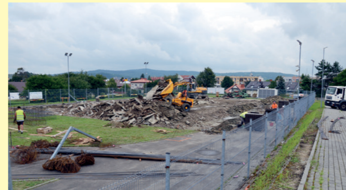
Rozpoczęcie prac przy hali łukowej - przygotowanie terenu