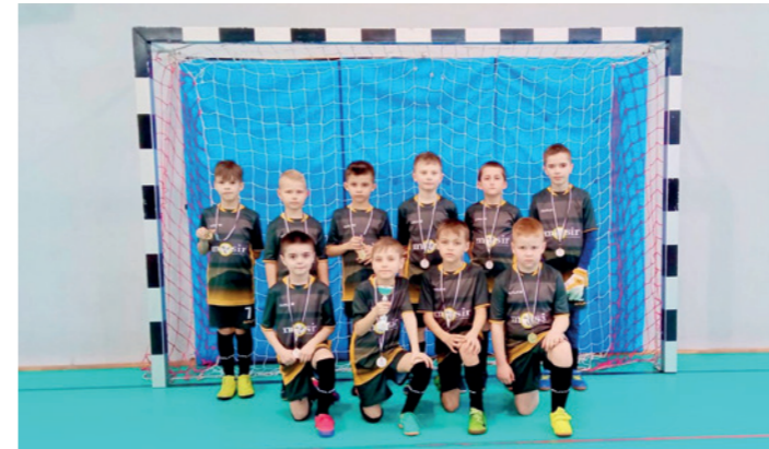
Zawodnicy rocznika 2015