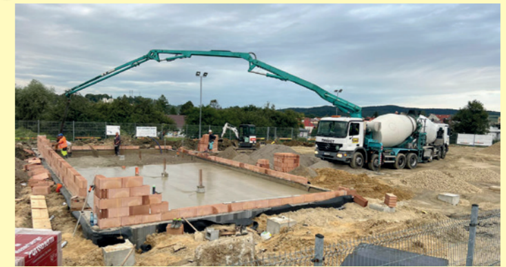
Przygotowanie wylewki pod halę