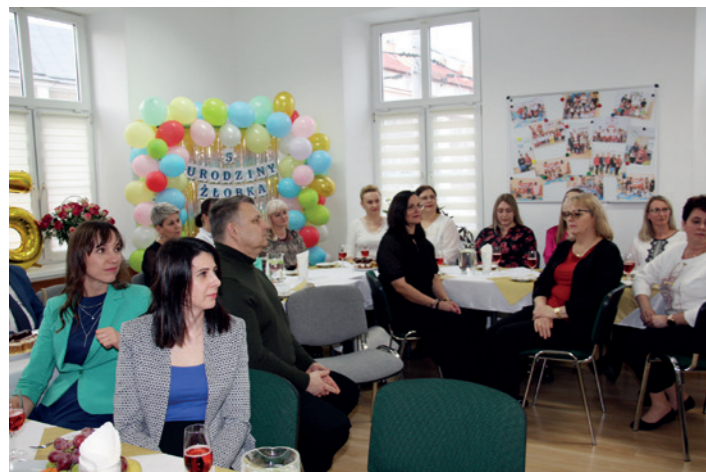
Uczestnicy uroczystości 5. lecia