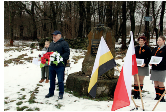
Prezes Stowarzyszenia Sztetl Dukla przywitał gości i wygłosił słowo wstępne