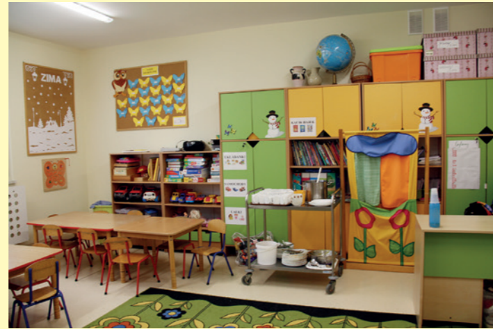
Wyposażenie jednej z sal