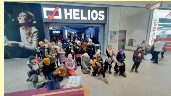
Wizyta w kinie Helios