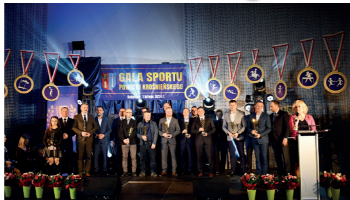
Najlepsi trenerzy powiatu krośnieńskiego 2023 z organizatorami