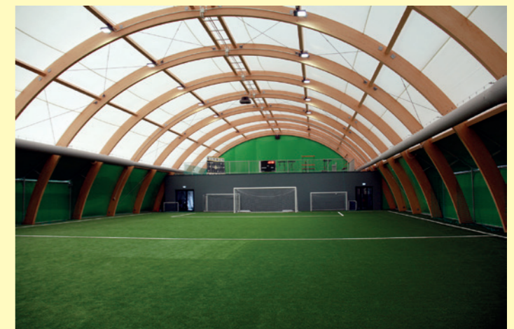
Boisko sportowe w hali