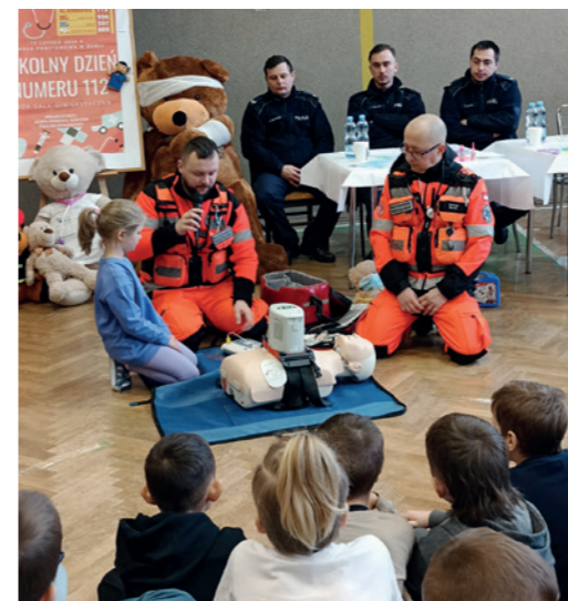
Ratownicy podczas zajęć praktycznych