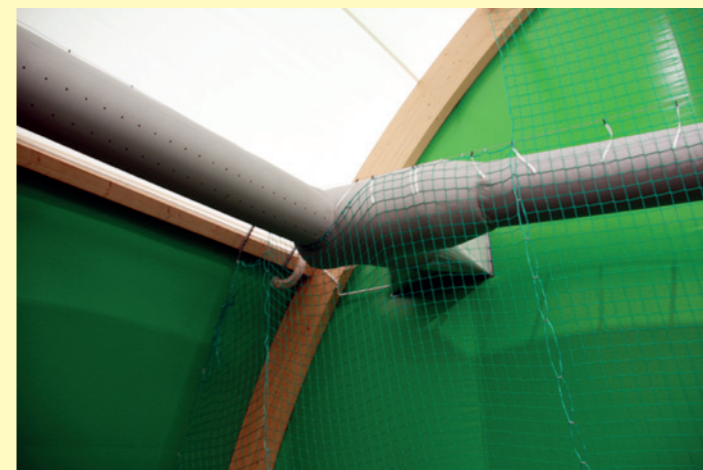
Rękaw do rozprowadzania ciepła w hali