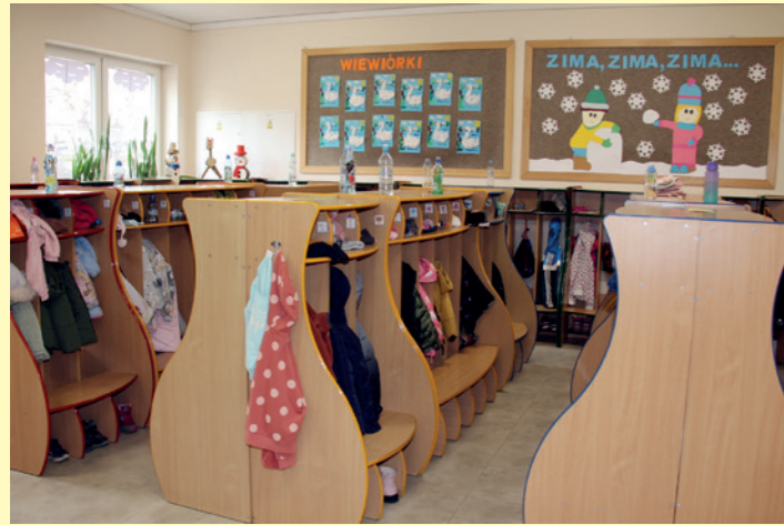
Szatnia dla przedszkolaków