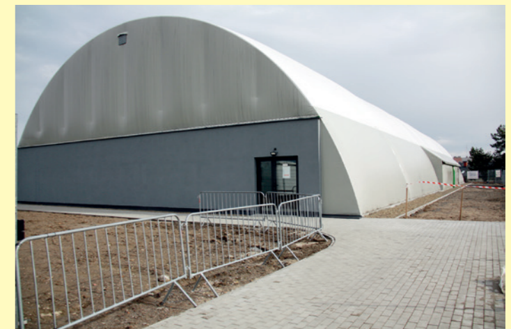
Hala łukowa - widok ogólny z zewnątrz