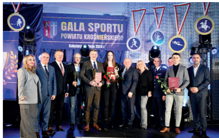
Najlepsi z najlepszych 2023 z organizatorami