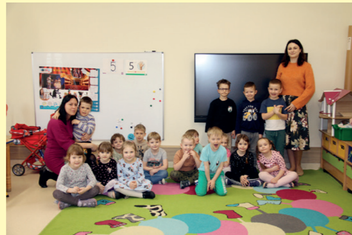
Grupa „Wiewiórek” z opiekunkami