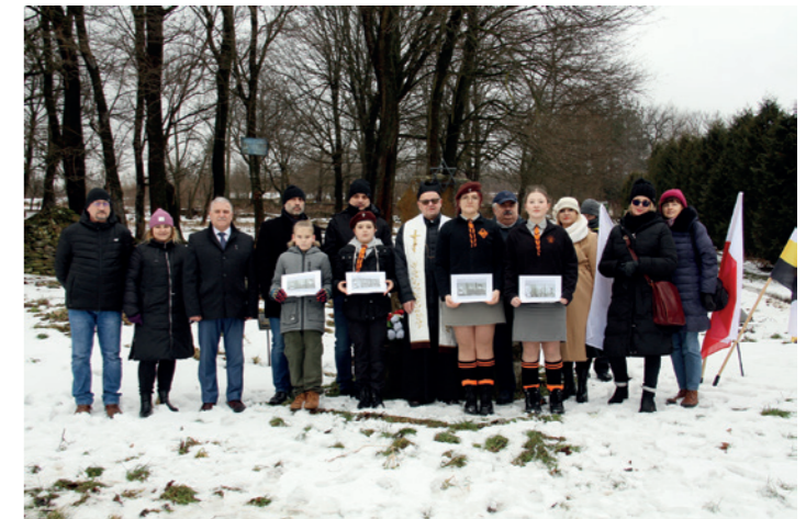
Pamiętkowe zdjęcie uczestników uroczystości przy pomniku upamiętniającym pomordowanych dukielskich Żydów