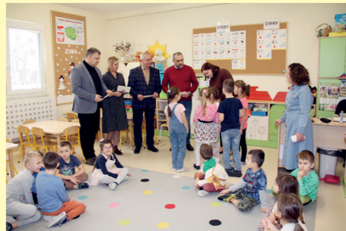
Laurki z podziękowaniami wręczali gościom przedszkolacy