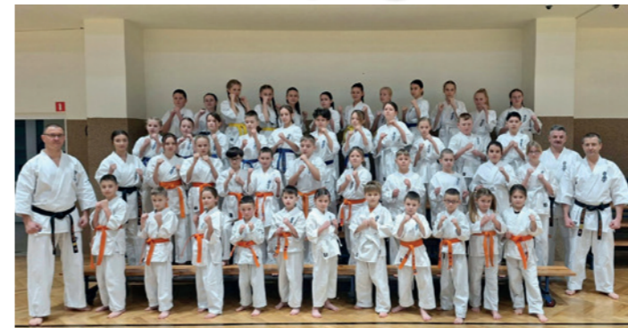
Uczestnicy egzaminu z organizatorami