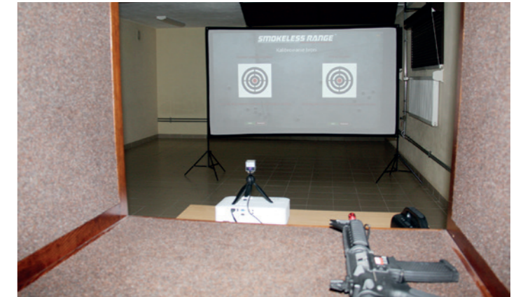
Tarcza strzelnicy laserowej