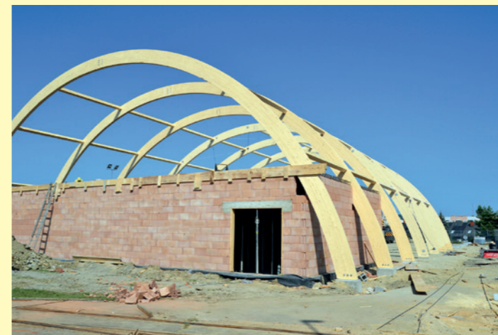
Konstrukcja łukowa z częścią socjalną