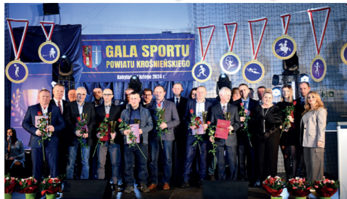
Najlepsi działacze powiatu krośnieńskiego 2023 z organizatorami