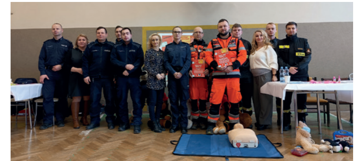
Ratownicy, strażacy i organizatorki EDNA 112