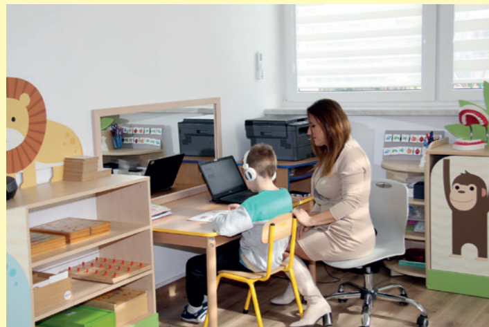
W gabinecie logopedycznym