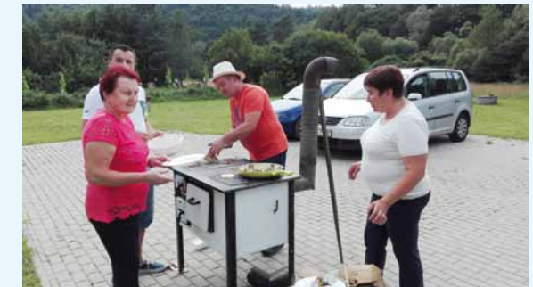
Dorośli zapewnili młodym uczestnikom smaku i wizualny powrót do korzeni