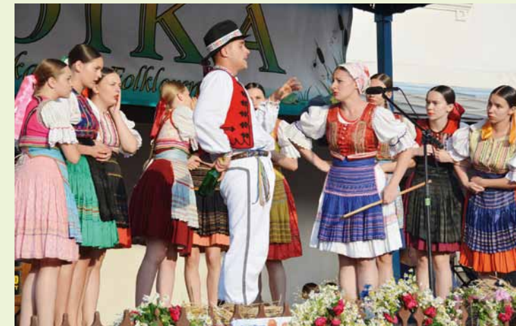
Występ zespołu „Rozmarija” ze Słowacji