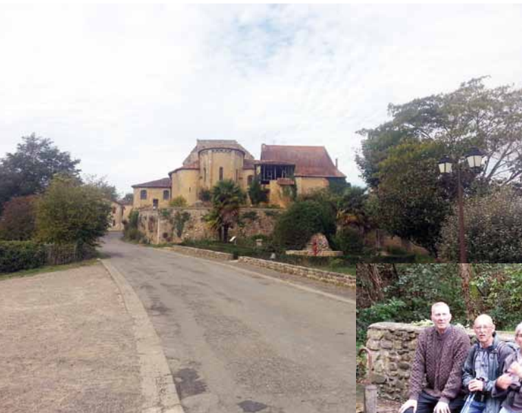
Kościółek w Arzacq