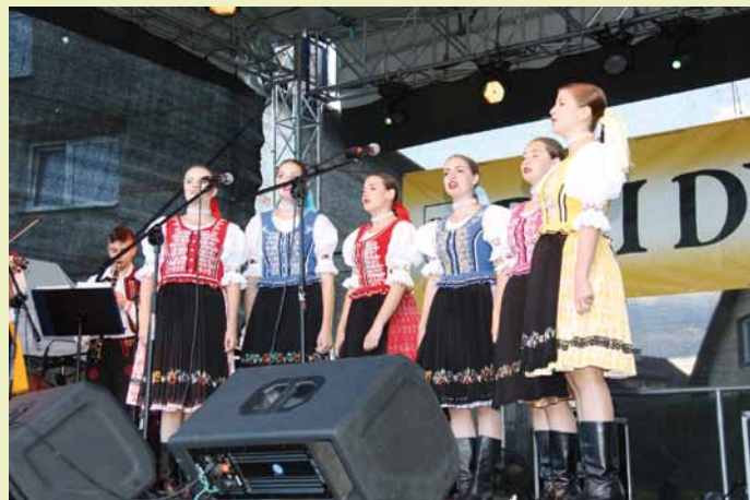
Zespół Makovica ze Svidnika