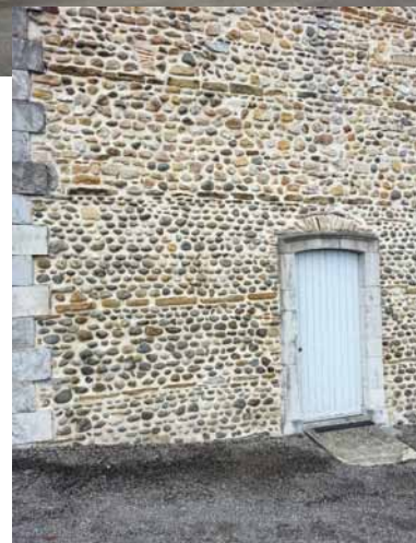
Typowy dom z kamienia lokalnego w krainie Basków