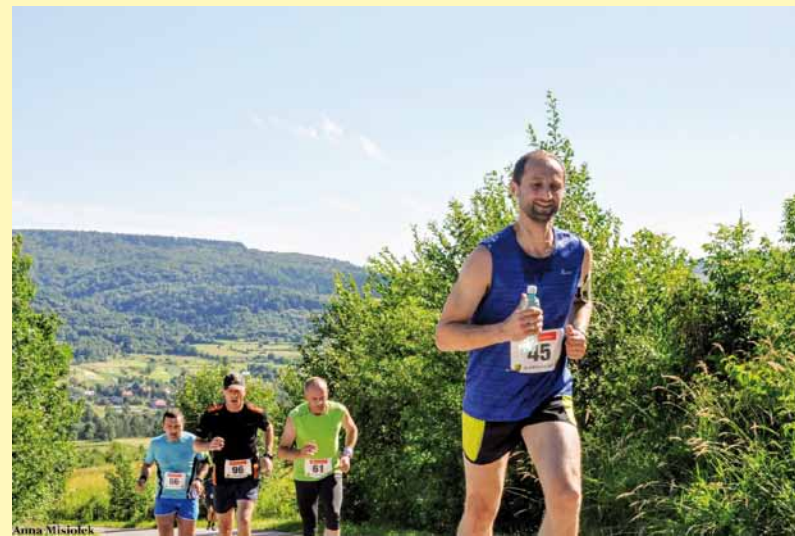
Na trasie biegu