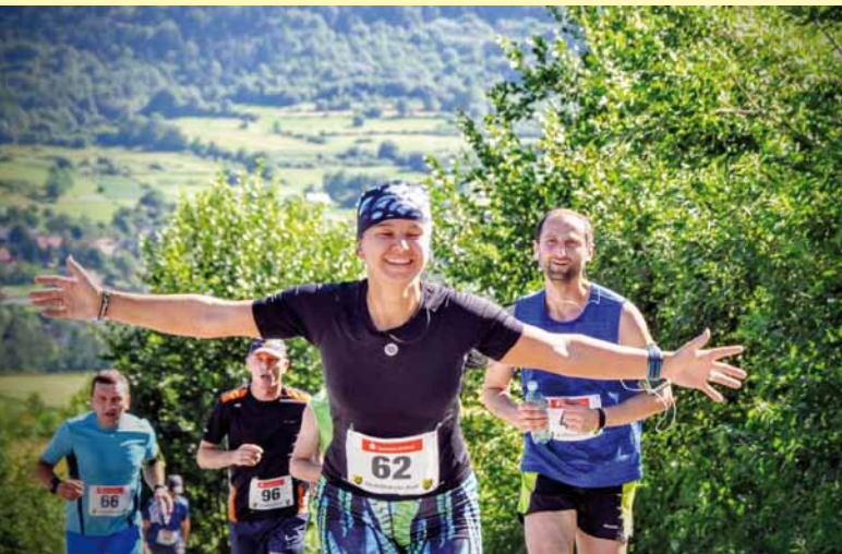
Zawodnicy z radością dobiegali na metę