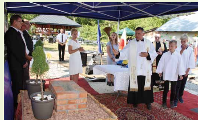
Poświęcenie miejsca wmurowania kamienia węgielnego miało charakter ekumeniczny