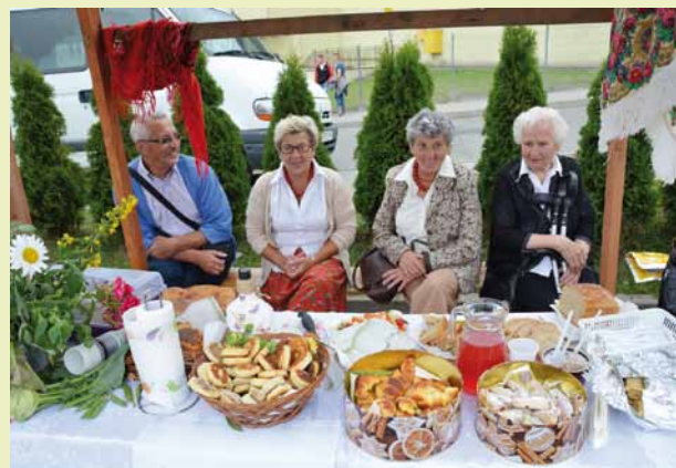
Jadło z gminy Dukla zaprezentowało KGW z Łęk Dukielskich