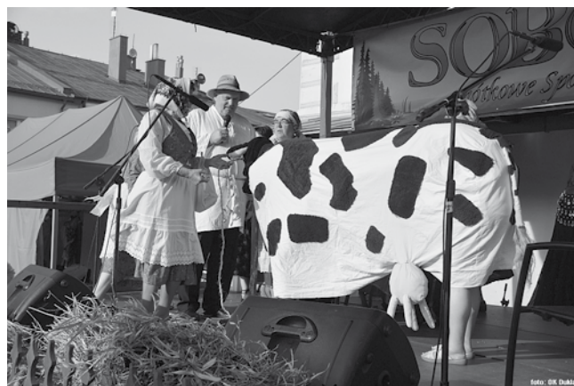
Nie brakowało różnych zabawnych scen obrzędowych