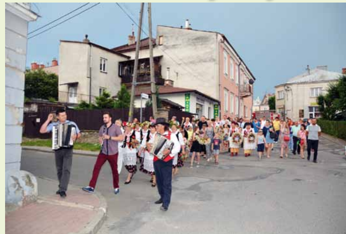
Sobótkowy korowód zmierza ku Dukielce