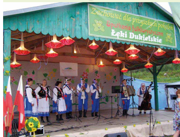
Występy zespołów uczestniczących w spotkaniach folklorystycznych