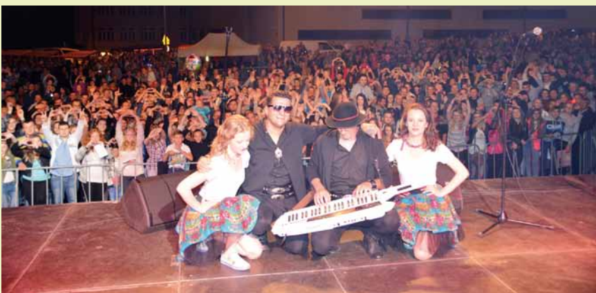
Pamiątkowe zdjęcie Kordiana z publicznością