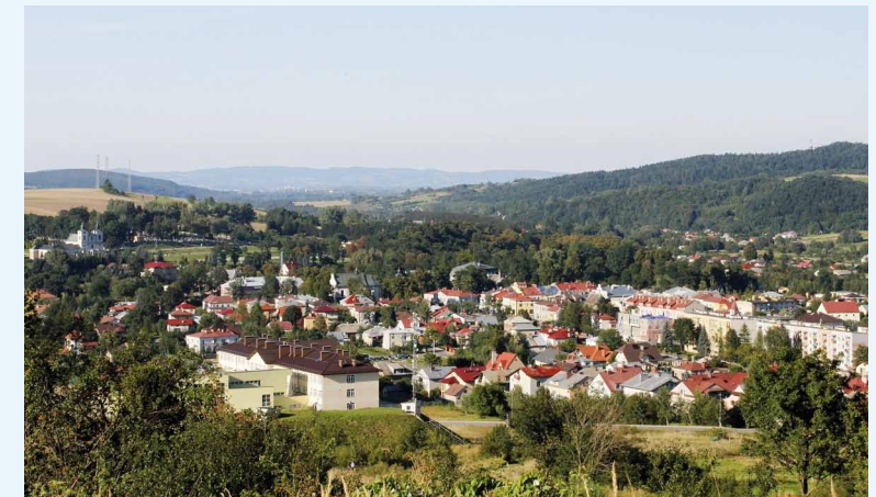
Panorama Dukli z Chyżek