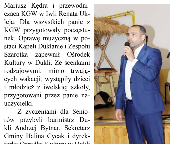
Burmistrz Dukli złożył życzenia Seniorom

pwd. Justyny Zimny- Frużyńska drużynowa 6 DH ISKRA