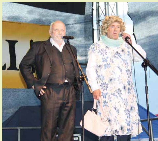
Kabaret Koń Polski na dukielskiej scenie