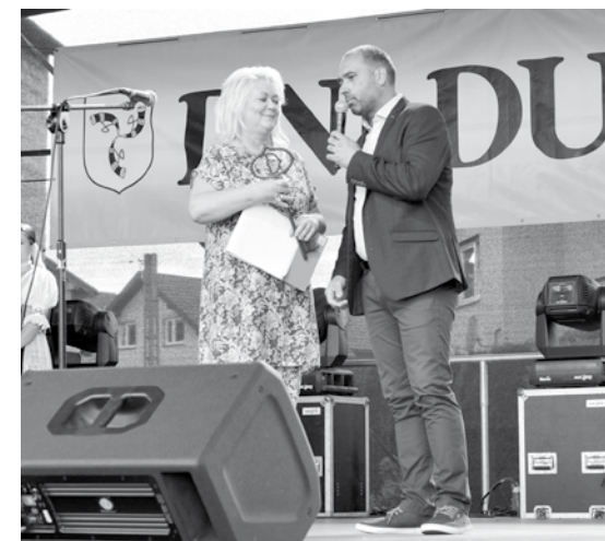
Przekazanie kluczy do miasta