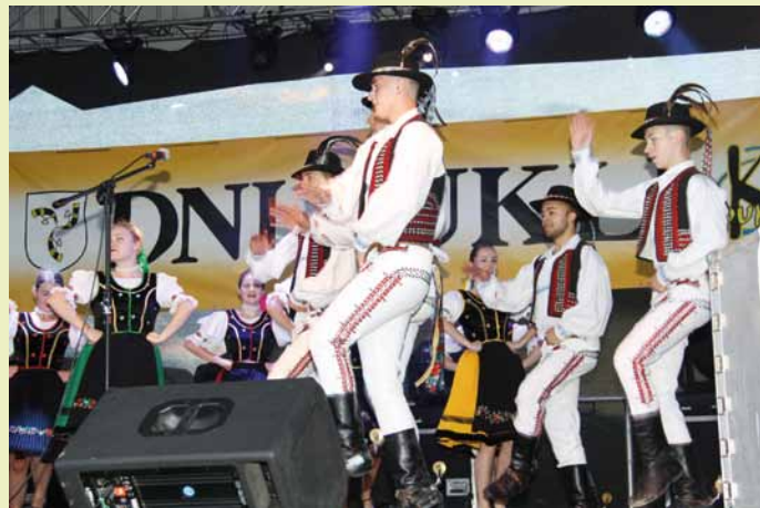
Zespół Stropkovan ze Stropkova