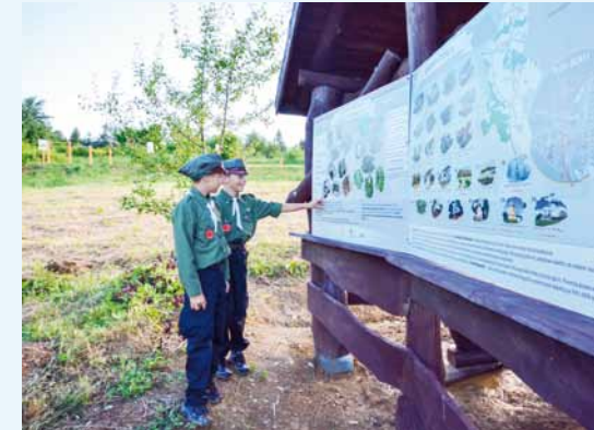
Harczerze przy tablicy edukacyjnej