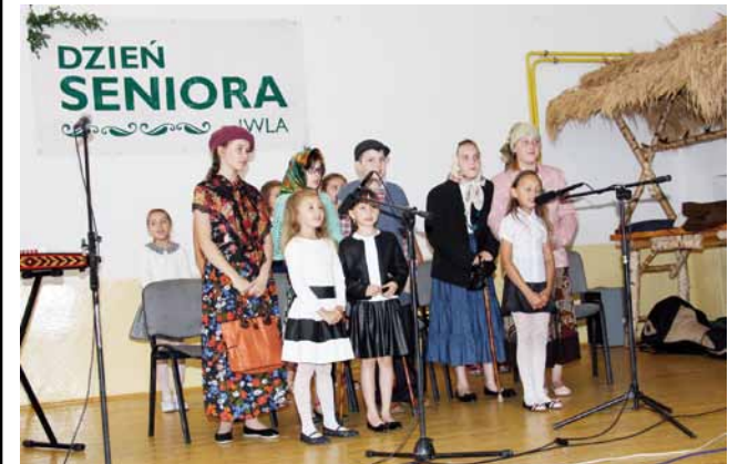
Dzieci ze Szkoły Podstawowej i Gimnazjum przygotowały program dla seniorów