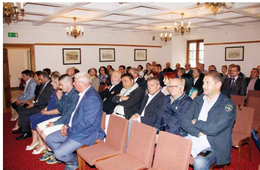
Uroczysta sesja Rady Miejskiej w Dukli