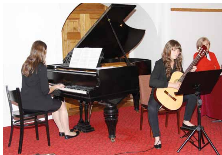
Koncert w wykonaniu sióstr Ros ze Szkoły Muzycznej w Krośnie