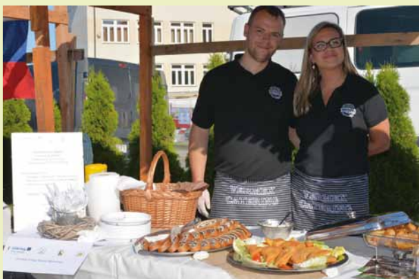
Degustacja słowackiego jadła