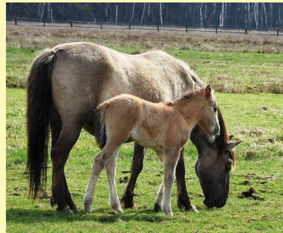
Klaczka Heca z mamą