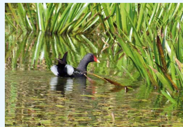
Kaczki Uhle Melanitta fusca na Bajorku w Niżnej Łące