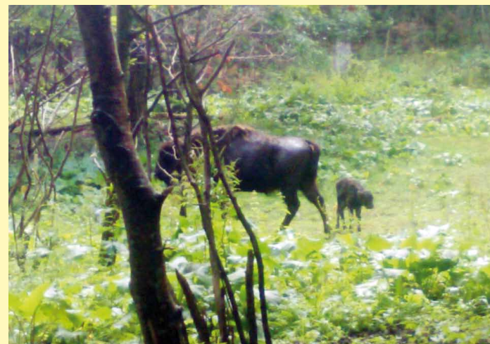
Młody byczek z mamusią

Sprzedam dom mieszkalno-komercyjny w centrum Dukli.