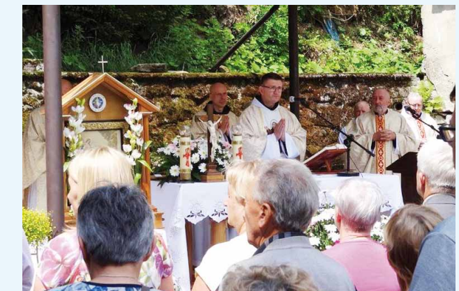
Uroczystości odpustowe na Puszczy św. Jana z Dukli