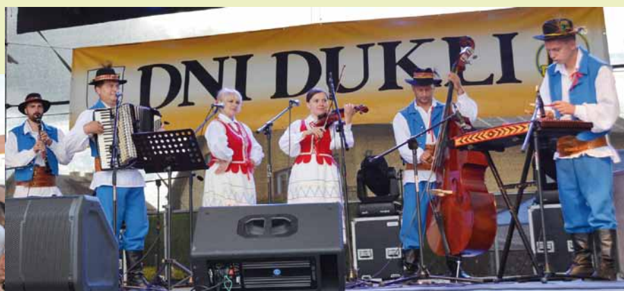
Kapela ludowa Duklanie