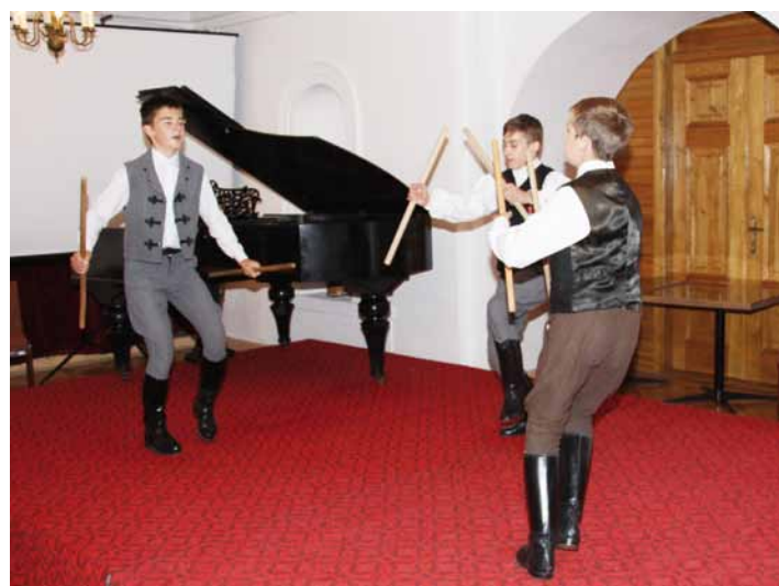
Występ taneczny uczniów z Opalyi z Węgier