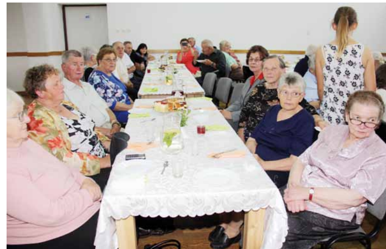
Seniorzy przybyli bardzo licznie