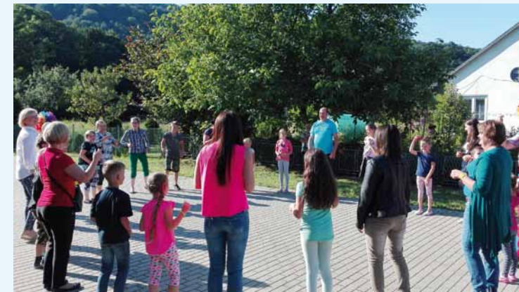
Wspólna zabawa z rodzicami