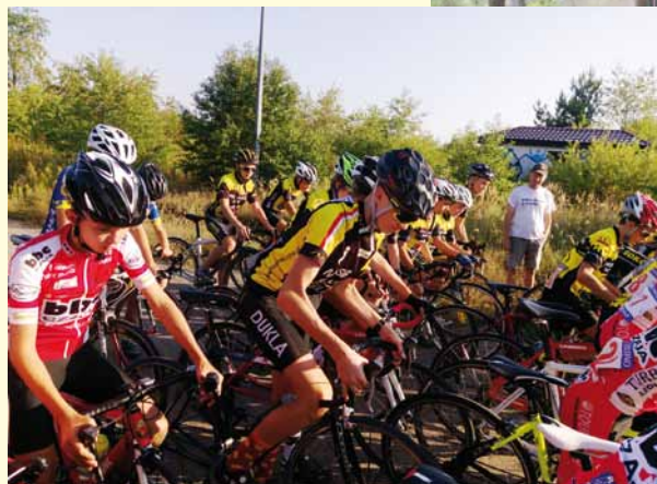
Zmagania ostatniego tygodnia. Zawodnicy na trasie