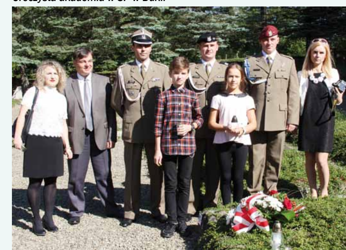
Na cmentarzu wojennym w Dukli