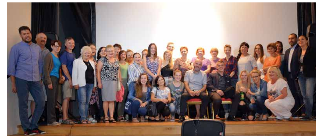
Pamiątkowe zdjęcie z uczestnikami spotkania