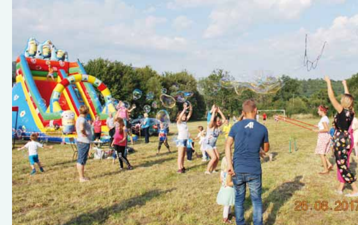
Bańki mydlane miały duże powodzenie