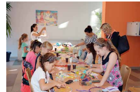
Uczestnicy warsztatów przy pracy.