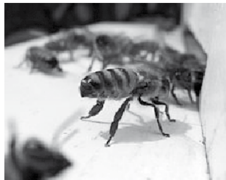
Fot. Pszczoła odstawia gruczoł zapachowy.