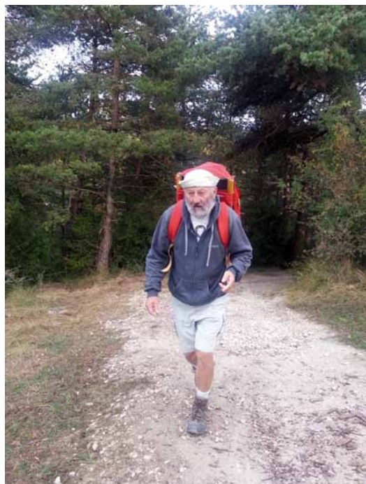
W drodze do celu