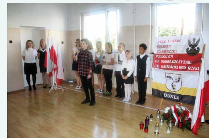
Uroczysta akademia w SP w Dukli