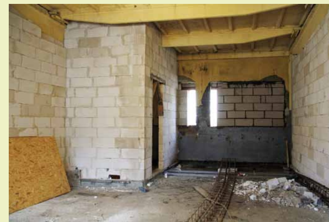
Prace wykończeniowe w toku