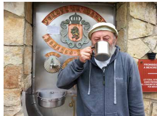
Tak smakuje wino po 1200 km trasy - fotanna z winem na trasie do Estelli