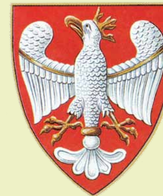
Orzeł Przemysła II (1295)