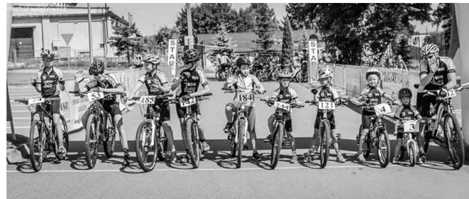
Podkarpacka Liga Rowerowa w Jedliczu