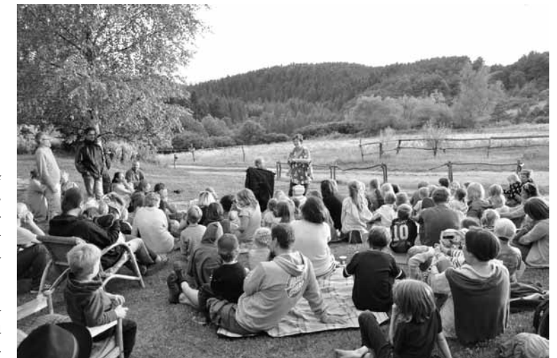
W Zawadce Rymanowskiej

dzieło, potrawy oraz potaćczyć jak za dawnych lat sztajerkę, polki, walczyki i tanga przy kapeli Pogórzanie.