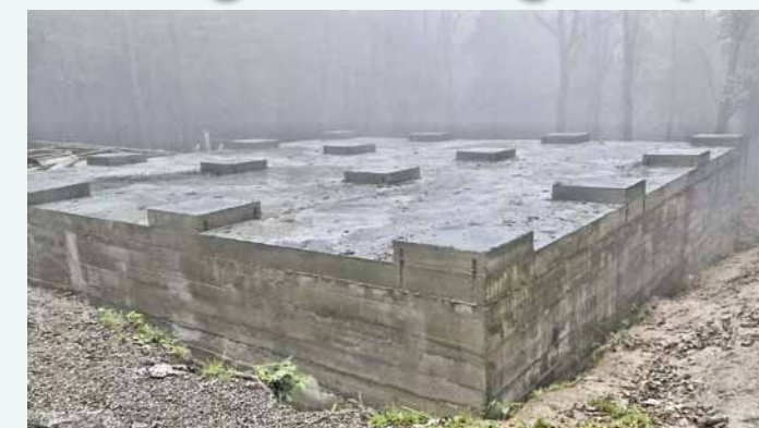
Fundament i płyta pod wieżę na G. Cergowej.