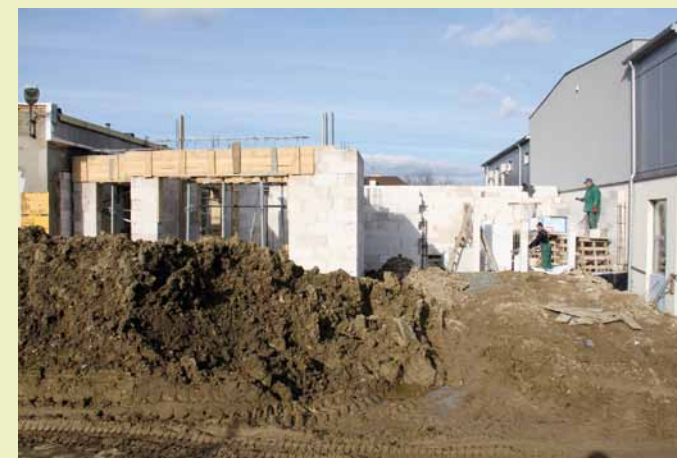
W trakcie budowy