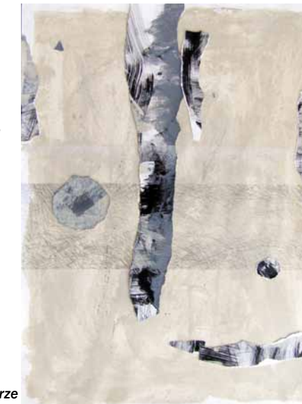
Istotnie, 2017, akryl, rysunek na papierze