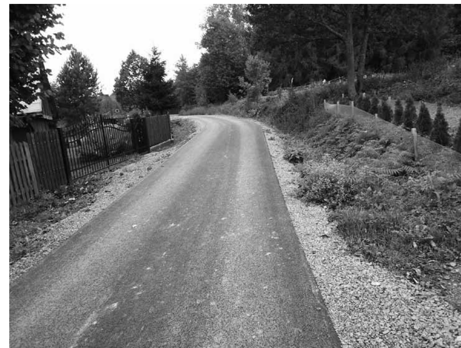
Wykonanie nakładki asfaltowej na drodze wewnętrznej nr ewid. 396 w Myszkowskim

płatne z budżetu Gminy Dukla w kwocie 20 191,68 zł.