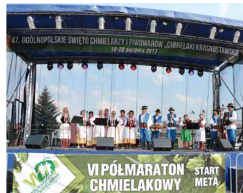
Szarotka-Duklanie podczas Chmielakowej Potkańki