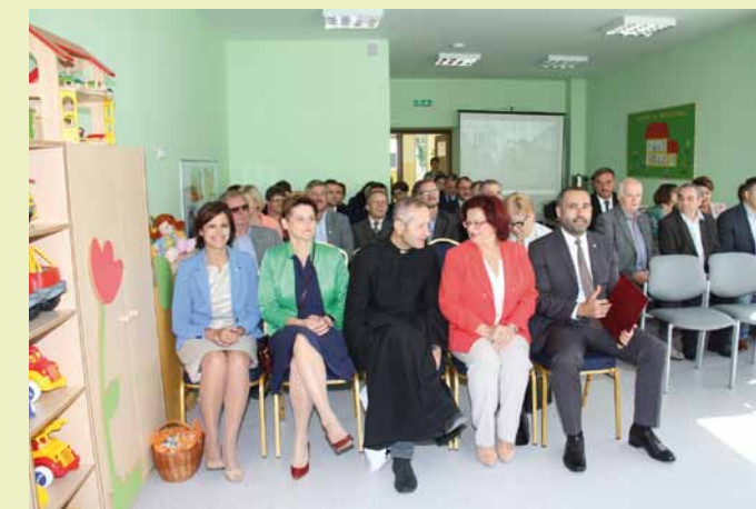
Podczas spotkania w czasie otwarcia placówki