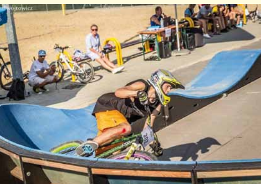
Zawodnik podczas rywalizacji