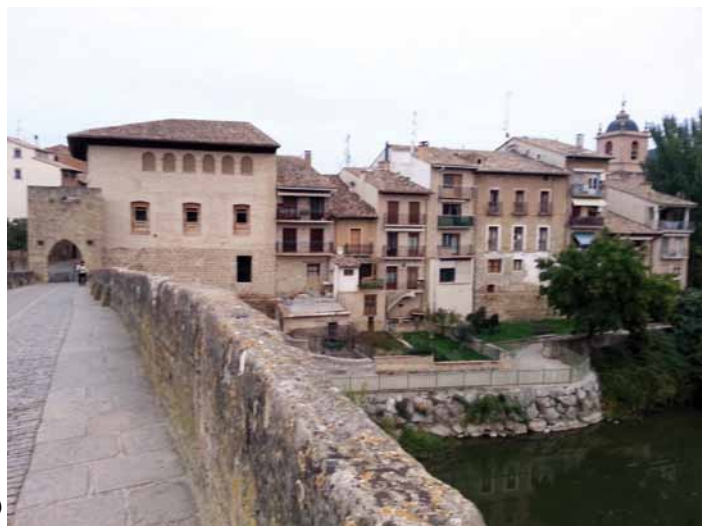
Puente la Reina (Most Królowej)