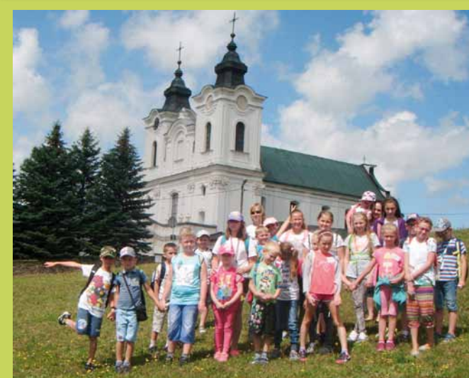
Półkoloniści z Wrocanki pod klasztorem OO. Bernardynów w Dukli