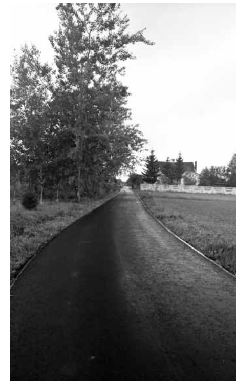
Wykonanie nakładki asfaltowej na drodze wewnętrznej nr ewid. 1326 w Teodorówce