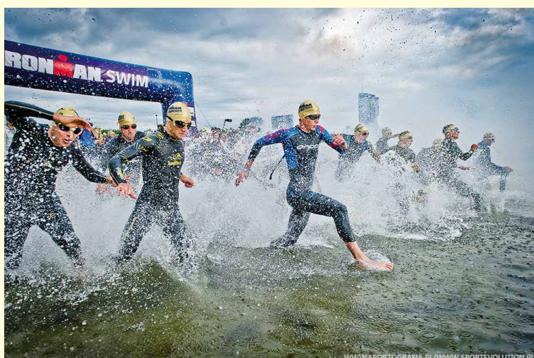
Uczestnicy prestiżowych zmagania triathlonu w Gdyni

Sprzedam dom mieszkalno-komercyjny w centrum Dukli.