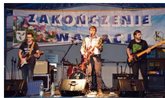
Egzotyczny Dandys Paryskich Bulwarów