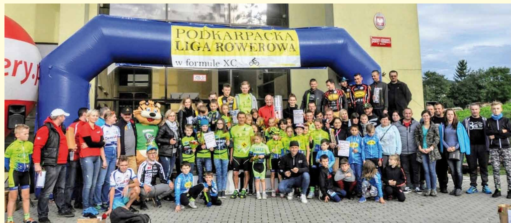
Podkarpacka Liga Rowerowa w formule XC. Finał dukielski.