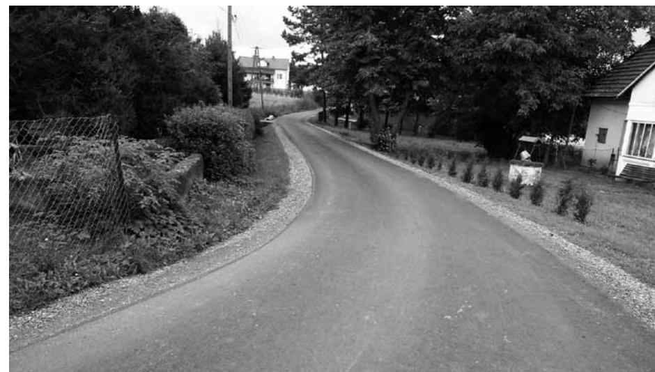
Wykonanie nakładki asfaltowej na drodze gminnej nr ewid. 2125 w Łękach Dukielskich