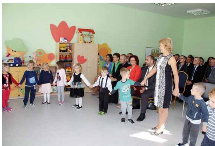
Program artystyczny w wykonaniu najmłodszych przedszkolaków