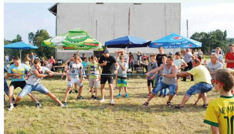
Rywalizacja między miejscowościami była wspaniała