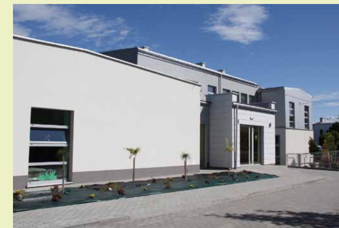
Budynek przedszkola po zakończeniu prac