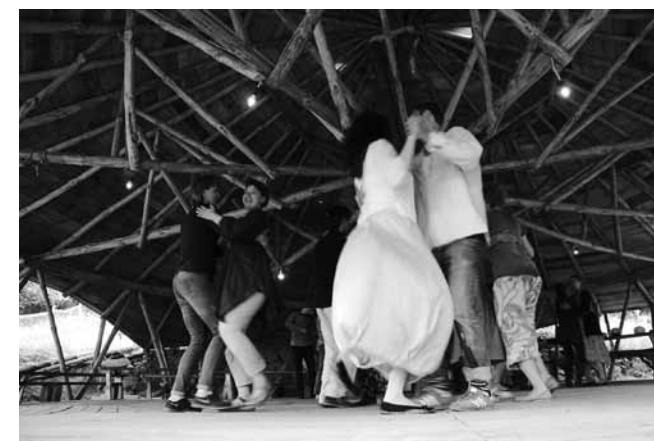
Potańcówka w wiacie