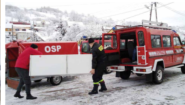
Wolontariusze przy pracy - dostarczanie paczek