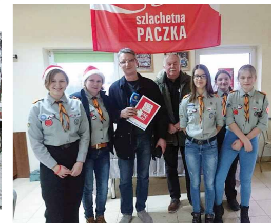
Wolontariusze Szlachetnej Paczki z Dukli