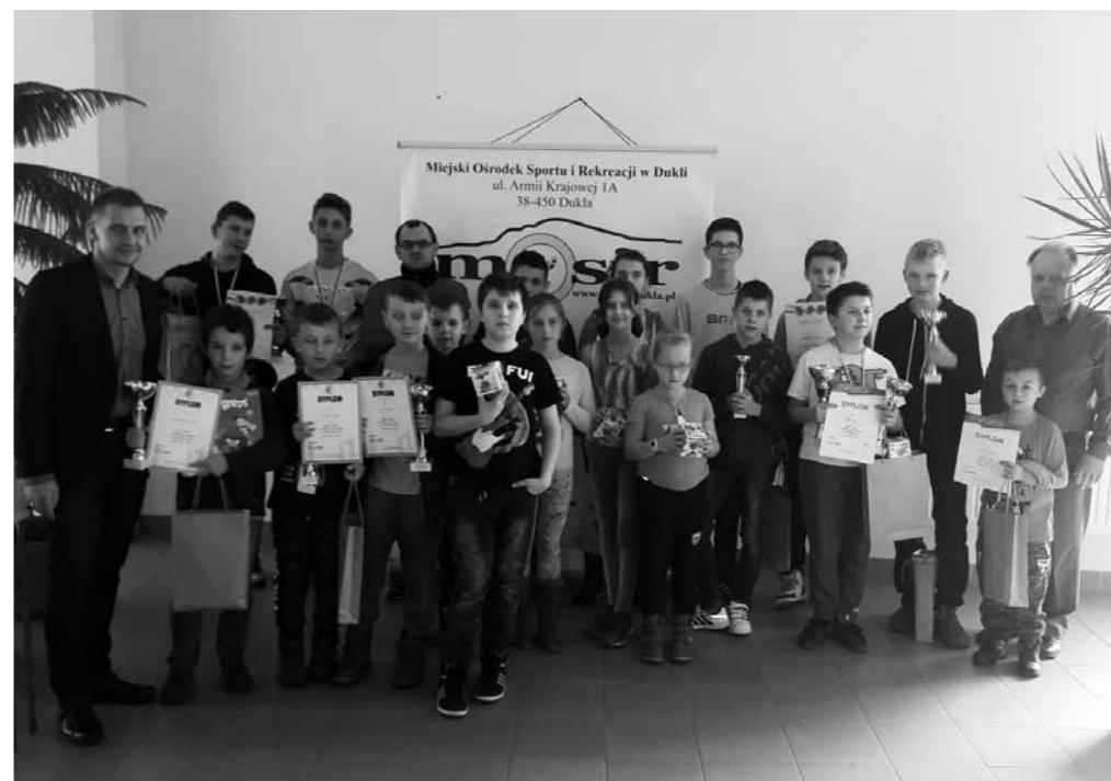
Uczestnicy turnieju z organizatorami

24 listopada br. w Miejskim Ośrodku Sportu i Rekreacji w Dukli dokończono dwa jesienne turnieje szachowe w ramach VII Gminnej Ligi Szachowej o Puchar Burmistrza Dukli, a tym samym zakończono rozgrywki ligowe.