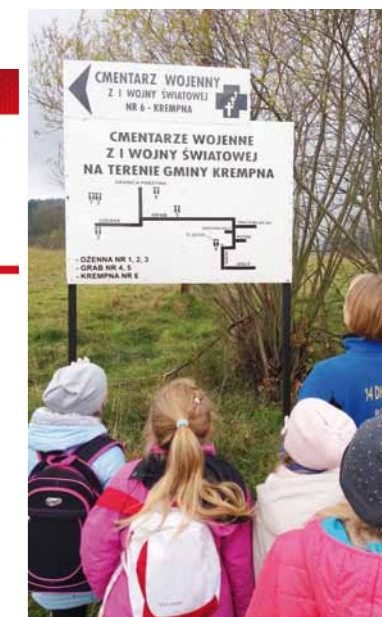
Przy tablicy informacyjnej o cmentarzu wojennym z I wojny światowej w Krempnej