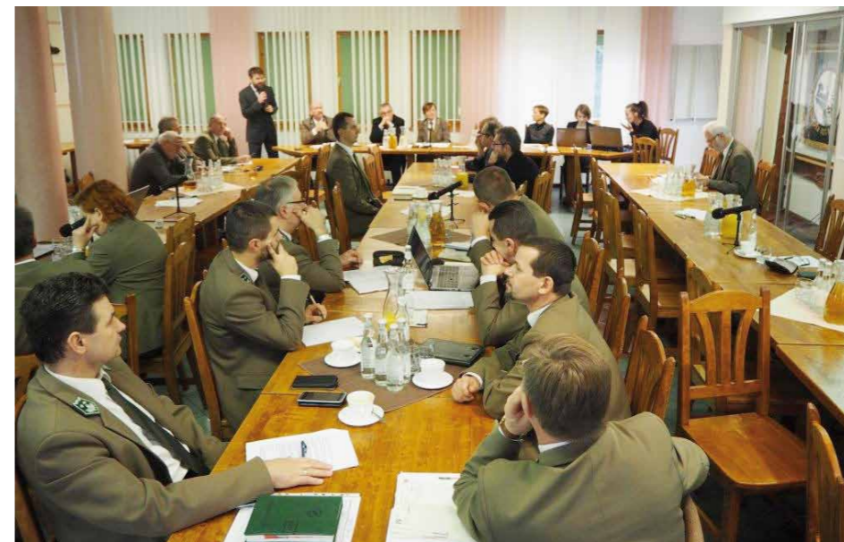
Uczestnicy podczas konferencji.

30 listopada w siedzibie Regionalnej Dyrekcji Lasów Państwowych w Krośnie odbyła się konferencja naukowa pod hasłem „Inwentaryzacja dziedzictwa kulturowego (archeologicznego) na wybranych obszarach RDLP w Krośnie oraz na terenie Magurskiego i Roztoczańskiego Parku Narodowego 2016-2017”, na której przedstawiono i omówiono wyniki badań archeologicznych wykonanych na części nadleśnictw RDLP w Krośnie oraz na terenie Magurskiego i Roztoczańskiego Parku Narodowego.