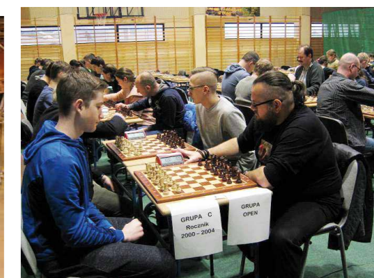
Mikołajkowy Turniej Szachowy - rozgrywki