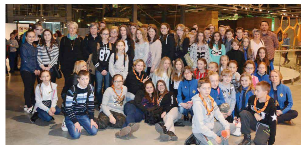
Uczestnicy wyjazdu do Warszawy