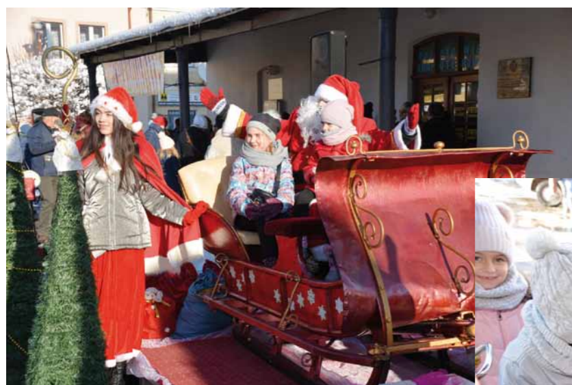
Spotkanie ze Świętym Mikołajem