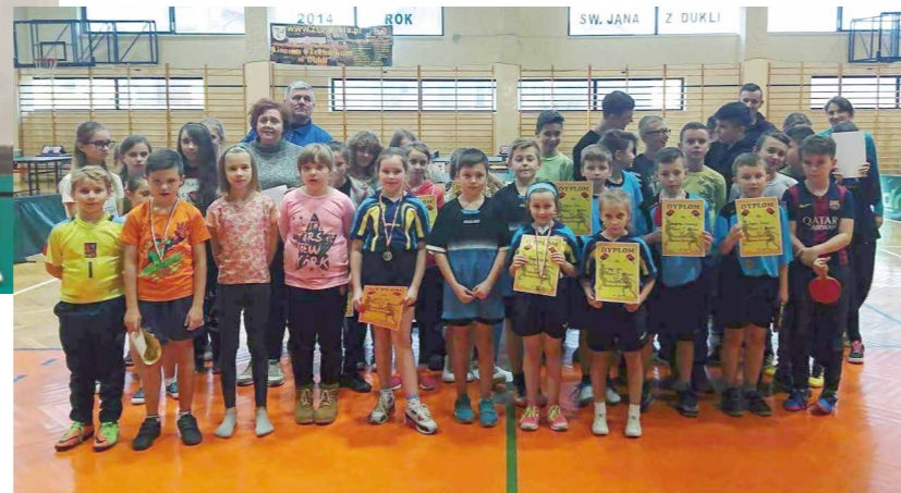
Uczestnicy Szkolnej Ligi Tenisa Stołowego.