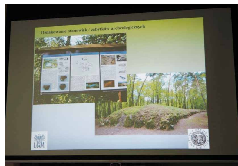
Oznakowanie stanowiska archeologicznego