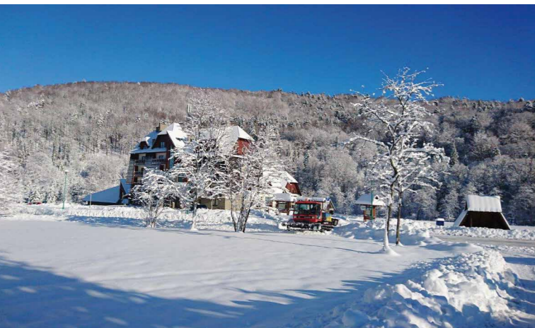
Centrum Promocji Leśnictwa w Muczmem