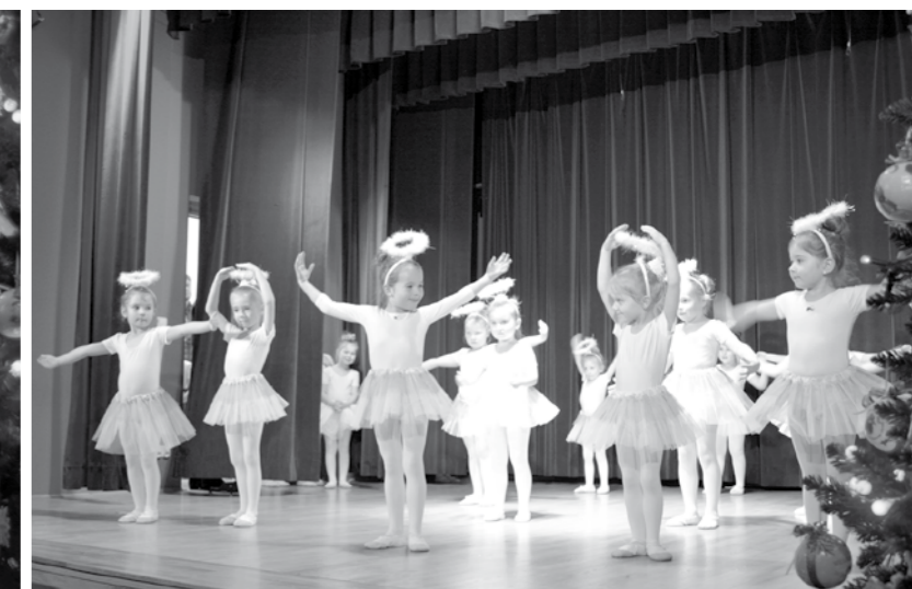
Występ Szkoły Baletowej podczas Jarmarku na scenie OK w Dukli.