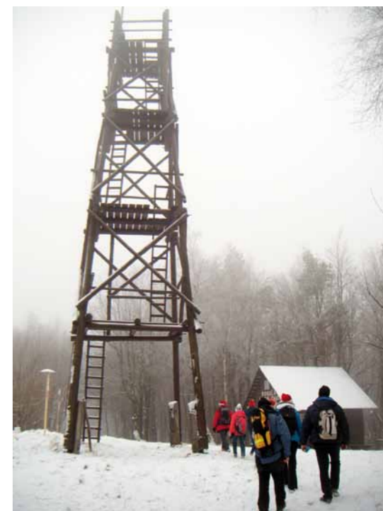
Wieża widokowa na Rohuli