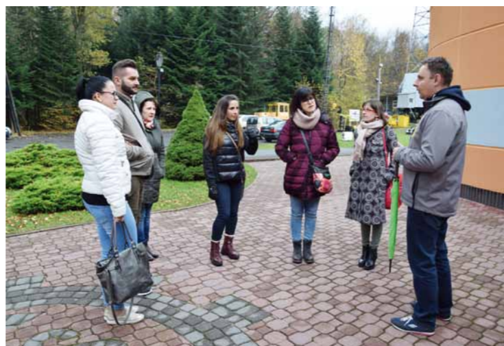
W Muzeum Przemysłu Naftowego i Gazowniczego im. Ignacego Łukasiewicza w Bóbrce

Miło nam jest zatem wszystkim poinformować, że Szkoła Podstawowa im. Marii i Michała Krukierków w Równem podjęła wyzwanie napisania międzynarodowego projektu w ramach programu Erasmus+ KA219 – Partnerstwa strategiczne – współpraca szkół.