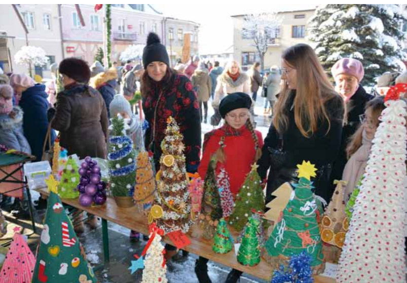
Na dukielskim rynku podczas Jarmarku Bożonarodzeniowego