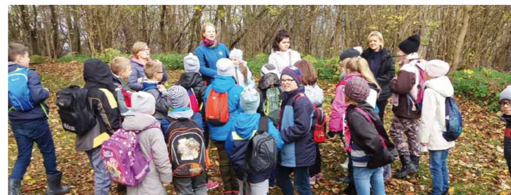
Harcerze i zuchy na wycieczce Szlakiem Frontu Wschodniego w Krempnej