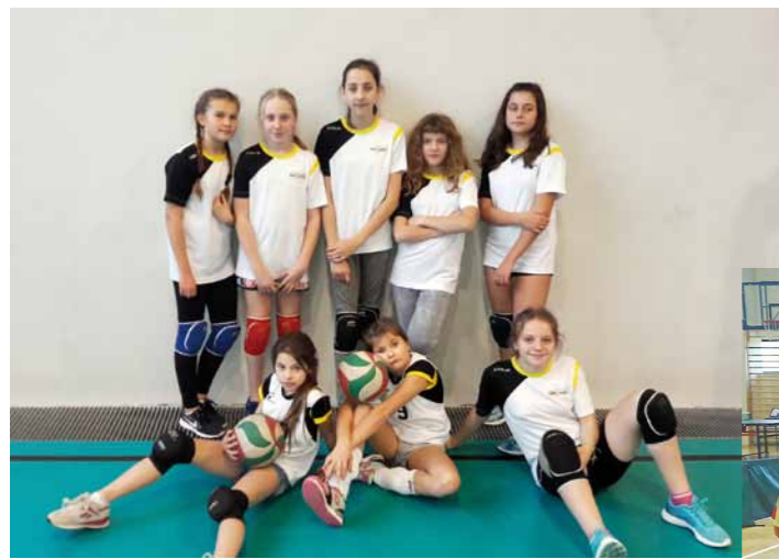
Drużyna Dukla I - 6 miejsce w turnieju