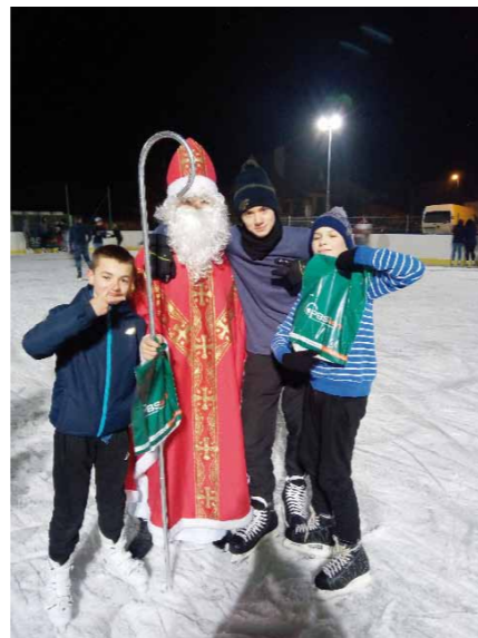
Pamiątkowe zdjęcie z Mikołajem.