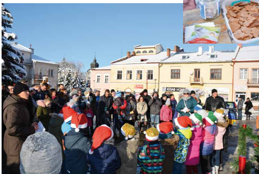
Publiczność oglądająca występy przedszkolaków