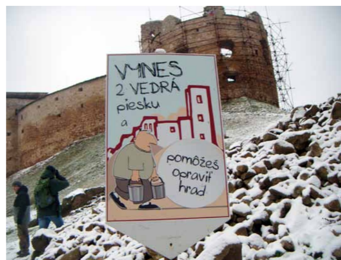
Ruiny zamku Makowica w Zborovie