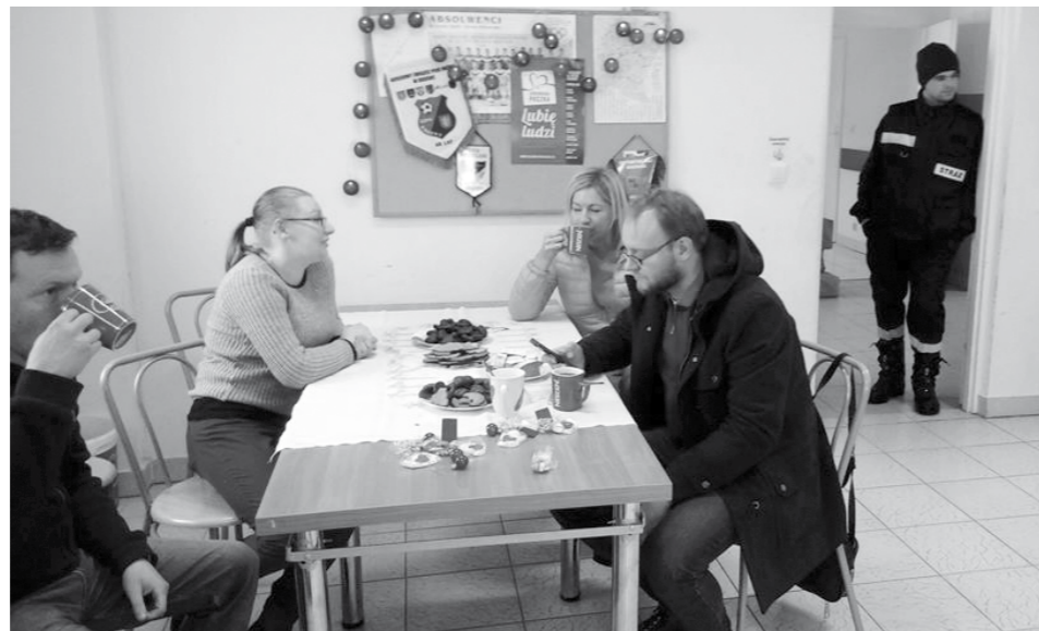
Wolontariusze podczas przerwy

z Równego oraz OSP z Tylawy za pomoc w dostarczaniu paczek do rodzin, Wasze wsparcie Druhowie jest bezcenne, a bez Was - nasza praca podczas finału byłaby