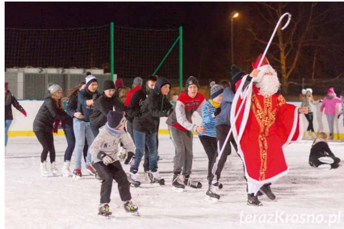
Otwarcie lodowiska ze św. Mikołajem