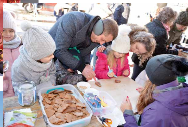
Rodzinne zdobienie pierniczek na dukielskim rynku