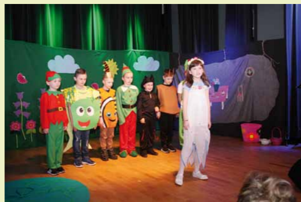
Fragment inscenizacji „Calineczka”