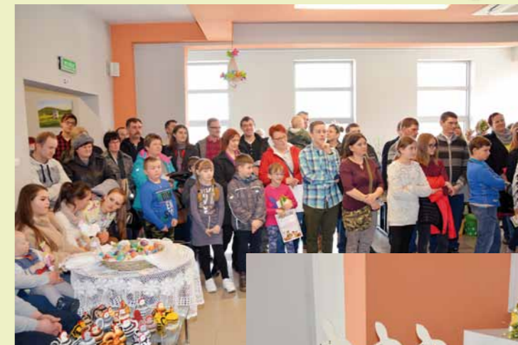
Uczestnicy kiermaszu podczas rozdania nagród w konkursach organizowanych przez Ośrodek Kultury w Dukli