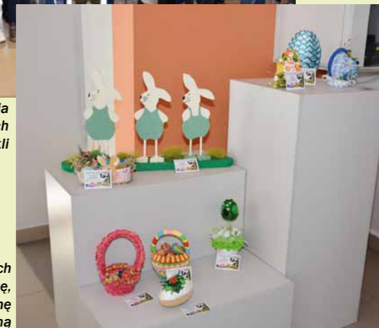
Fragment wystawy prac nagrodzonych w konkursie na najpiękniejszą pisanek, kraszankę, malowanek, stroik i palmę wielkanocną