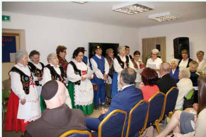
Występ artystyczny w wykonaniu seniorów