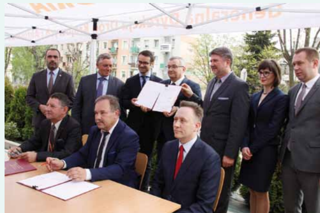
Minister Andrzej Adamczyk trzyma podpisany egzemplarz umowy wraz z europosełem Tomaszem Porębą i posłem Bożdanem Rzońcą