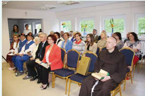
Zaproszeni goście z Seniorami