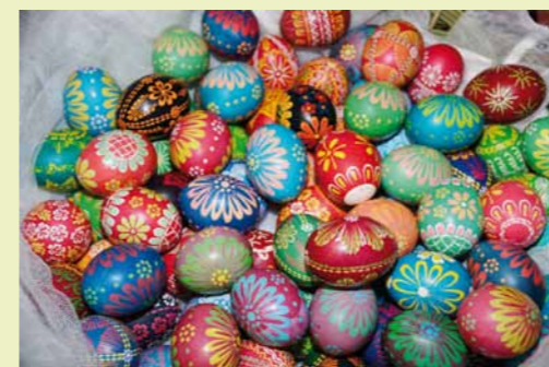
Pisanki wykonane przez panie z Mszany