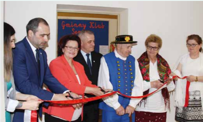
Oficjalne otwarcie Gminnego Klubu Seniora w Dukli