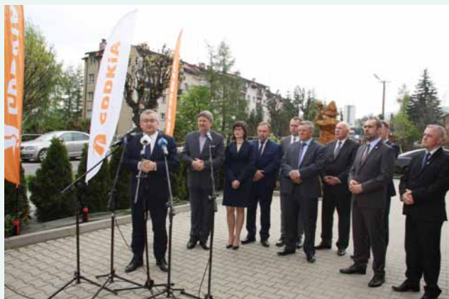
Minister infrastruktury i budownictwa Andrzej Adamczyk otworzył konferencję prasową