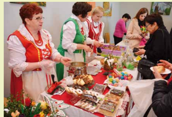
KGW z Równego ze swoim tradycyjnym jadalnym wielkanocnym