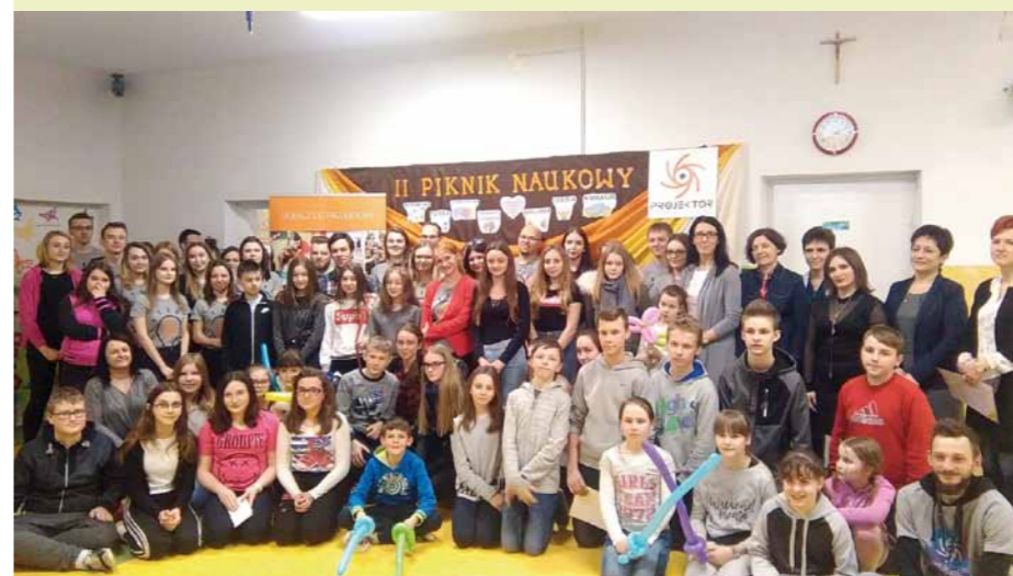
Uczestnicy pikniku z nauczycielami