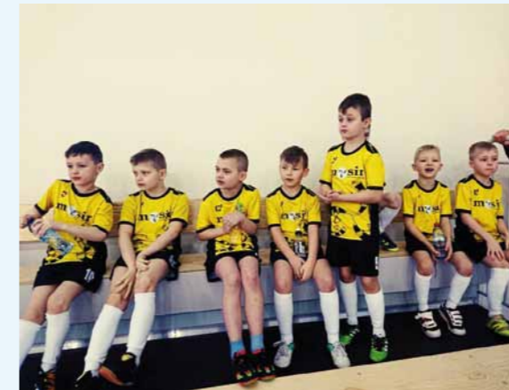
Zawodnicy rocznik 2011 podczas turnieju Nowy Żmigród Cup