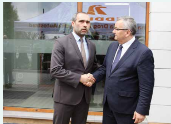
Burmistrz Dukli i minister Andrzej Adamczyk