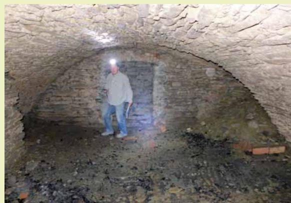
Łukowe piwnice w pierzei zachodniej dukielskiego rynku.