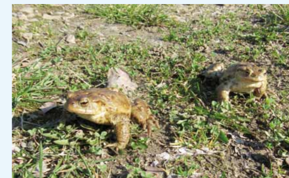
Ropuchy na spacerze