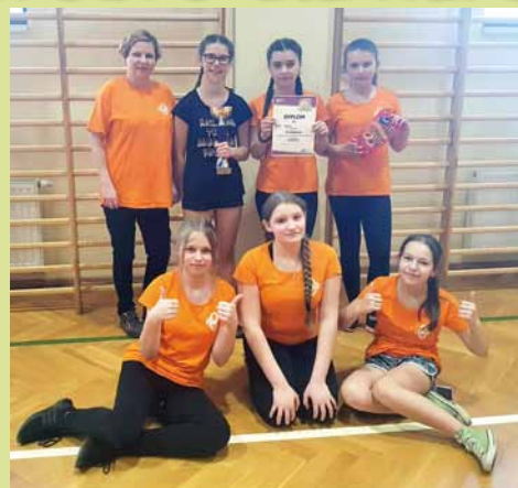
Srebrna drużyna z Dukli