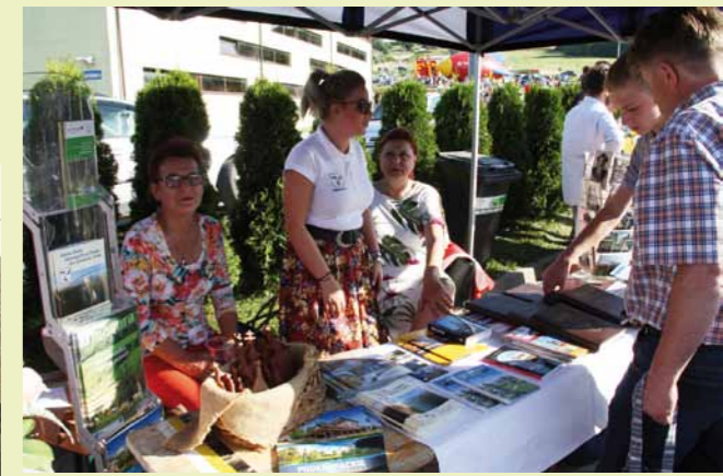
Materiały promocyjne przyciągały gości