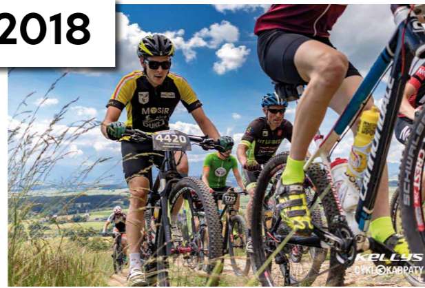
Zmagania zawodników MTB MOSiR Dukla w Łopusznej