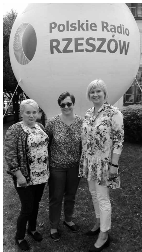
Członkinie Stowarzyszenia Razem lepiej zraszającego mieszkańców Nowej Wsi i Trzclany