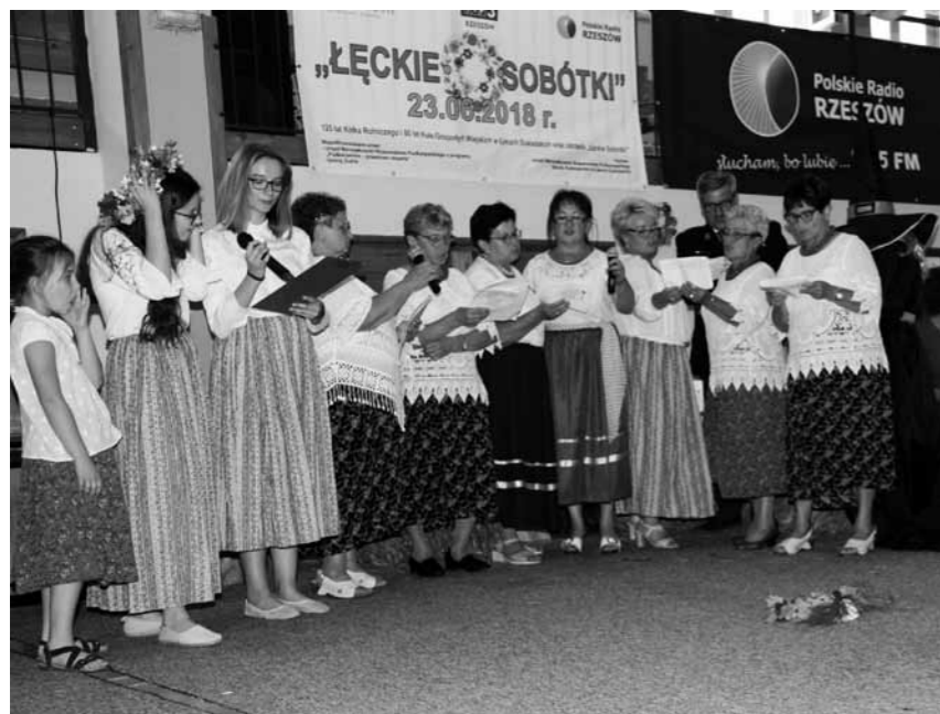
Pożegnanie wiosny, przywitanie lata podczas Łęckich Sobótek

Najpowszechniejszym obrzędem sobótek świętojańskich jest ognisko palone w wigilię św. Jana Chrzciciela, przy którym odbywały się obrzędy i zabawy związane z odejściem wiosny i nadejściem lata. To zwyczaj pogański, ale zakorzeniony mocno w naszej kulturze, ponieważ podjęto próbę zasymilowania tego zwyczaju z obrzędowością chrześcijańską. Często, gdy sobótki dopa-