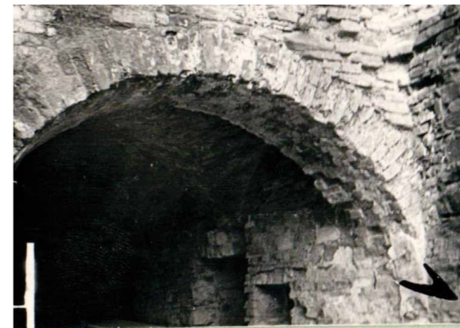
Szczegół architektoniczny budynku nr 25 na dukielskim Rynku przed odbudową