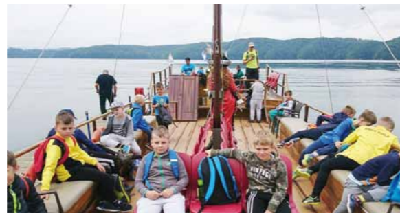
Wycieczka krajoznawcza w czasie obozu piłkarskiego w Rymanowie