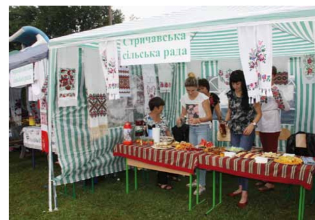
Jedno ze stoisk