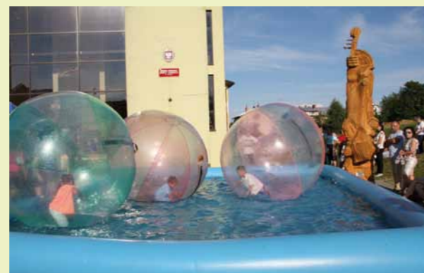
Atrakcji dla dzieci było sporo