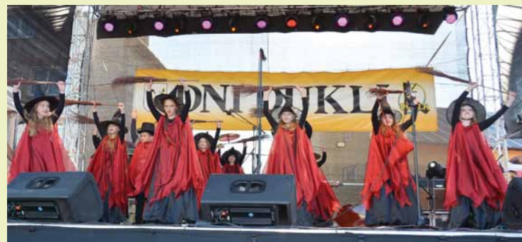
Występ zespołu tańca Gabi