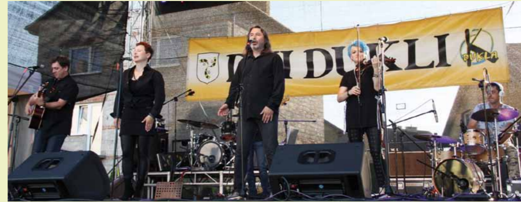
Lubelska Federacja Bardów podbiła serca słuchaczy