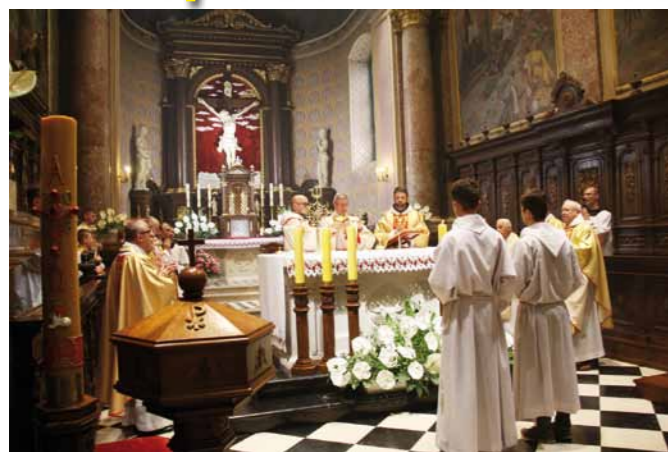
Msza odpustowa w sanktuarium św. Jana z Dukli