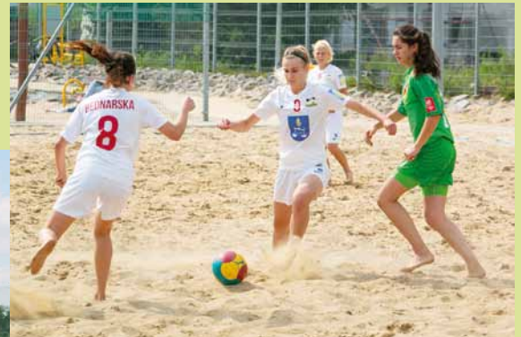
Rozgrywki gruzyn kobiecych.