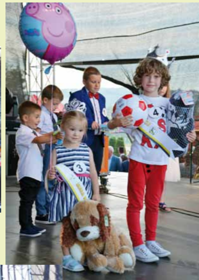
Mała Miss i Mały Mister Dni Dukli 2018