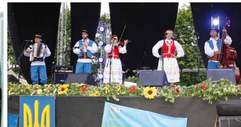
Występ Kapeli Duklanie