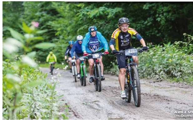
Rywalizacja dukielskich zawodników podczas Cyclokarpat w Pruchniku