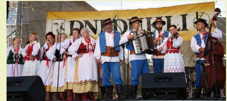
Występ zespołu Szarotka Duklanie cieszył się powodzeniem