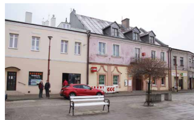
Budynek nr 25 na dukielskim rynku - kwiecień 2017 r.