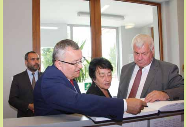
Wpis do księgi pamiątkowej