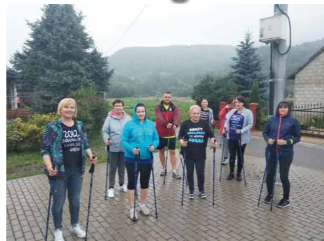
Uczestniczkom zajęć z nordic walking nie przeszkadzała nawet pochmurna pogoda