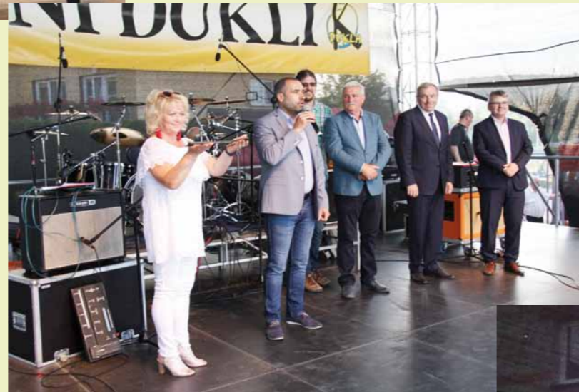
Dni Dukli 2018 oficjalnie rozpoczęte! Powitanie delegacji zagranicznych.