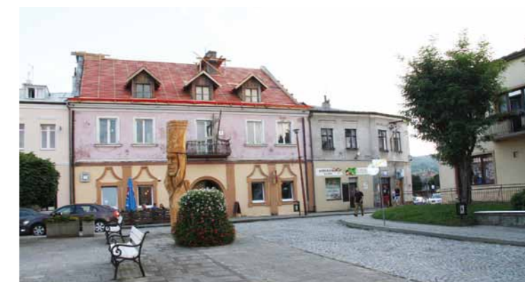
Budynek nr 25 na dukielskim rynku - lipiec, podczas remontu dachu