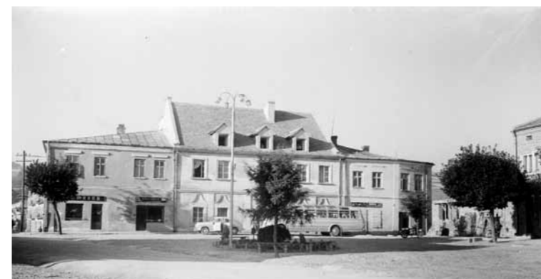
Hotel Miejski Turysta w Dukli początkiem lat sześćdziesiątych XX wieku