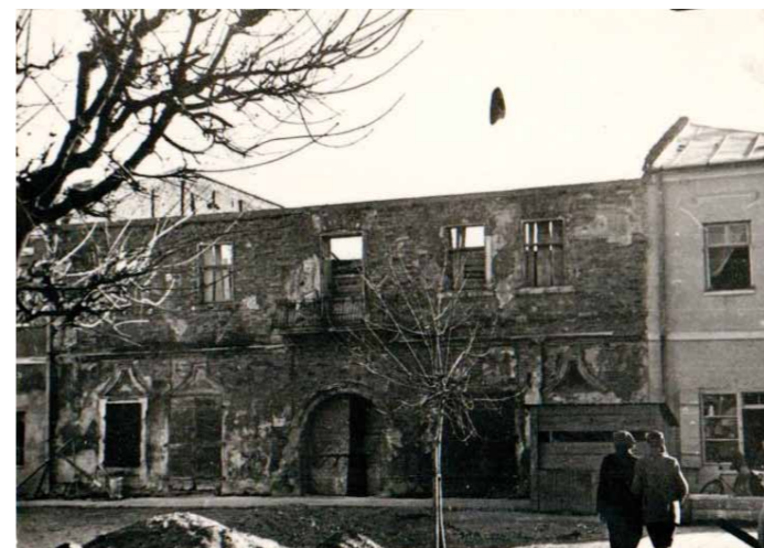
Budynek nr 25 na dukielskim Rynku na początku odbudowy końcem lat pięćdziesiątych