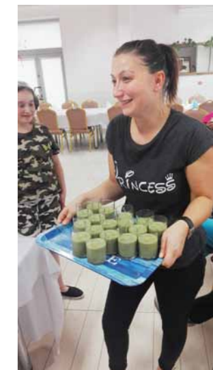
Uczestniczki warsztatów mogły własnoręcznie sporządzić pyszne koktajle z naturalnych produktów