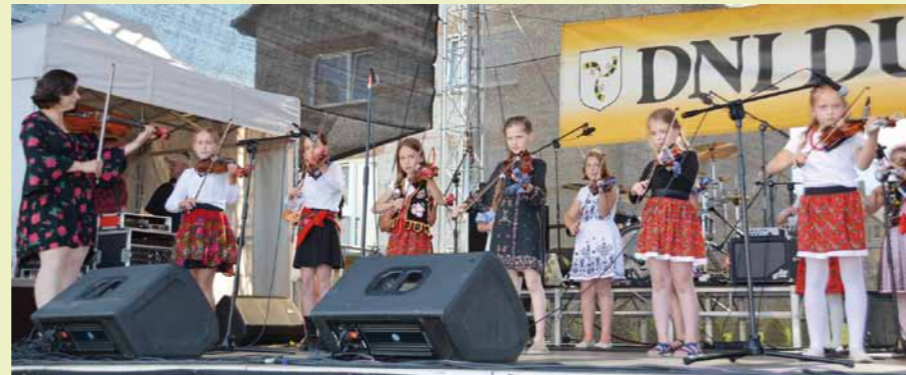
Występ szkoły skrzypcowej