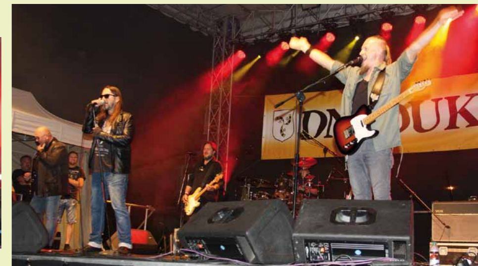
Zespół Golden Life