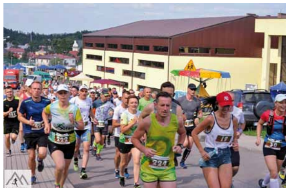
Uczestnicy II Biegu Sw Jana z Dukli