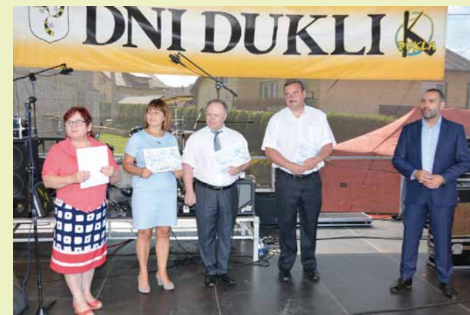
Wręczenie nagród burmistrza Dukli we Współzawodnictwie w Dziedzynie Kultury Szkół Gminy Dukla