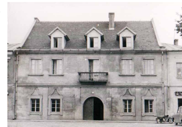
Budynek nr 25 na dukielskim Rynku po odbudowie początkiem lat sześćdziesiątych