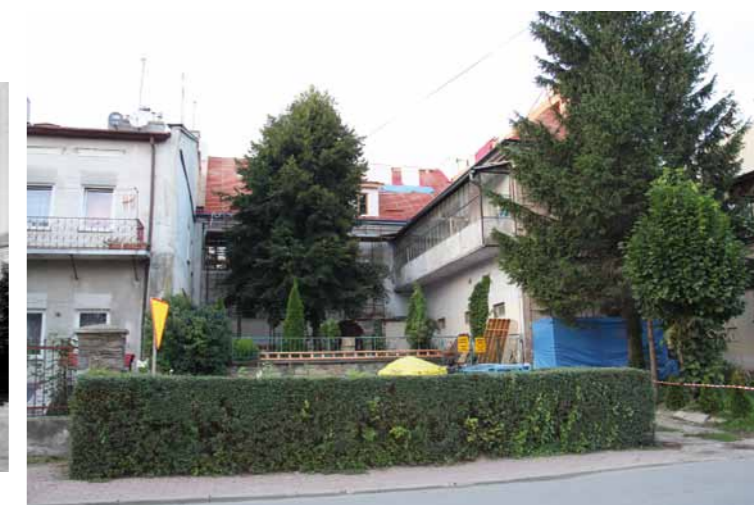
Zaplecze domu rabina