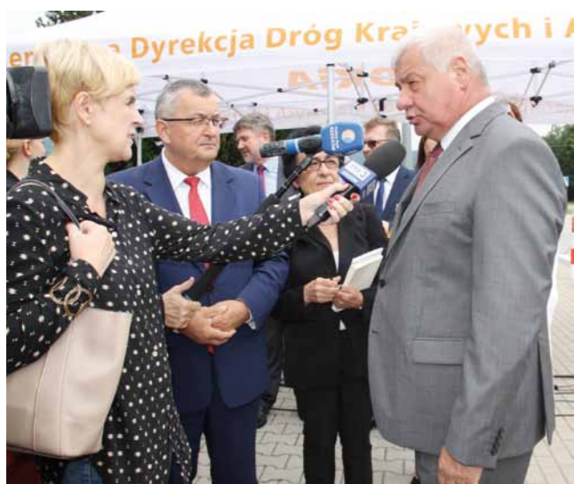
Konferencja prasowa dla dziennikarzy