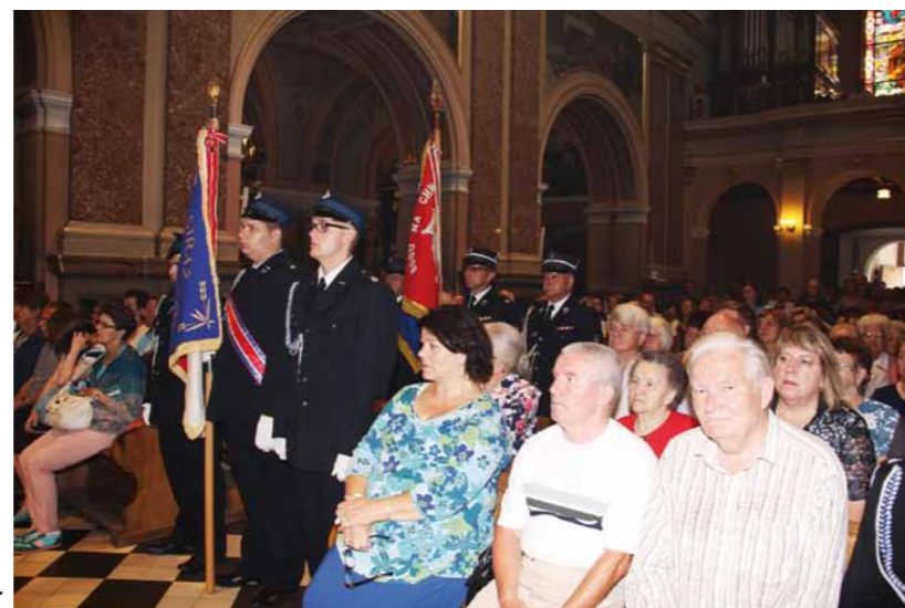
Uczestnicy mszy św.