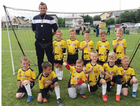
Zawodnicy rocznika 2011 Mosir Dukla podczas Turnieju w Besku