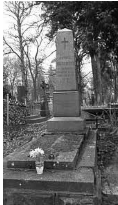
Grób Alfreda Biesiadeckiego na cmentarzu Łyczakowskim we Lwowie