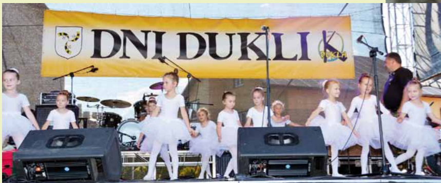
Występ szkoły baletowej