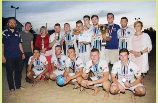
JKS Jarosław - 1. miejsce