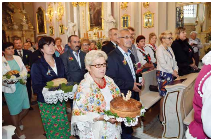
Procesja grup dożynkowych z darami