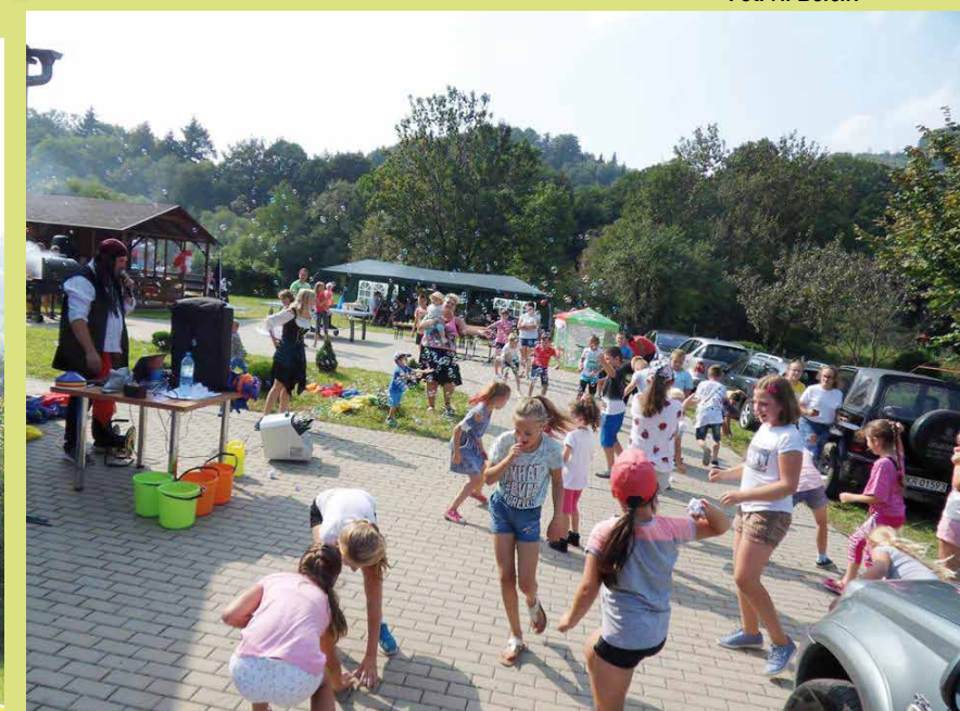
Najmłodszy uczestnicy biorący udział w Pikniku w Nowej Wsi