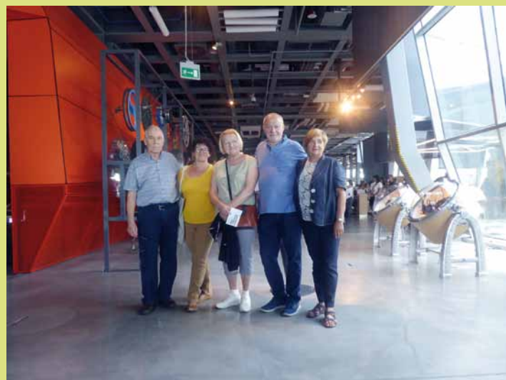
W Centrum Nauki Kopernik