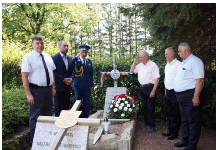
Złożenie wieńca na grobie rumuńskiego lotnika