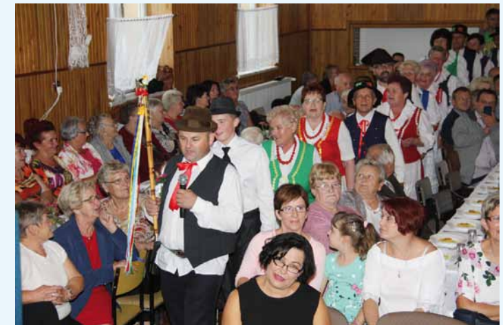
Fragment inscenizacji obrzędu weselnego - W drodze do domu panny młodej