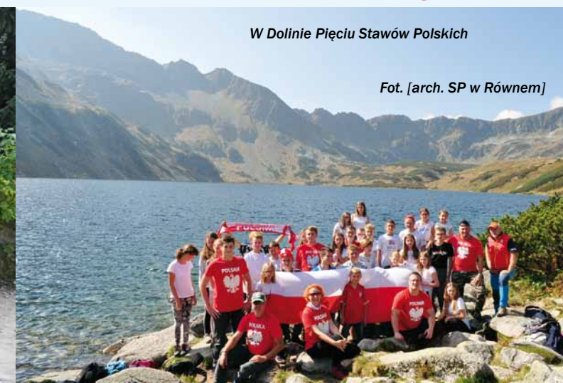
W Dolinie Pięciu Stawów Polskich