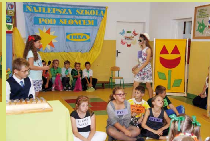
Program zaprezentowały dzieci z młodszych i starszych klas SP w Wietrznie