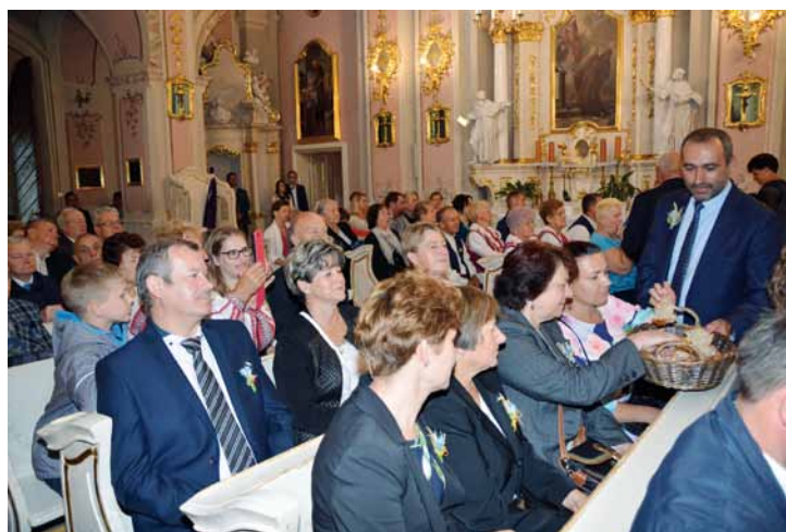
Dzielenie chlebem dożynkowym