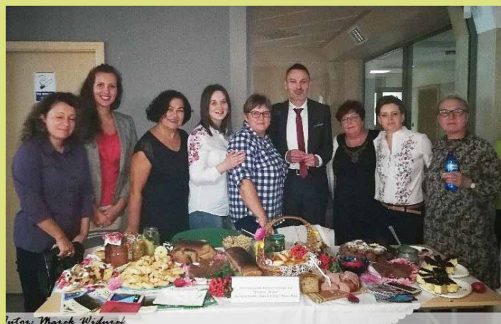
autor: Marek Włodarczyk