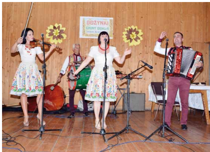
Występ kapeli z Wielkiego Bereznego