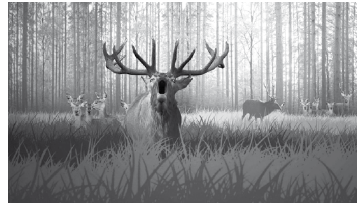
Jeleń na rykowisku

Bekowisko danieli odbywa się zwykle od połowy października do połowy listopada. W tym czasie, podobnie jak byki jelenia, byk