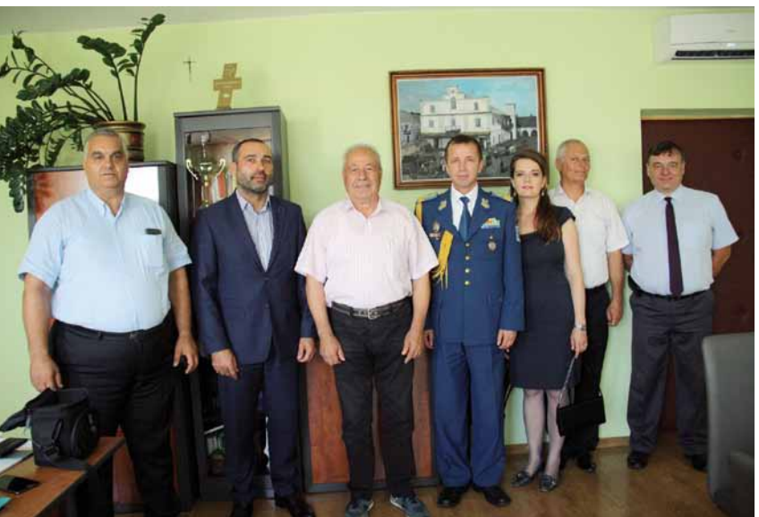
Delegacja rumuńska z wizytą u burmistrza Dukli