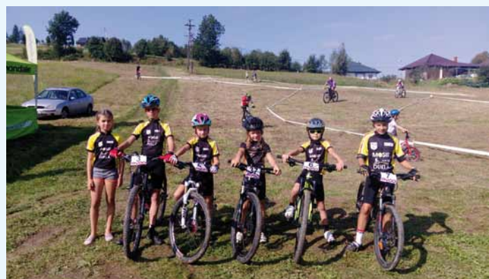
Zawodnicy MOSiR Dukla