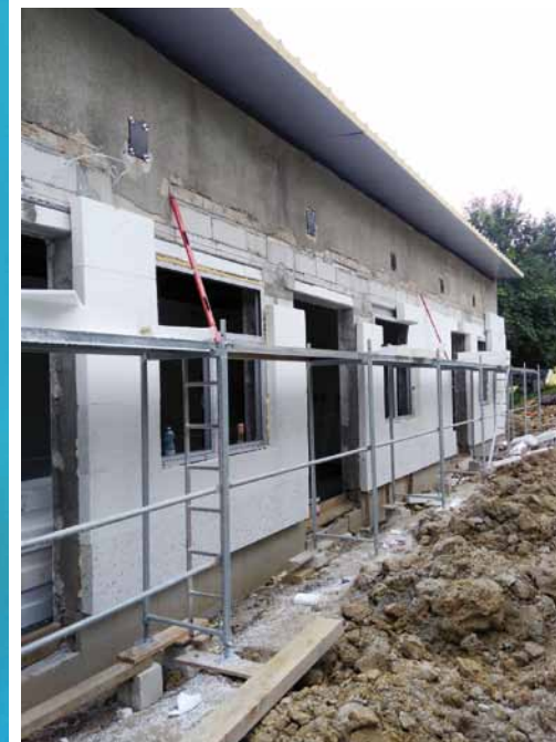
Prace budowlane związane z przystosowaniem budynku magazynowego na żłobek