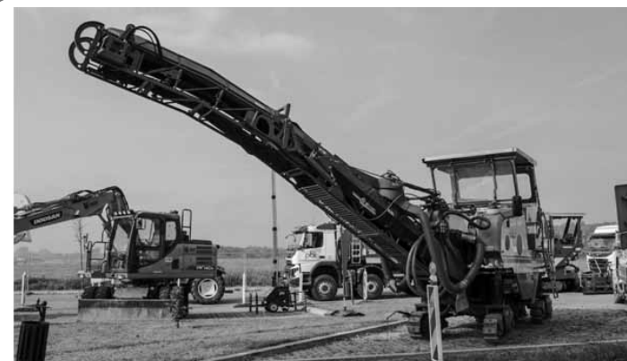
Prezentacja sprzętu grupy PBI

- Badanie stanu trzeźwości wykazało, że rowerzysta miał ponad promil alkoholu w organizmie. Kierowca scani był trzeźwy - informuje st. asp. Paweł Buczyński z krośnińskiej policji.