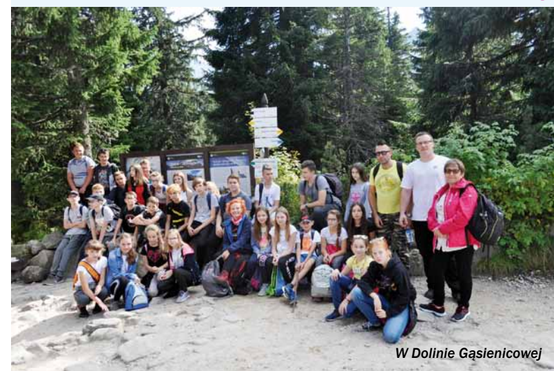
W Dolinie Gąsienicowej