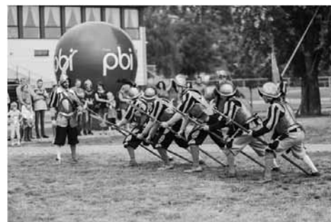
Wspólne działanie w ramach jednej Grupy świętowano na nadwiślańskim Bulwarze im. Piłsudskiego w Sandomierzu około 1200 osób – pracowników PBI wraz z rodzinami.

Sandomierskie Kopalnie Dolomitu, Kamieniołomy Świętokrzyskie, rzeszowskie Przedsiębiorstwo Produkcji Materiałów Drogowych, wytwórnie mas bitumicznych, prefabrykatów i betonu – w sumie 13 spółek od dziś będzie działać pod wspólną