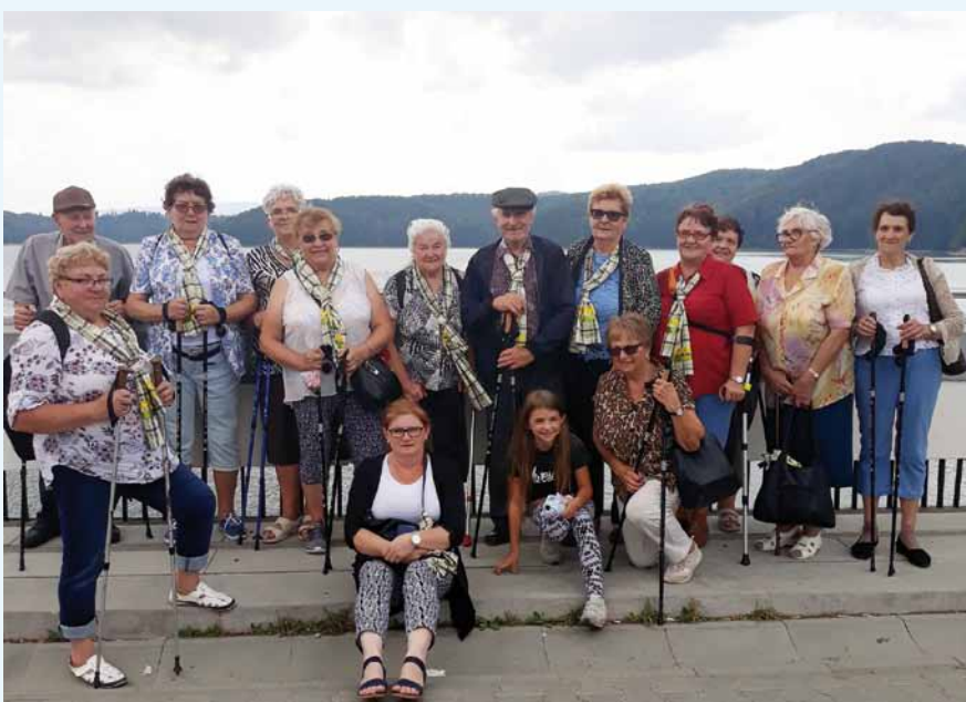
Nad Jesiorem Solińskim i w Krasieczynie