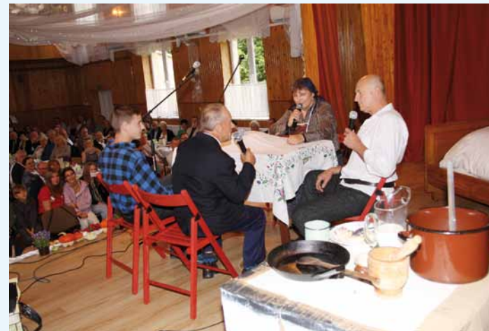
Fragment inscenizacji obrzędu weselnego - z mównicy