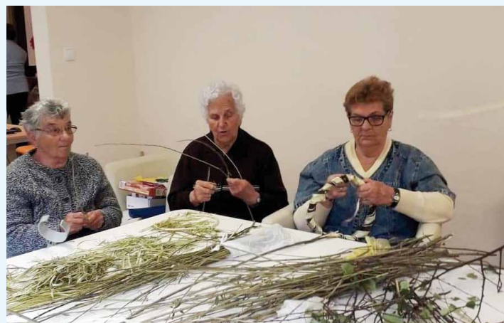
Pleciecie sobótkowych wianków