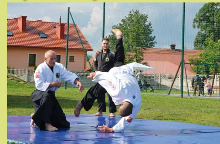
Pokaz sztuk walki