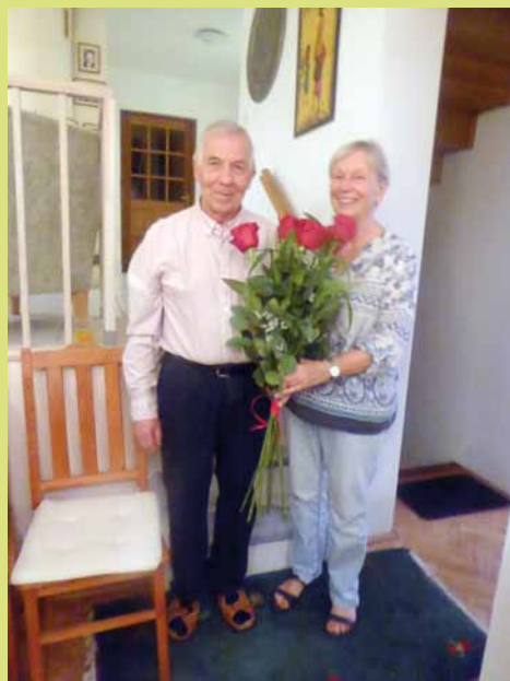
Kwiaty dla solenizanta