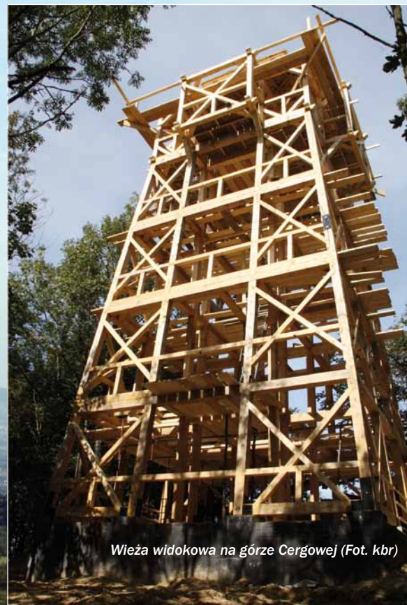
Wieża widokowa na górze Cergowej