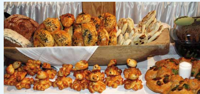
Tradycyjne wypieki weselne