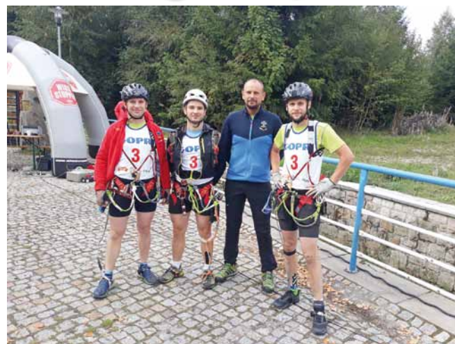
Zwycięzca drużyna ratowników.